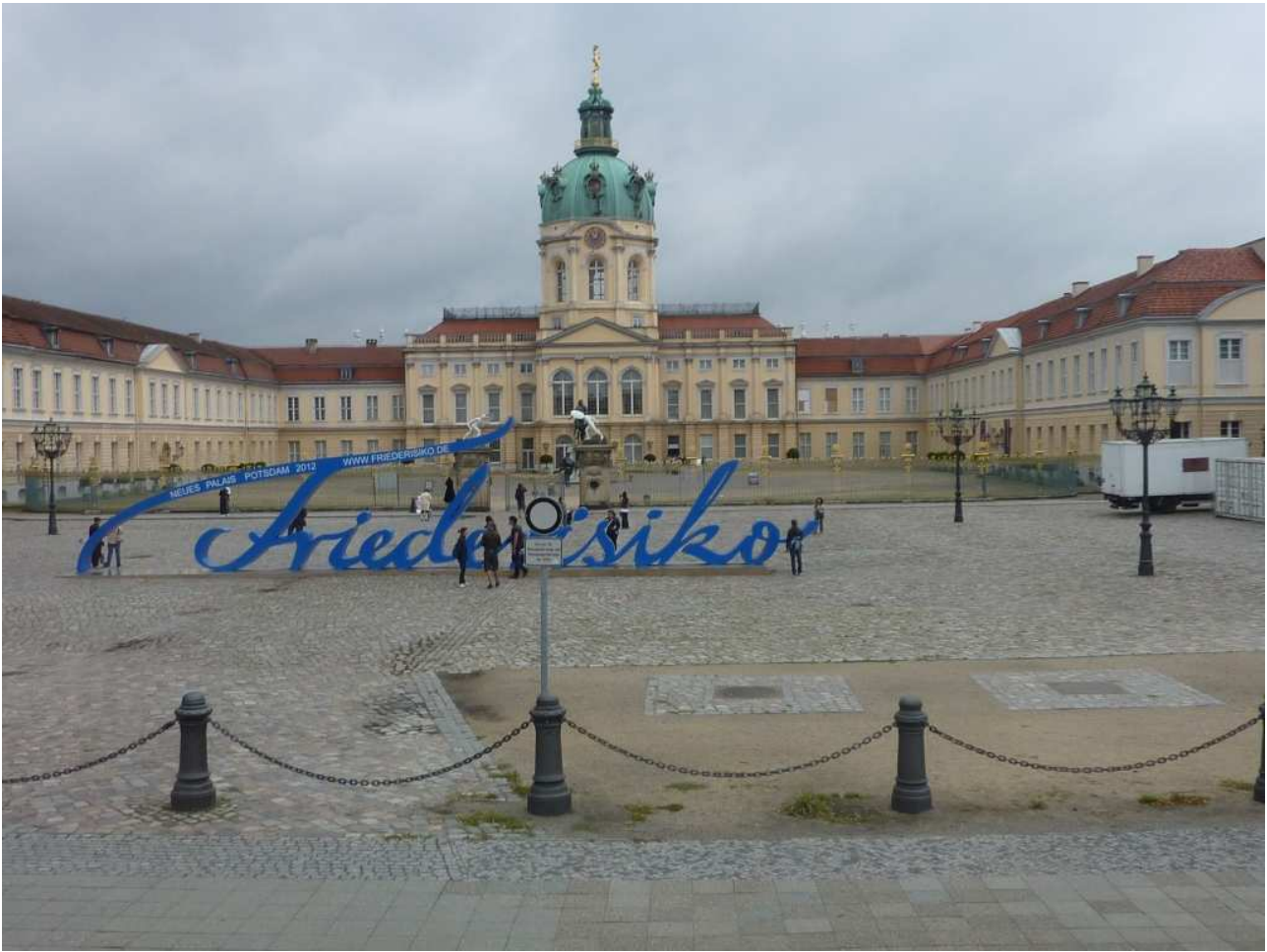
18/08/10 Berlino in bus il castello di Charlottenburg