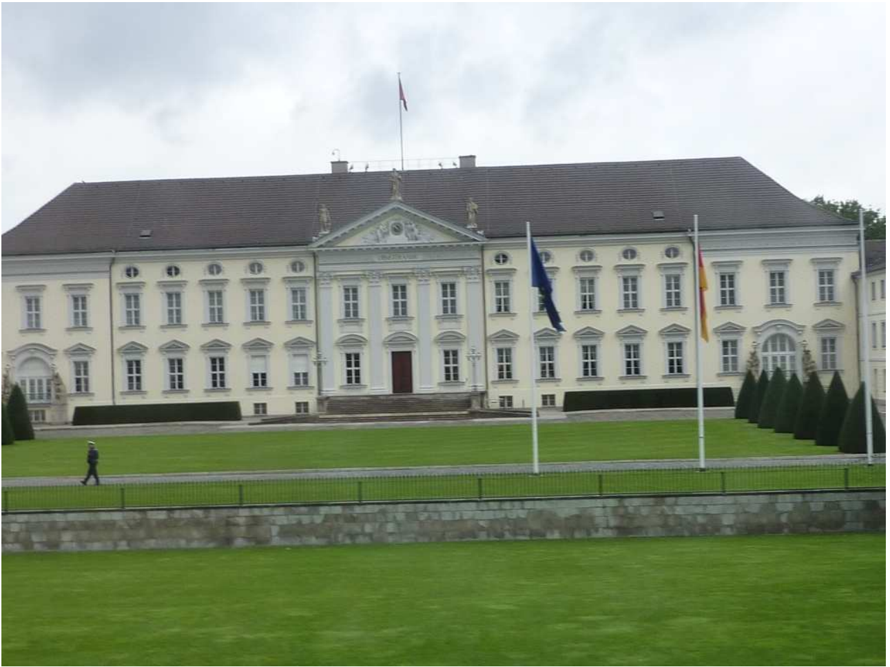
18/08/10 Berlino in bus uno dei tanti palazzi che ammiriamo dai finestrini