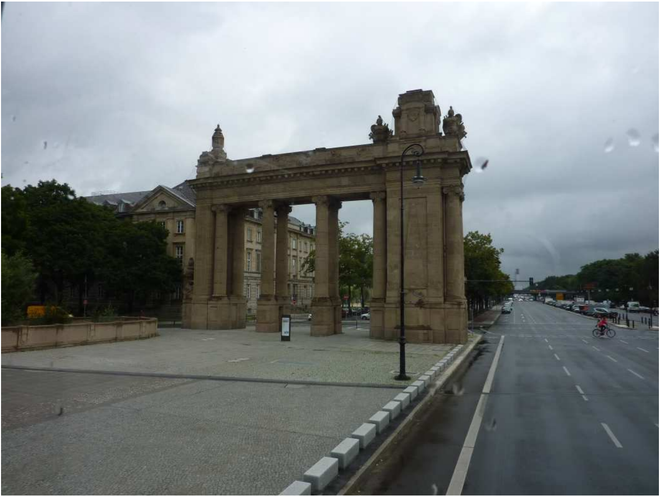
18/08/10 Berlino in bus un altro palazzo visto dai finestrini