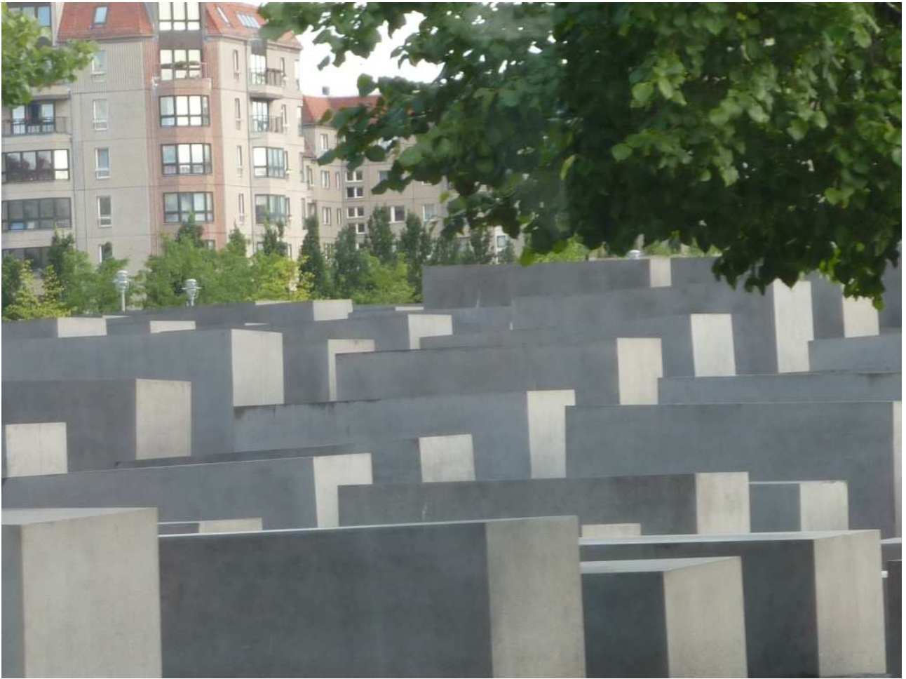
18/08/10 Berlino in bus Monumento all'olocausto