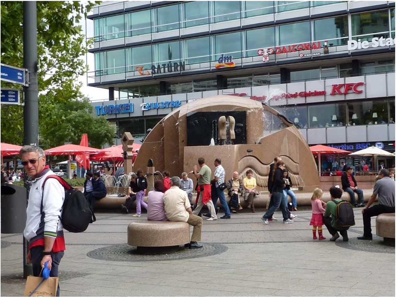
18/08/10 Berlino in bus Centro con fontana