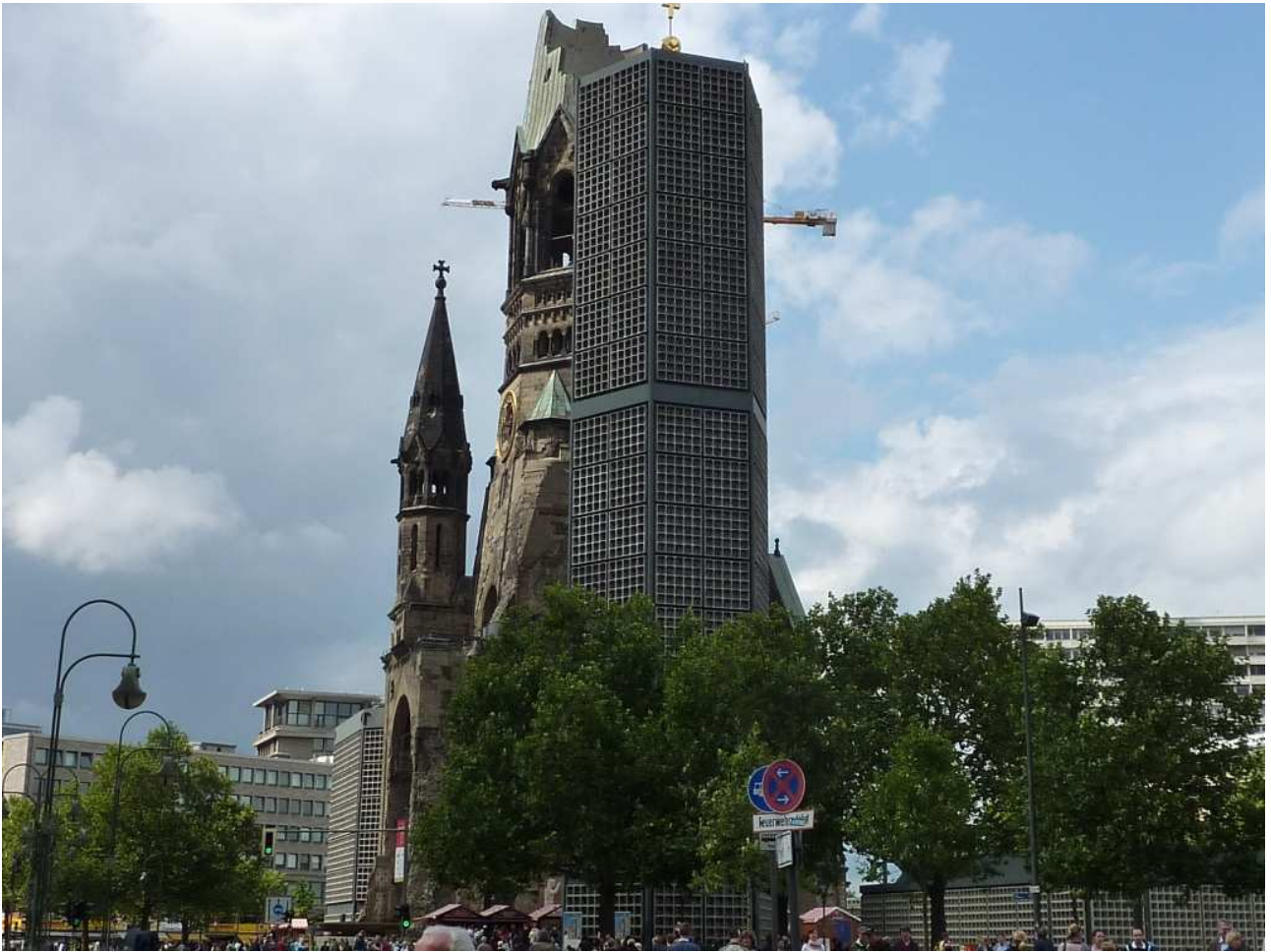
18/08/10 Berlino in bus la Chiesa della Memoria