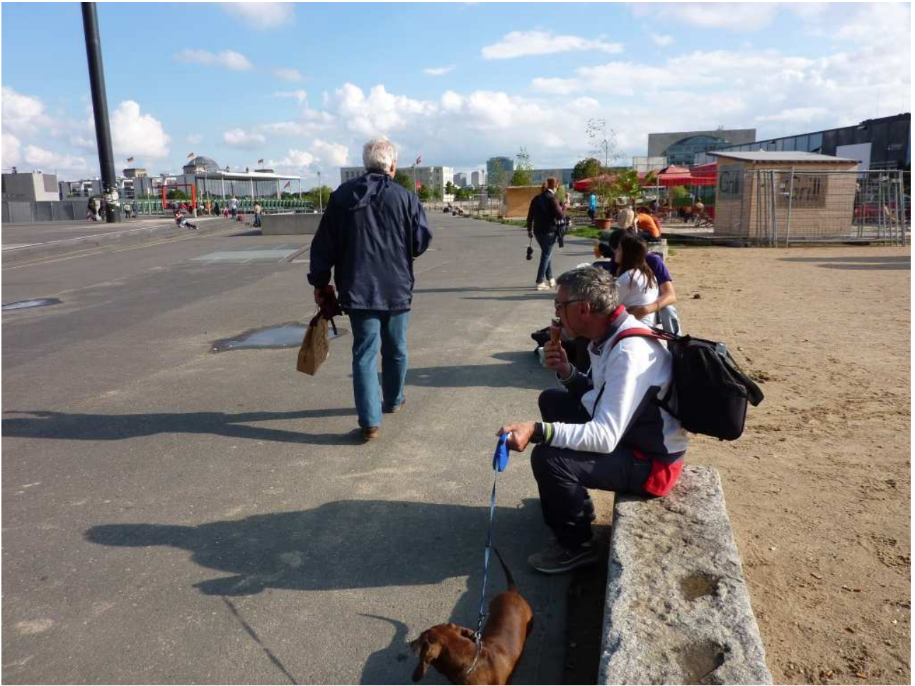
18/08/10 Berlino in bus Un gelato alla fine del Tour in prossimità della stazione centrale