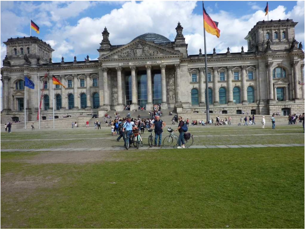
19/08/10 Berlino in bici foto ricordo davanti al Reichstag