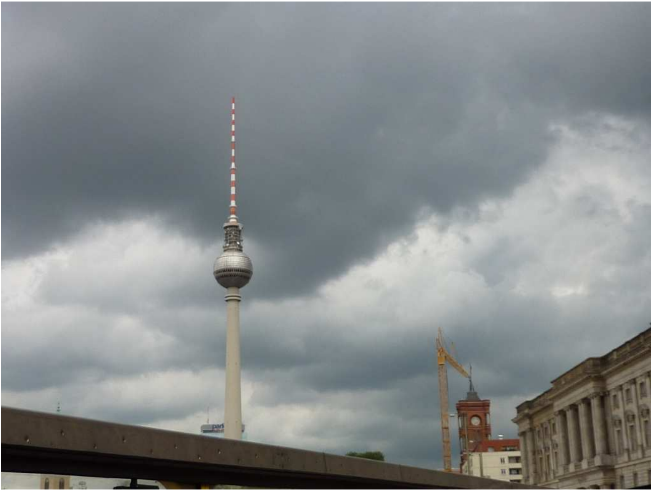
18/08/10 Berlino in bus La torre della televisione