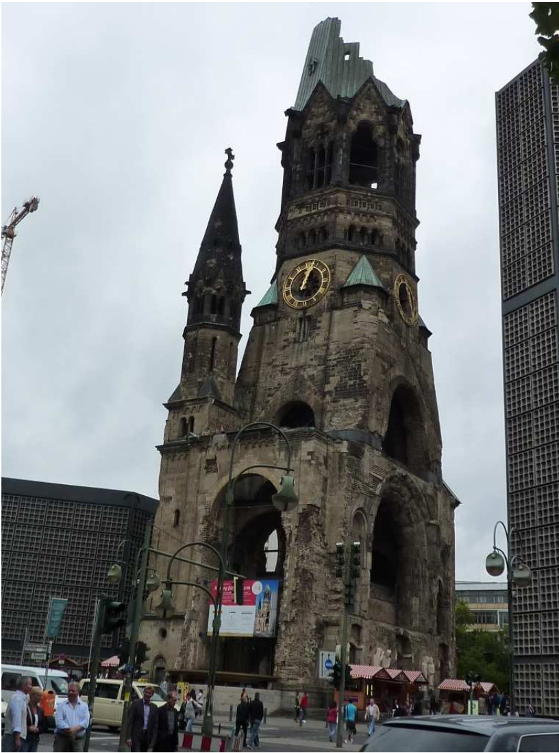
18/08/10 Berlino in bus La chiesa della Memoria