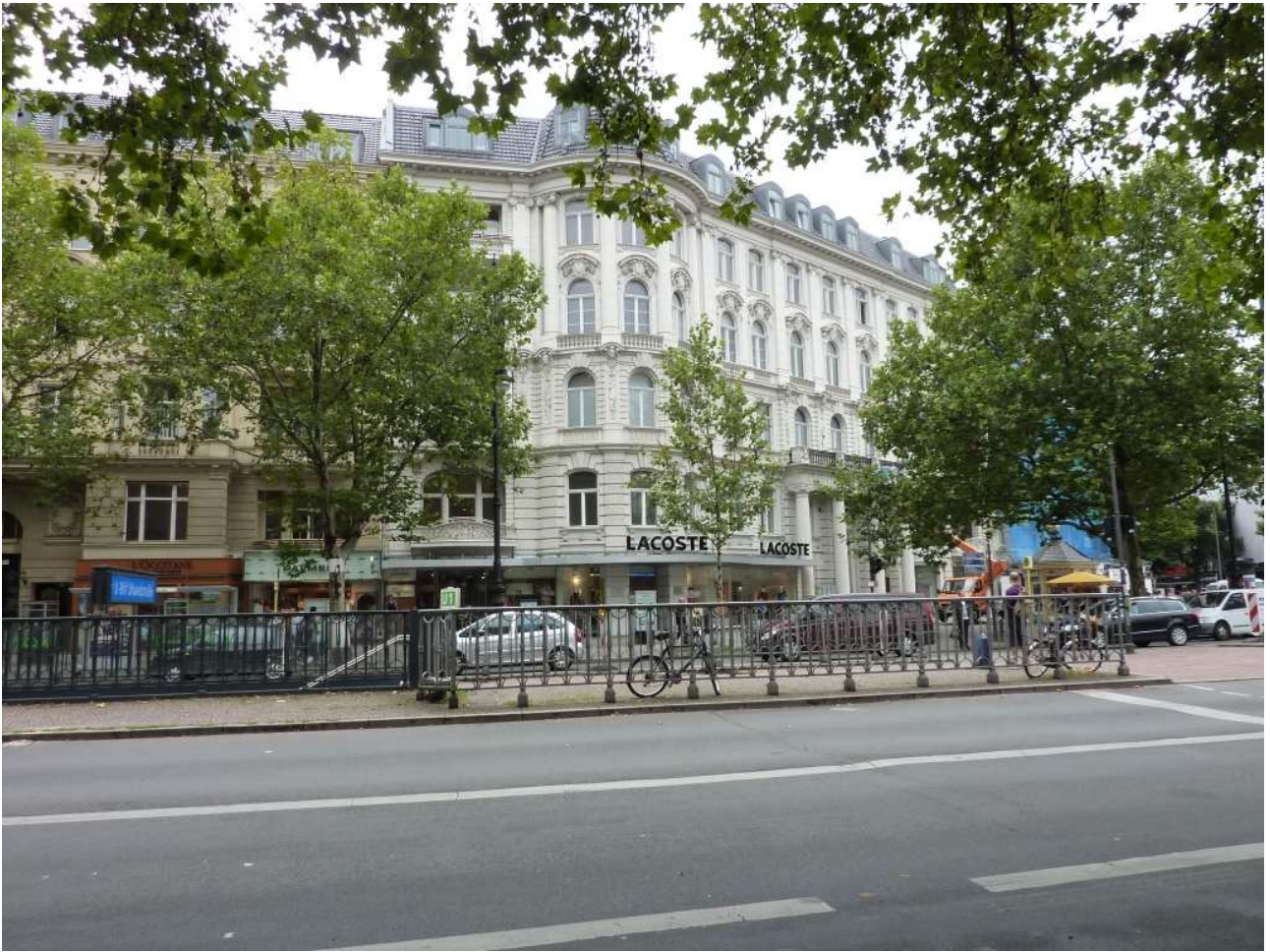
18/08/10 Berlino in bus un altro bel palazzo in una via del centro