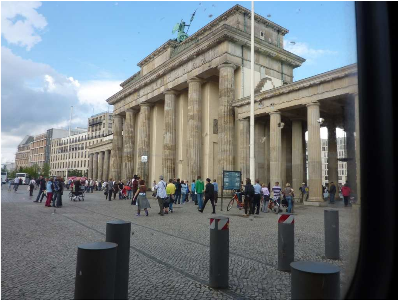
18/08/10 Berlino in bus la Porta di Brandeburgo