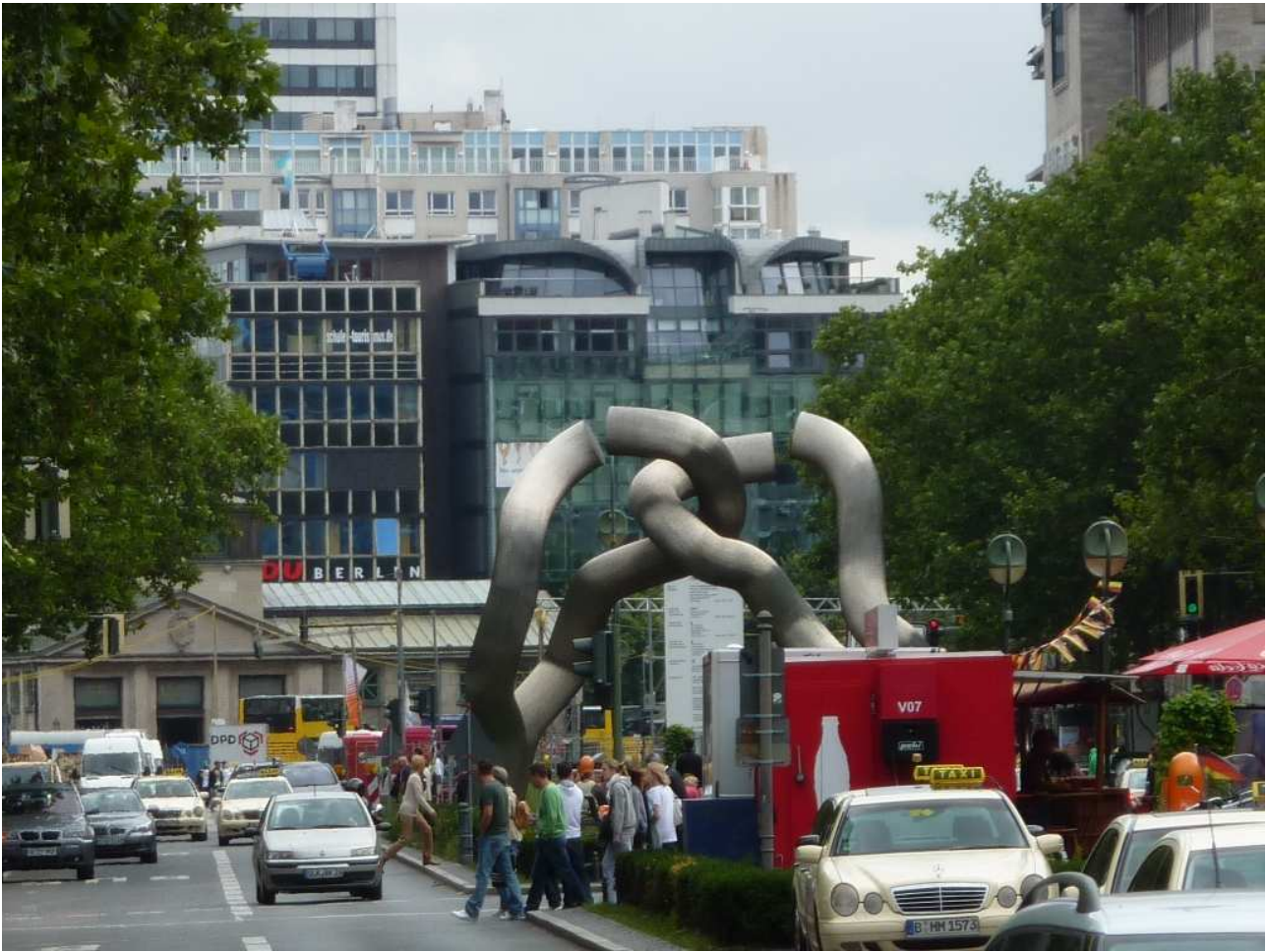
18/08/10 Berlino in bus Centro