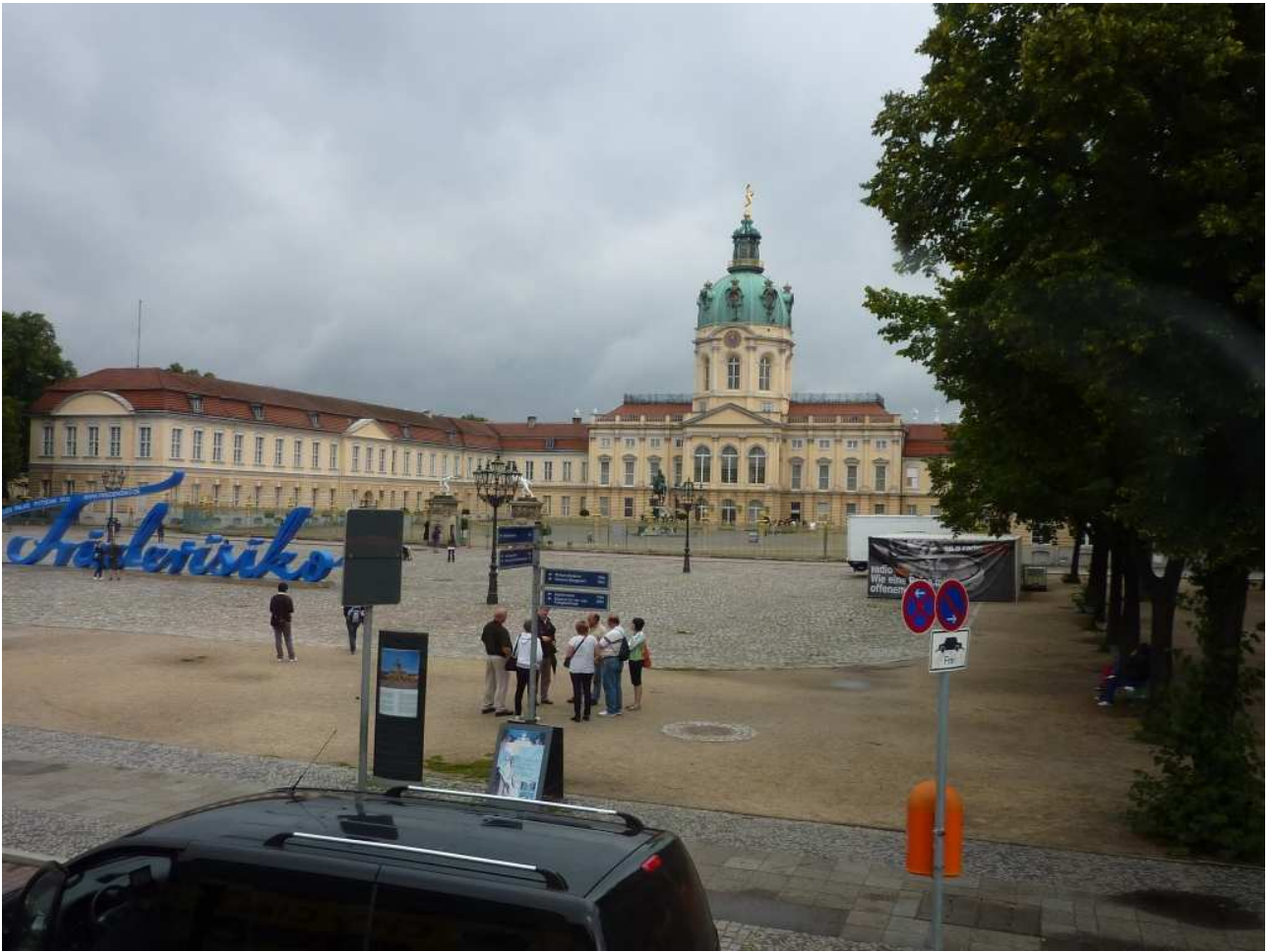
18/08/10 Berlino in bus il castello di Charlottenburg