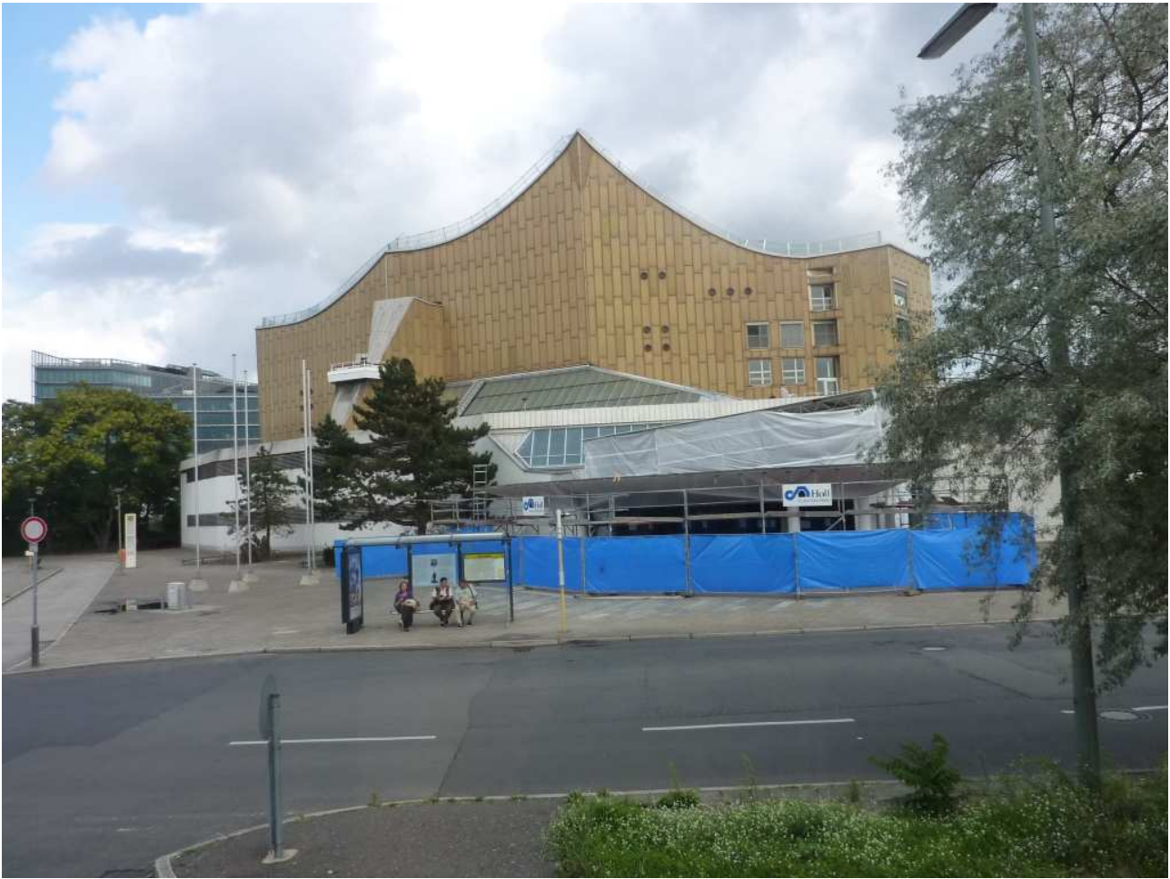
18/08/10 Berlino in bus Palazzo della musica