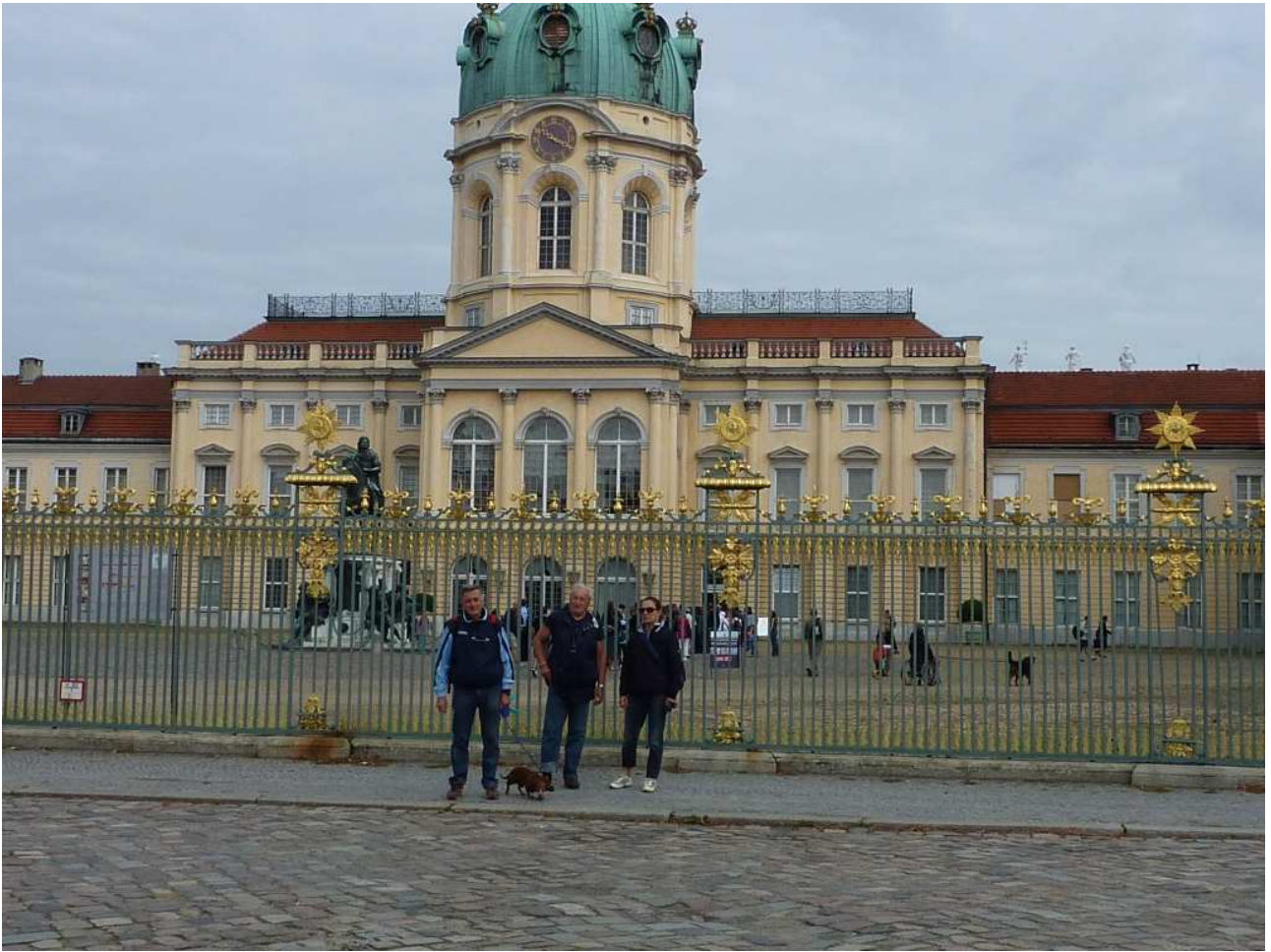
19/08/10 Berlino in bici. Davanti al Castello di Charlottenburg