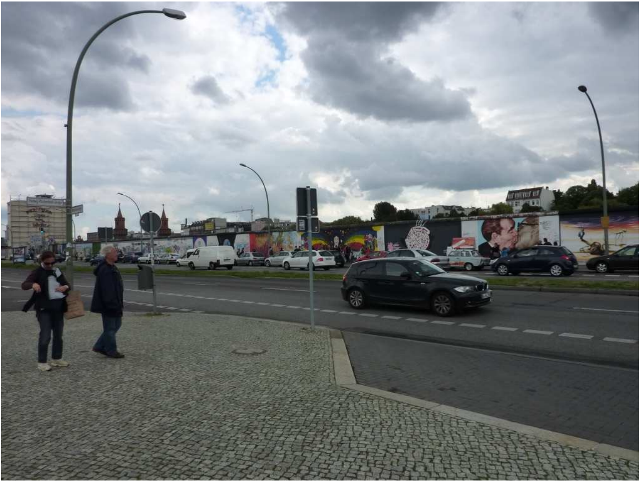
18/08/10 Berlino in bus di fronte e noi un pezzo del Muro