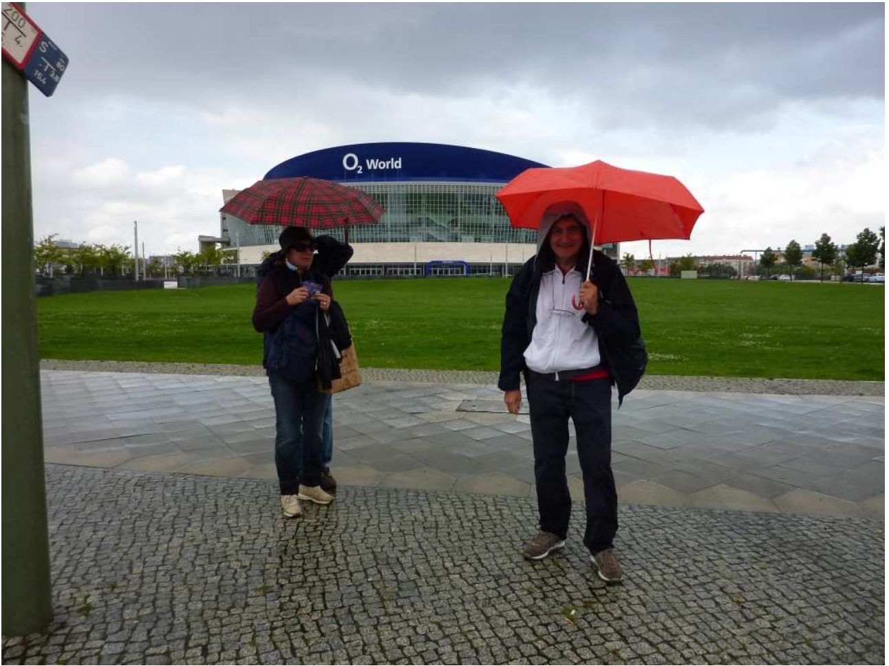
18/08/10 Berlino in bus aspettando il bus ..... sotto l'acqua sullo sfondo il palazzetto dello sport