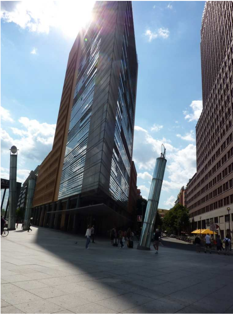
19/08/10 Berlino in bici. Prospettiva insolito di un palazzo del centro