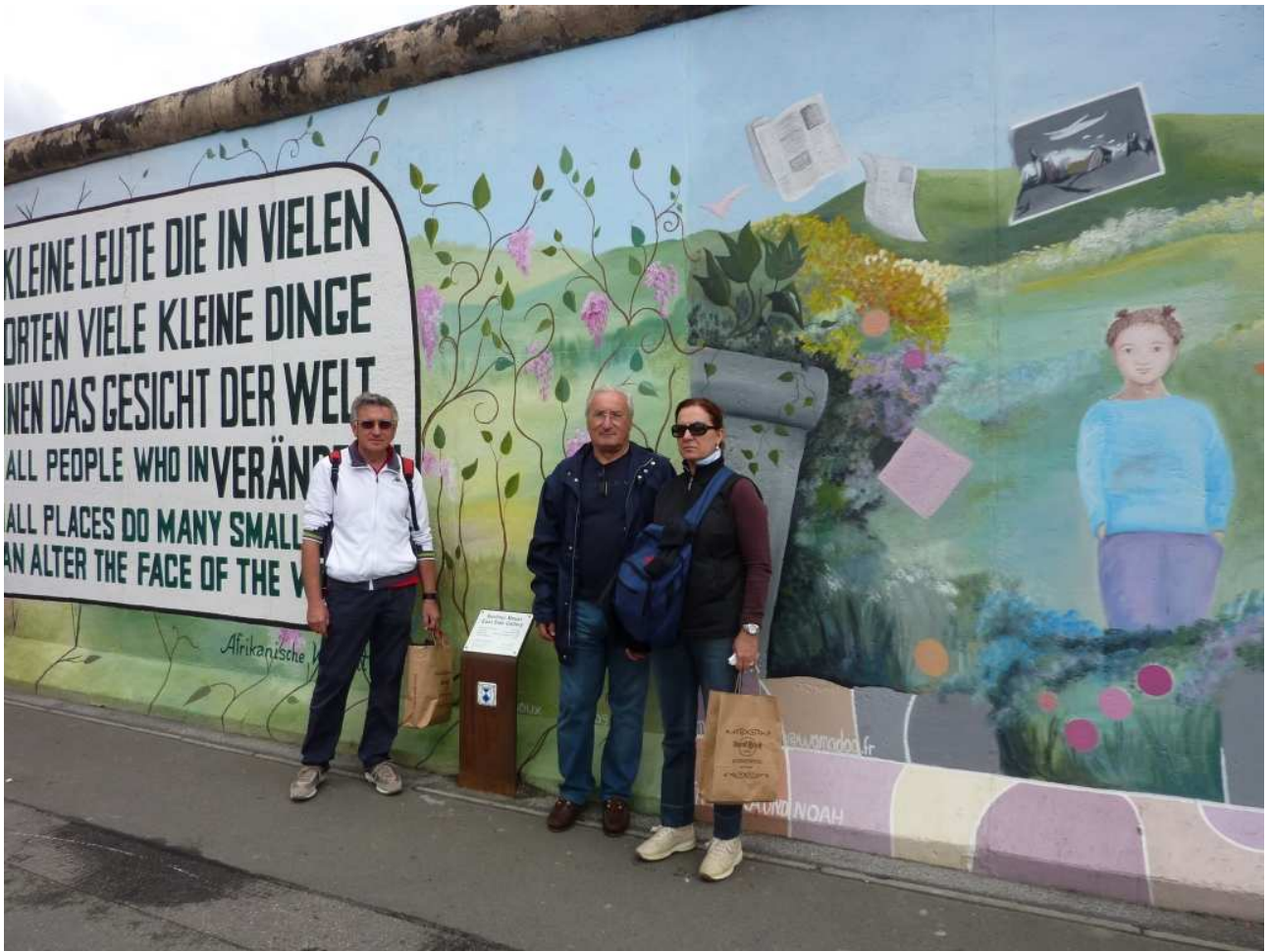
18/08/10 Berlino in bus foto ricordo davanti a ciò che resta del Muro