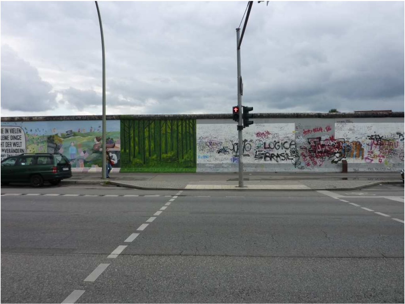
18/08/10 Berlino in bus ancora uno scorcio del Muro