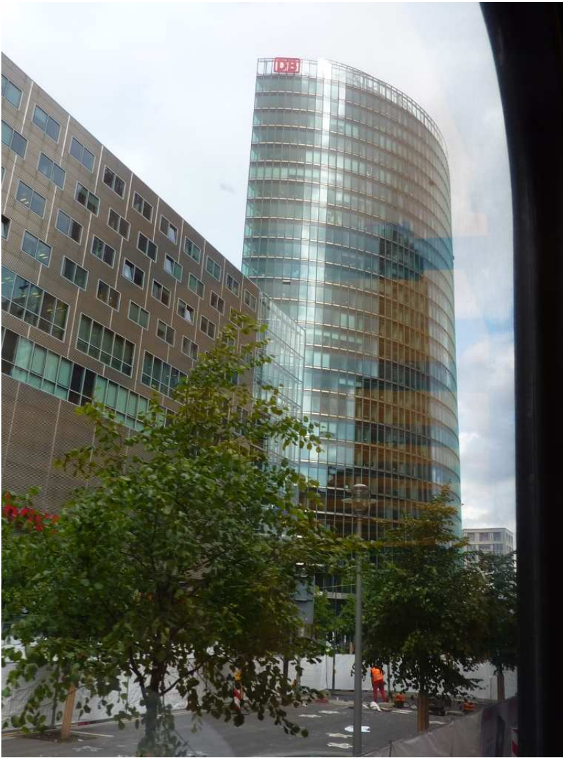
18/08/10 Berlino in bus Palazzi in Potsdammer Platz