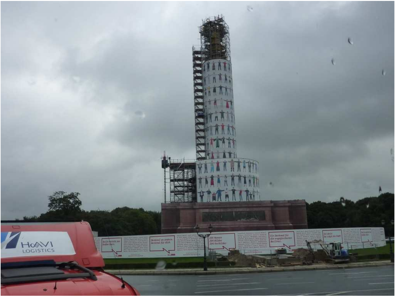
18/08/10 Berlino in bus La Siegessaule purtrotto sotto restauro. Una statua alla Vittoria