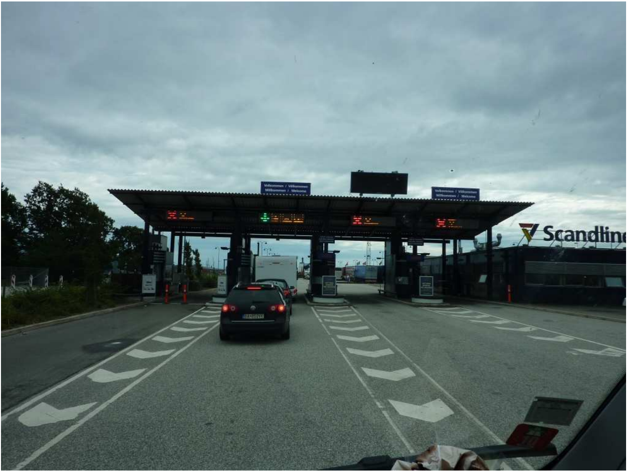
17/08/10 Danimarca Ingresso al porto di Getser da dove ci imbarcheremo per Rostock in Germania