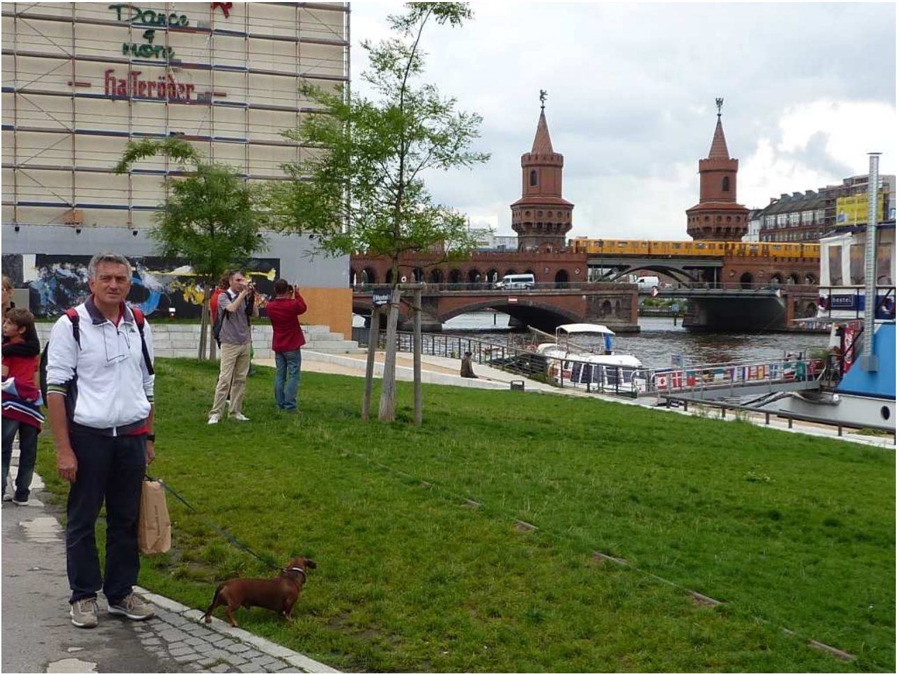
18/08/10 Berlino in bus al di là del Muro Berlino Ovest