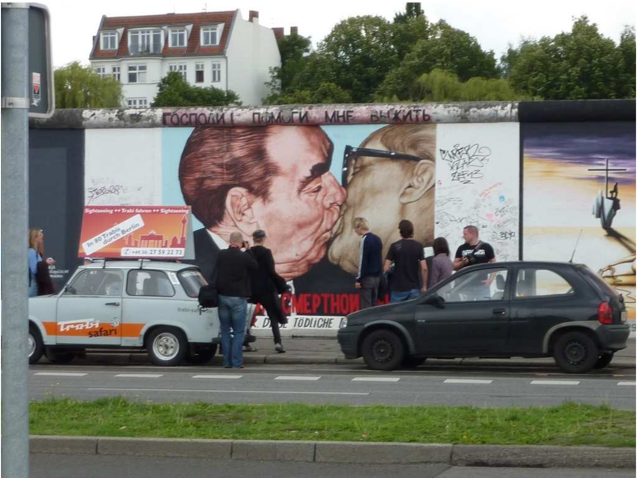
18/08/10 Berlino in bus un particolare del Muro .... Notare l'automobile Trabant simbolo della DDR