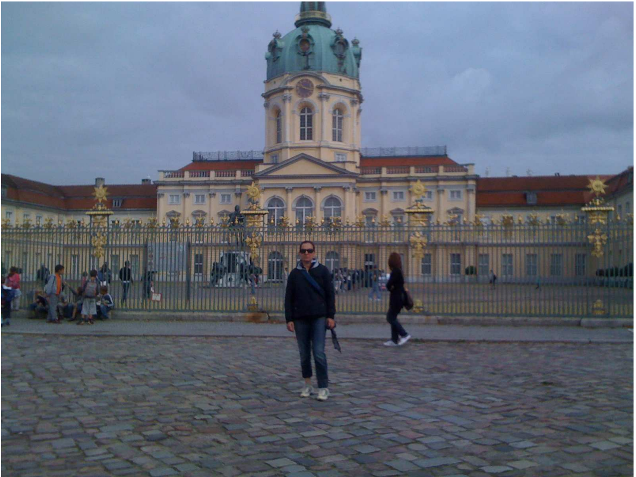
19/08/10 Berlino in bici. Davanti al castello di Charlottenburg