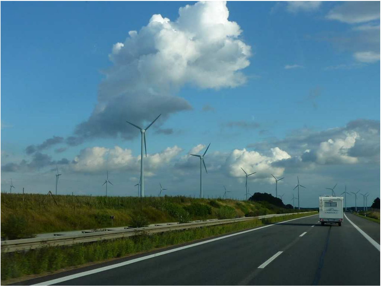
17/08/10 Danimarca In viaggio verso Berlino sulle splendide e gratuite autostrade tedesche