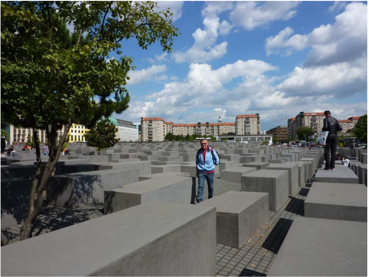
19/08/10 Berlino in bici. Il monumento all'Olocausto