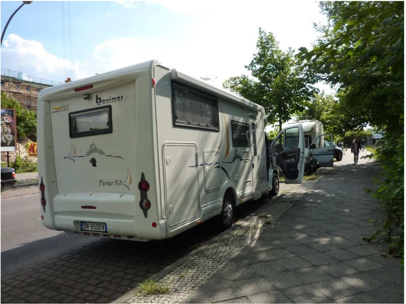
19/08/10 Berlino in bici Pronti per lasciare la capitale tedesca