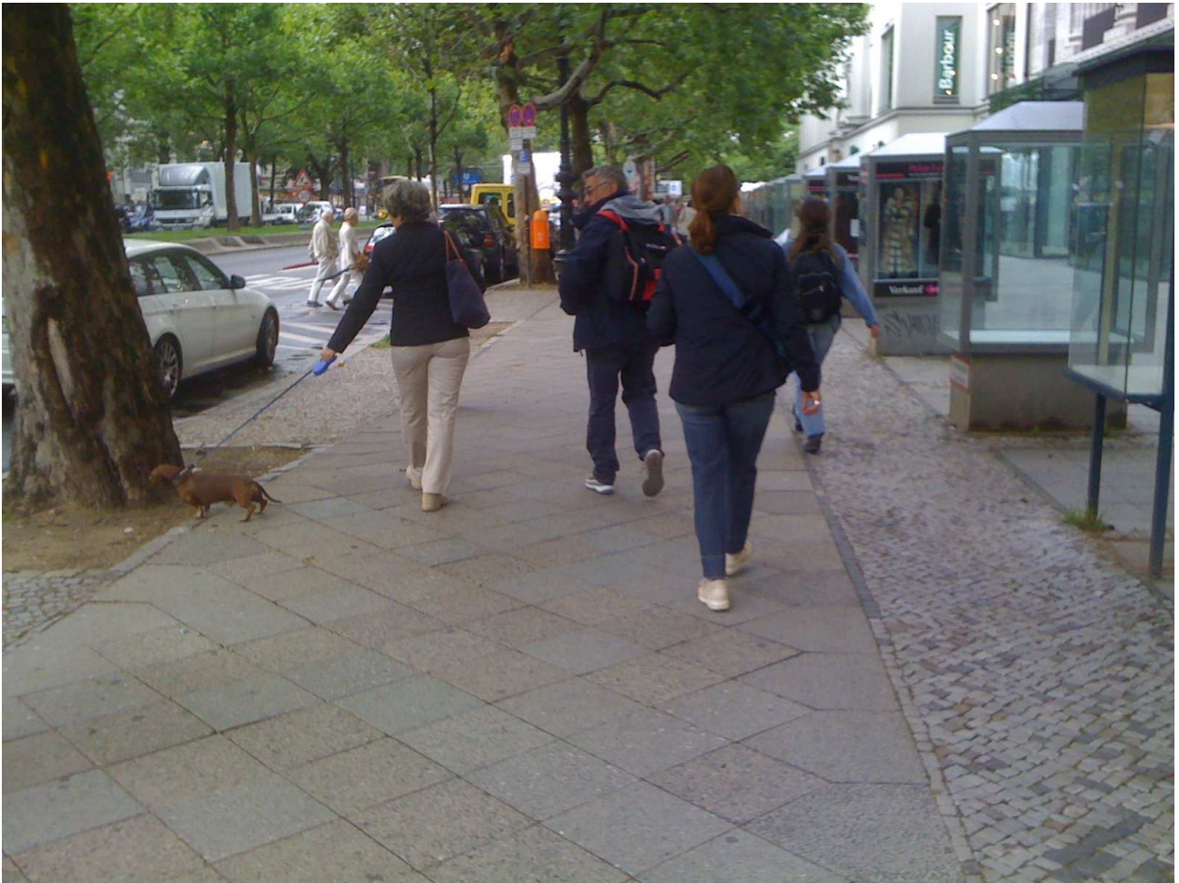
18/08/10 Berlino in bus passeggiata in centro