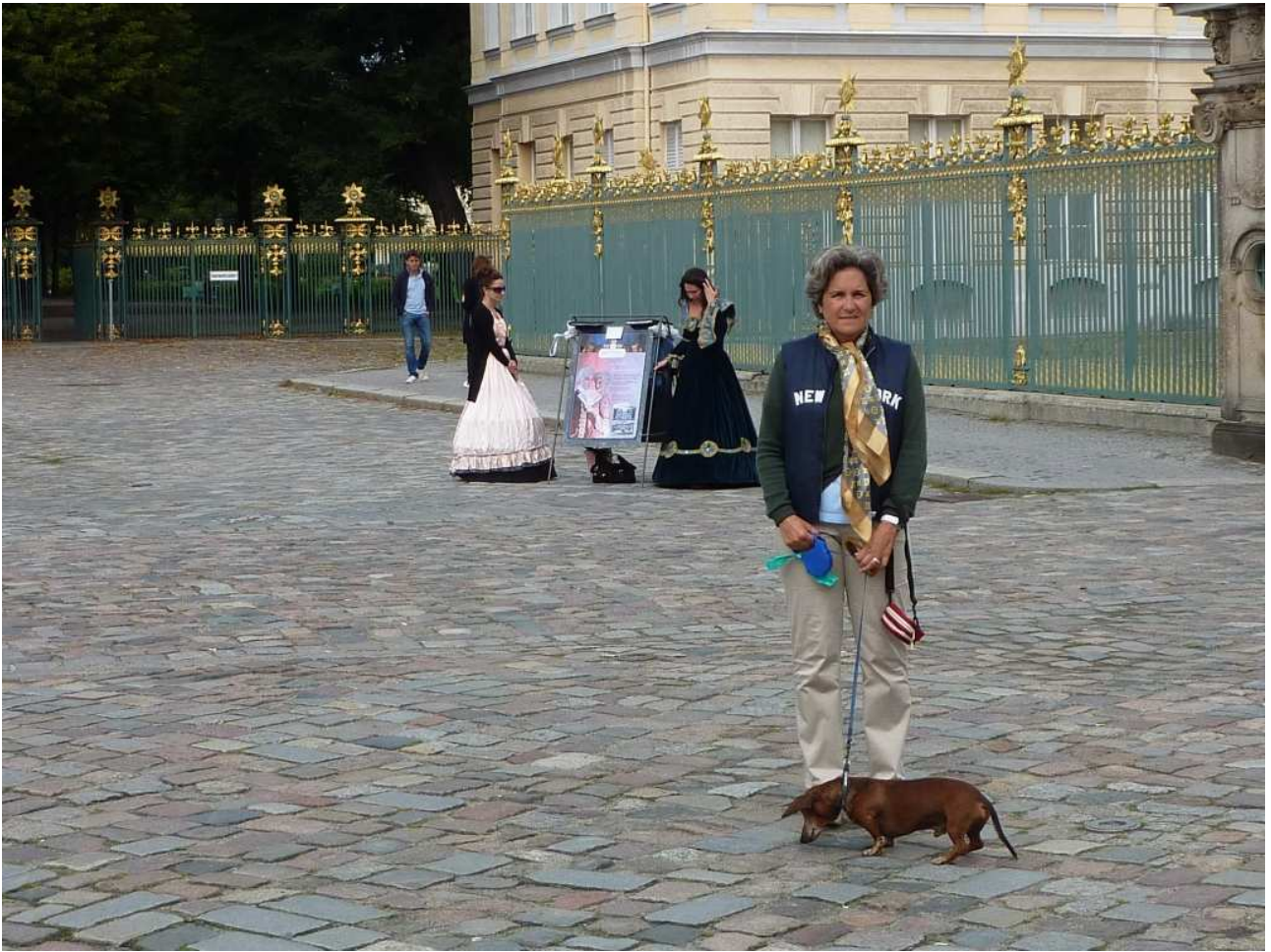
19/08/10 Berlino in bici. Davanti al castello di Charlottenburg