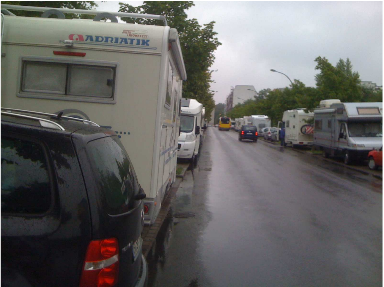
17/08/10 Danimarca Parcheggio di fortuna in un viale della capitale tedesca