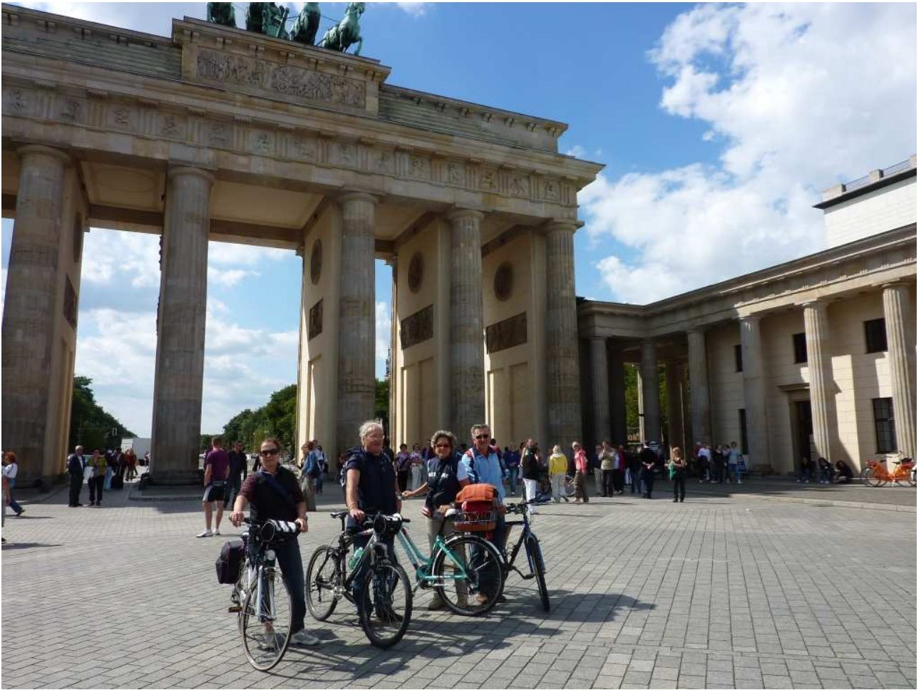
19/08/10 Berlino in bici. Foto ricordo davanti alla Porta di Brandeburgo