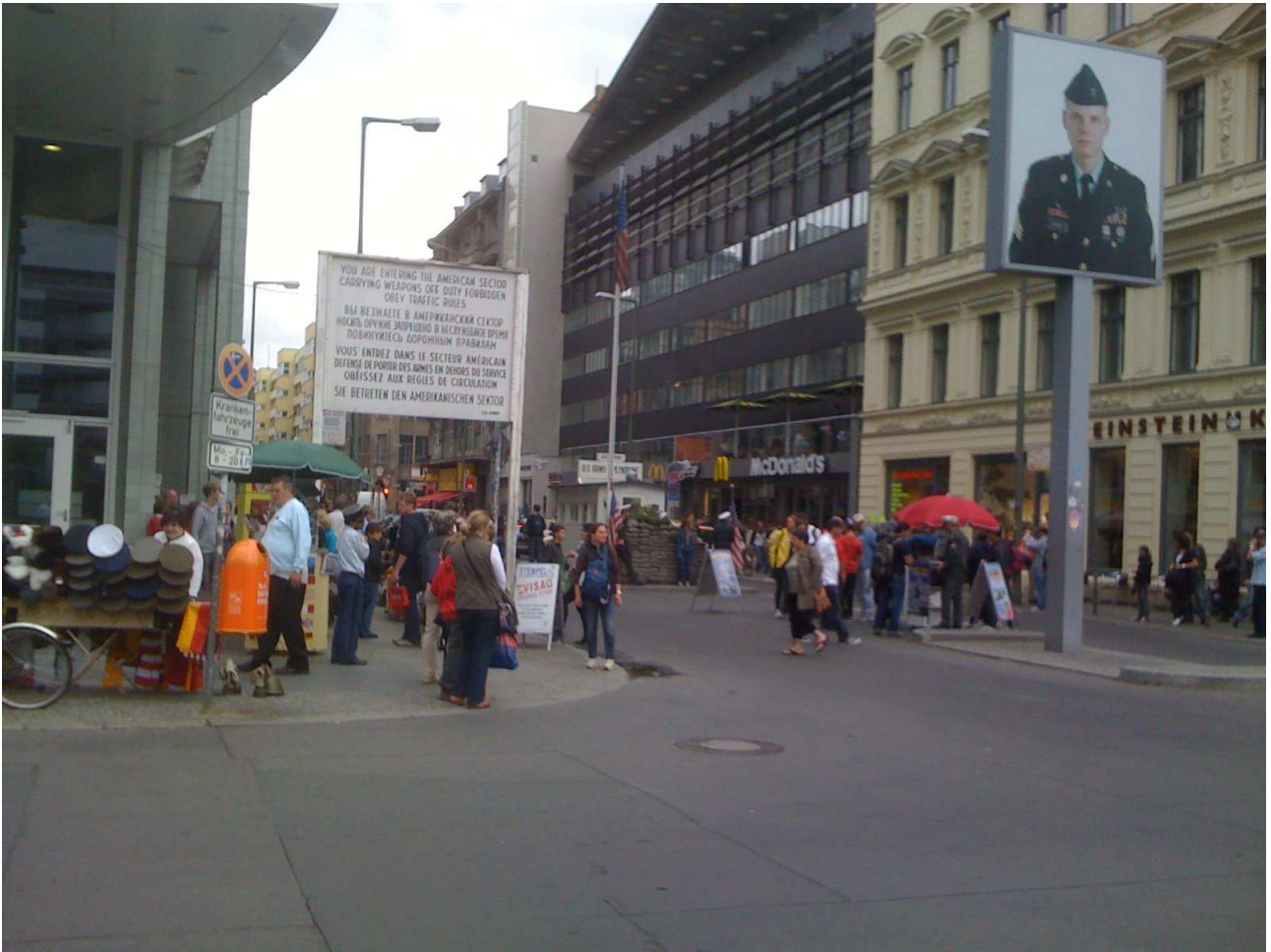
18/08/10 Berlino in bus il famosissimo Check-Point Charly