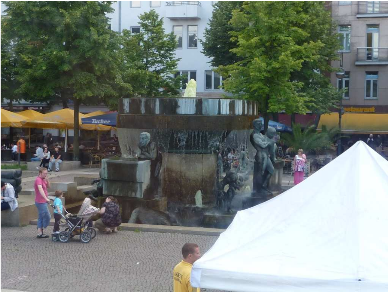
18/08/10 Berlino in bus. Fontana con la rappresentazione delle varie fasi della vita.