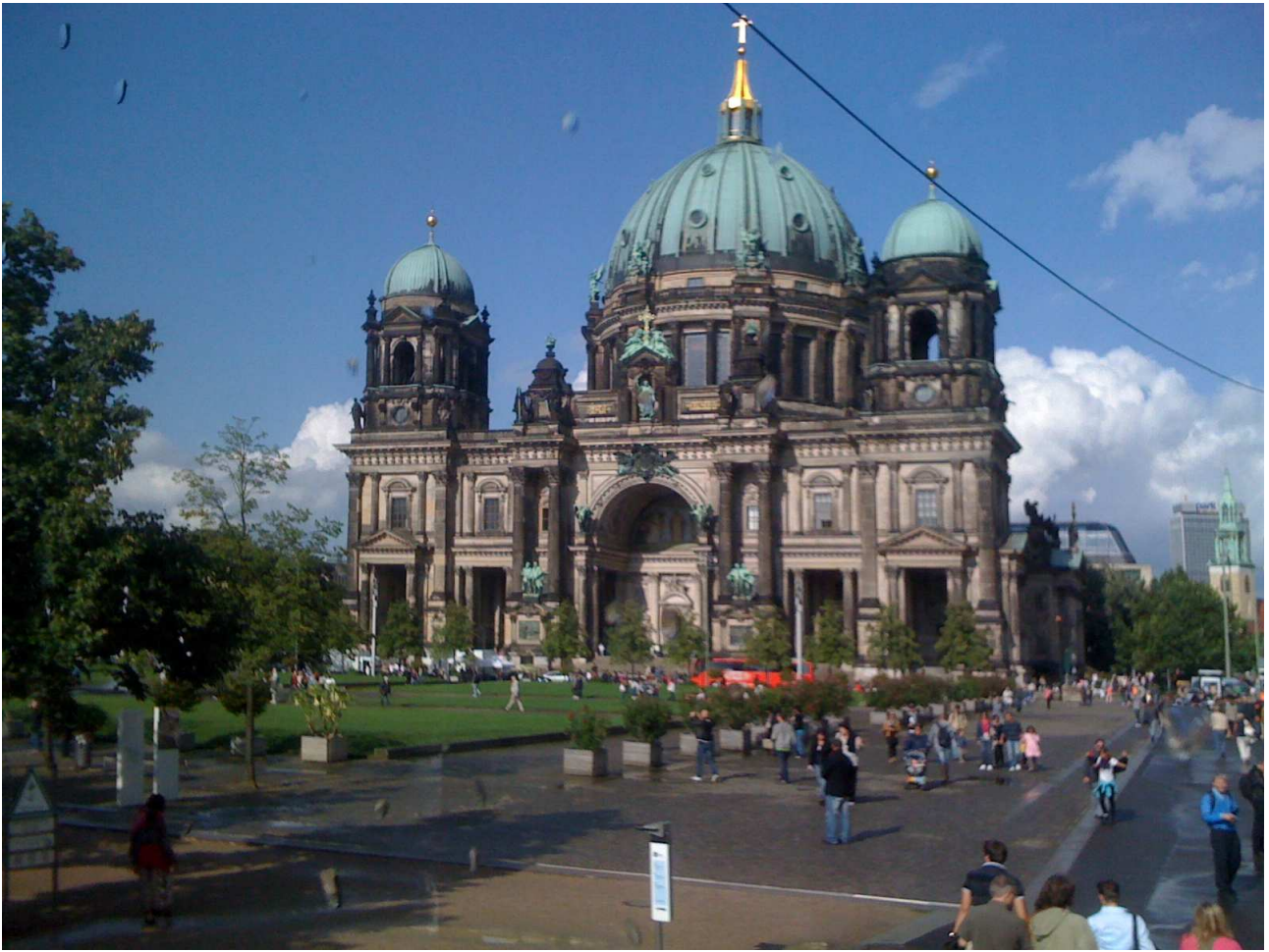
19/08/10 Berlino in bici. Il Duomo