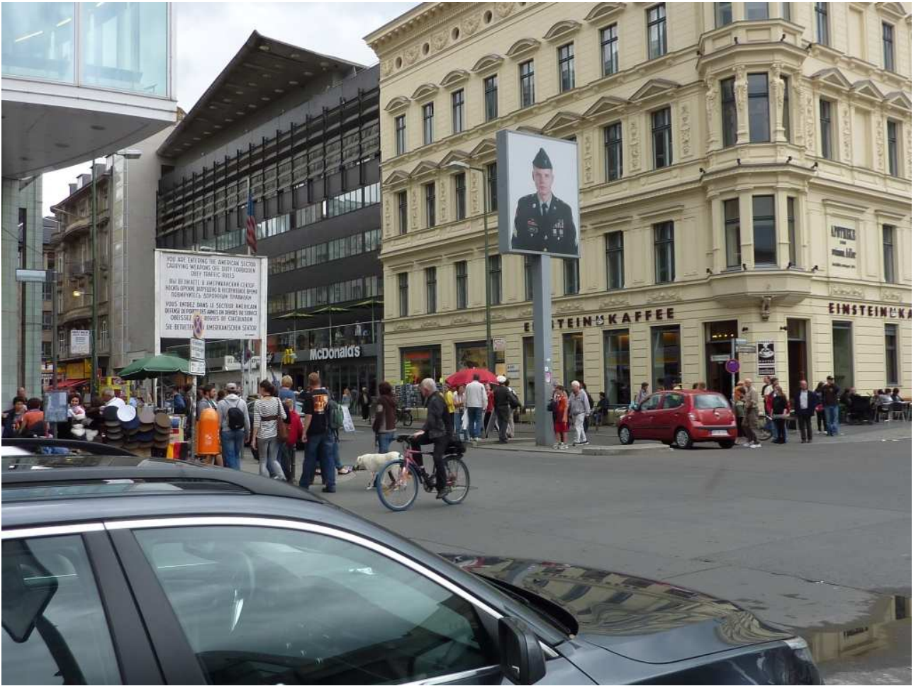
18/08/10 Berlino in bus il famosissimo Check-Point Charly