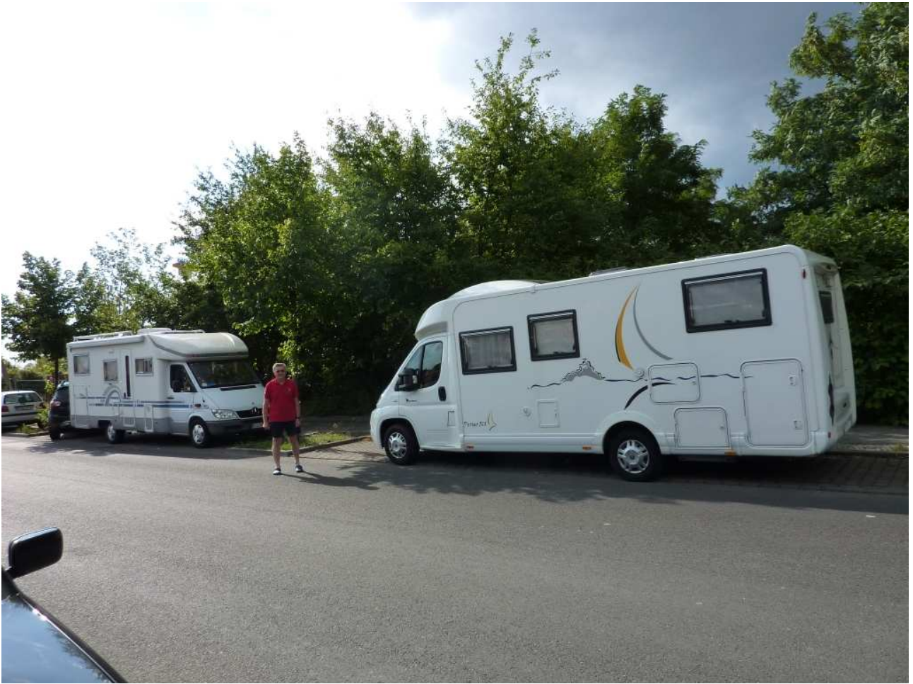
19/08/10 Berlino in bici Ultima foto a Berlino