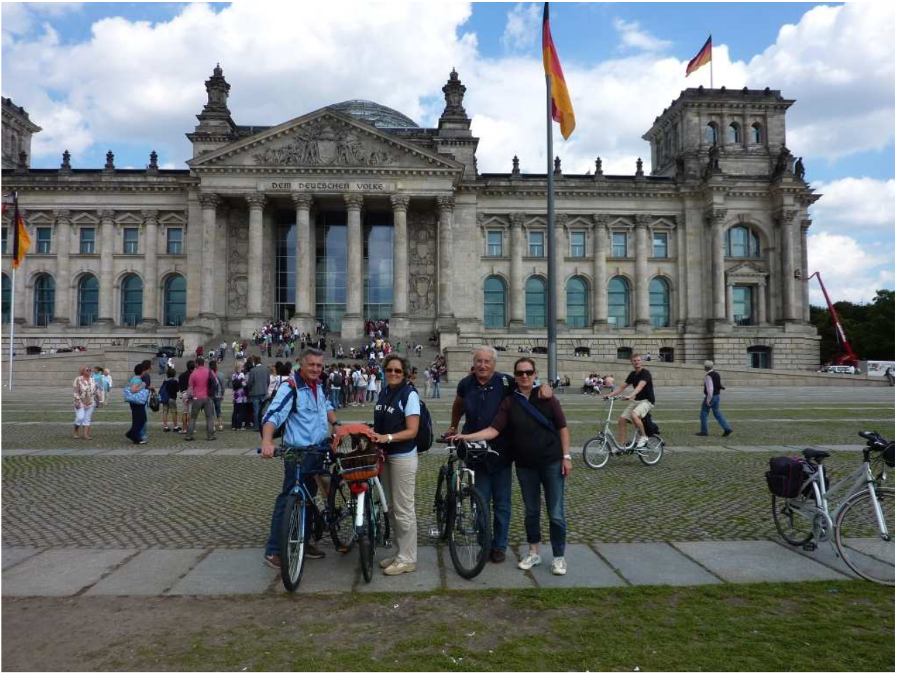
19/08/10 Berlino in bici foto ricordo davanti al Reichstag