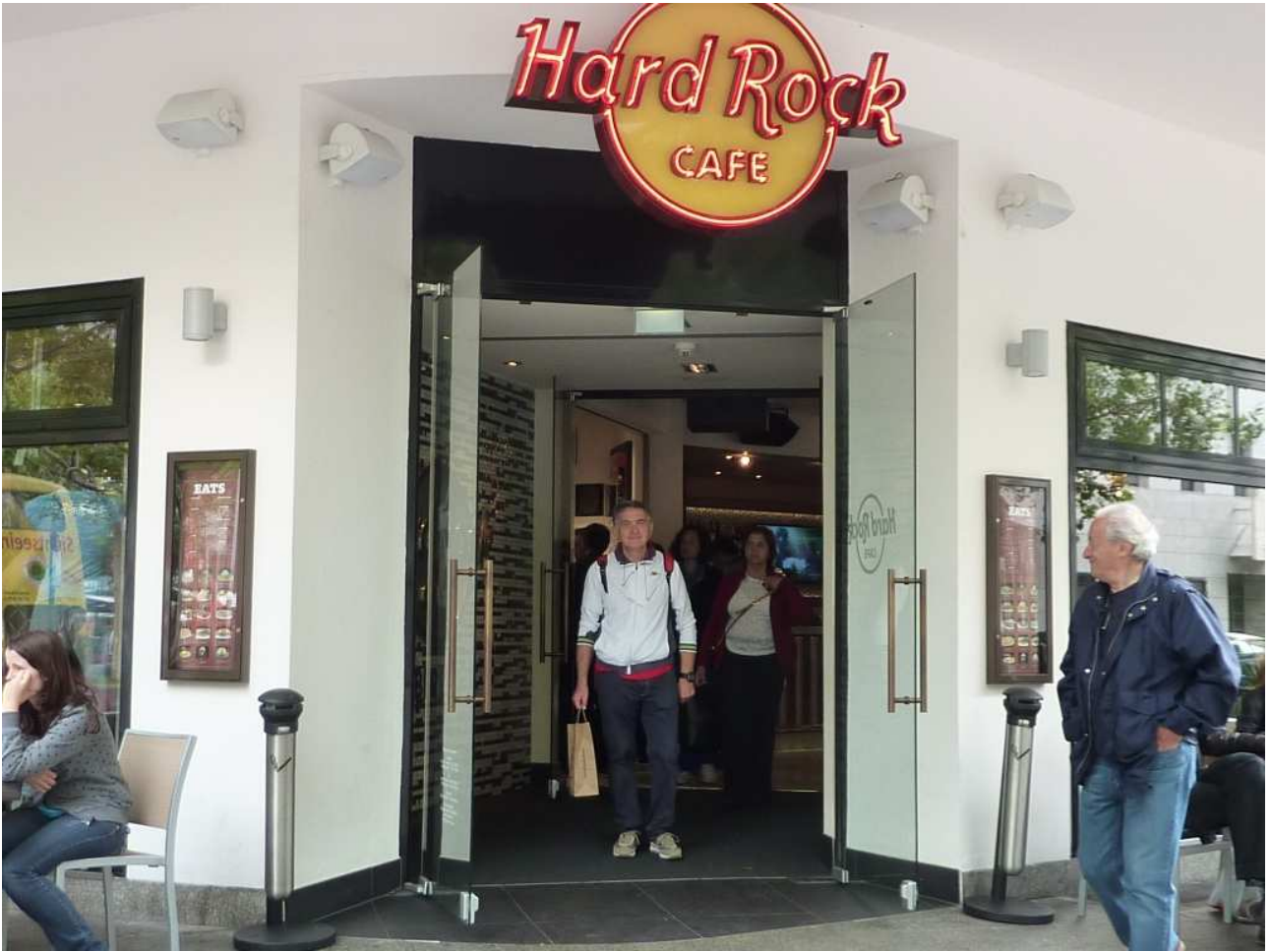
18/08/10 Berlino in bus Uscita dal negozio dell'Hard rock caffè