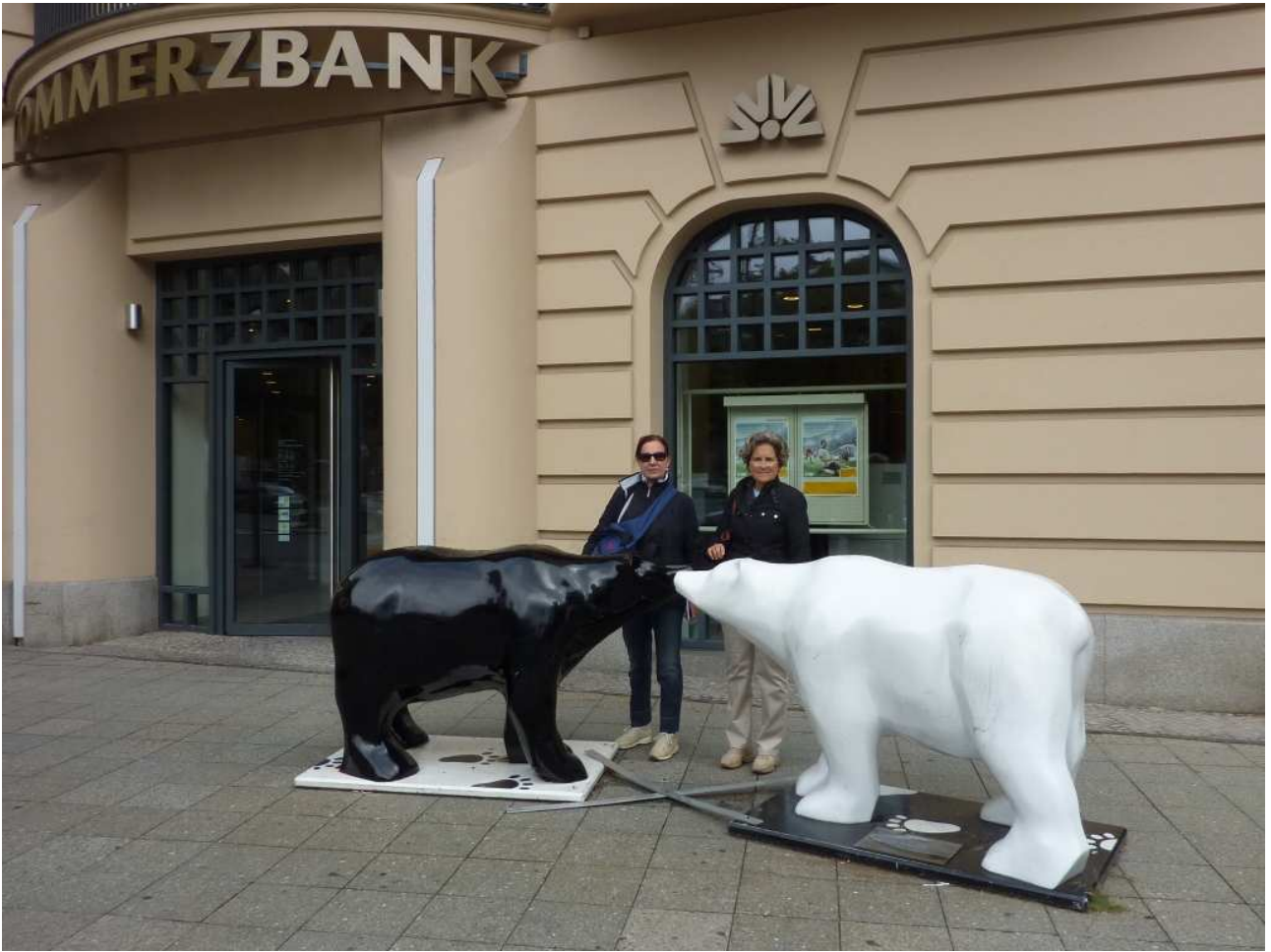
18/08/10 Berlino in bus le donne e gli orsi ..... che una volta tanto non siamo noi