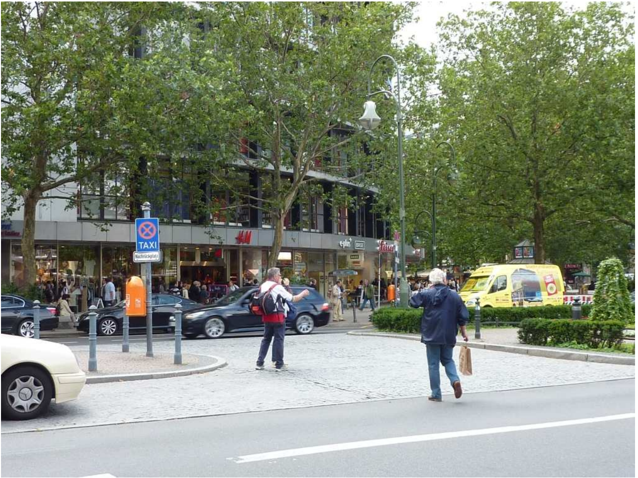
18/08/10 Berlino in bus passeggiata in centro