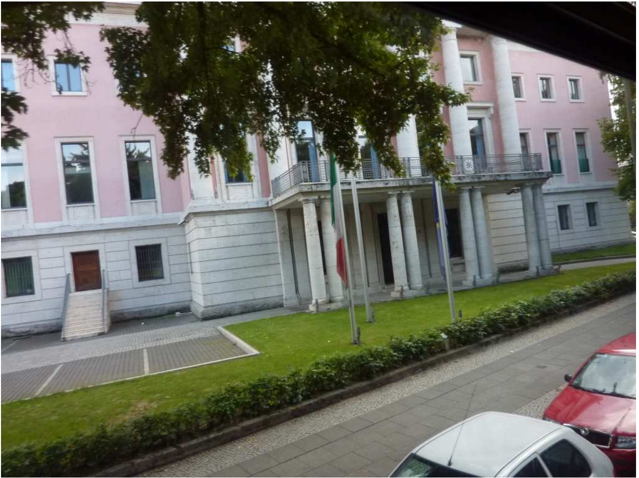
18/08/10 Berlino in bus Ambasciata italiana