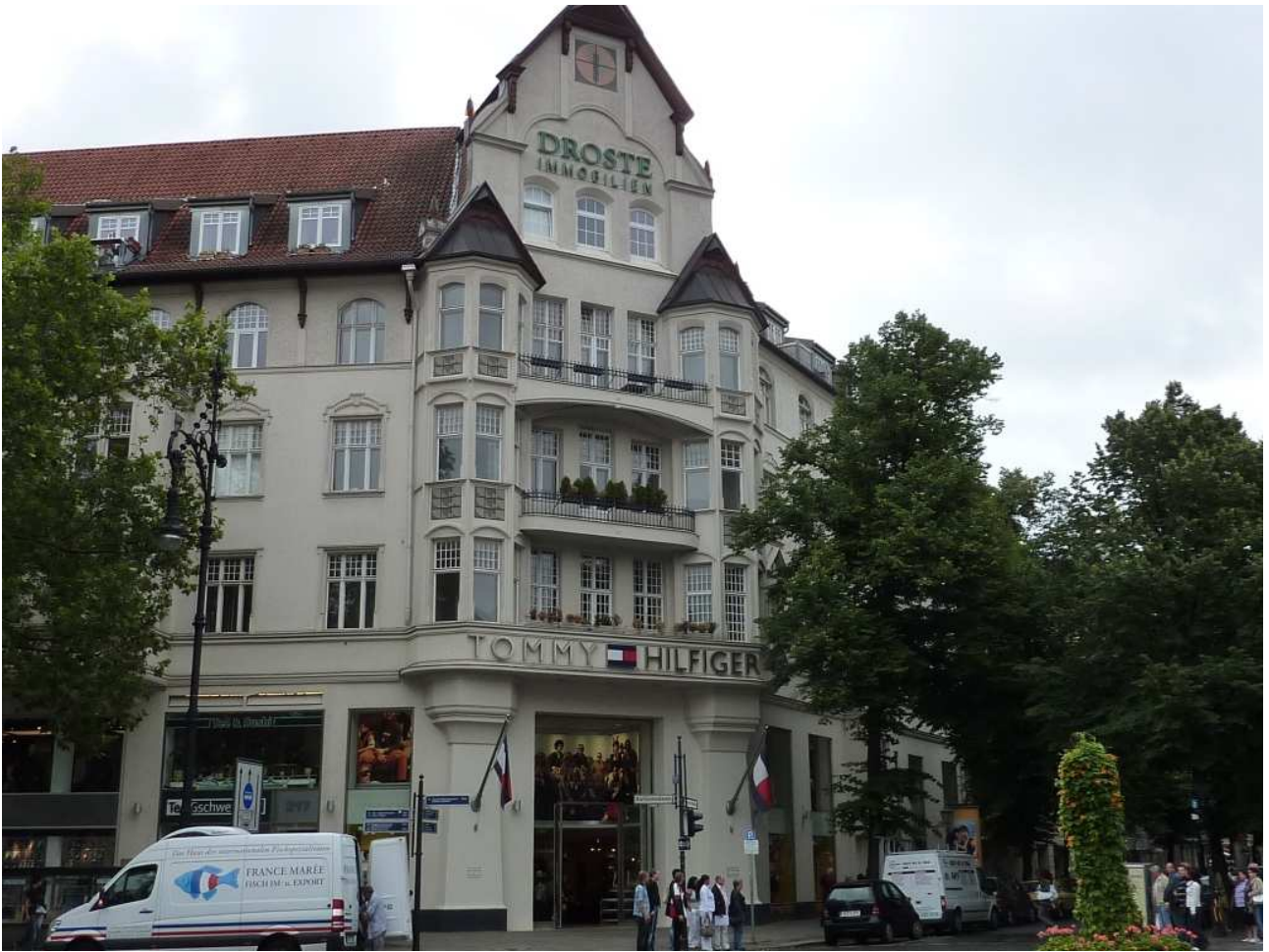
18/08/10 Berlino in bus un bel palazzo in una via del centro