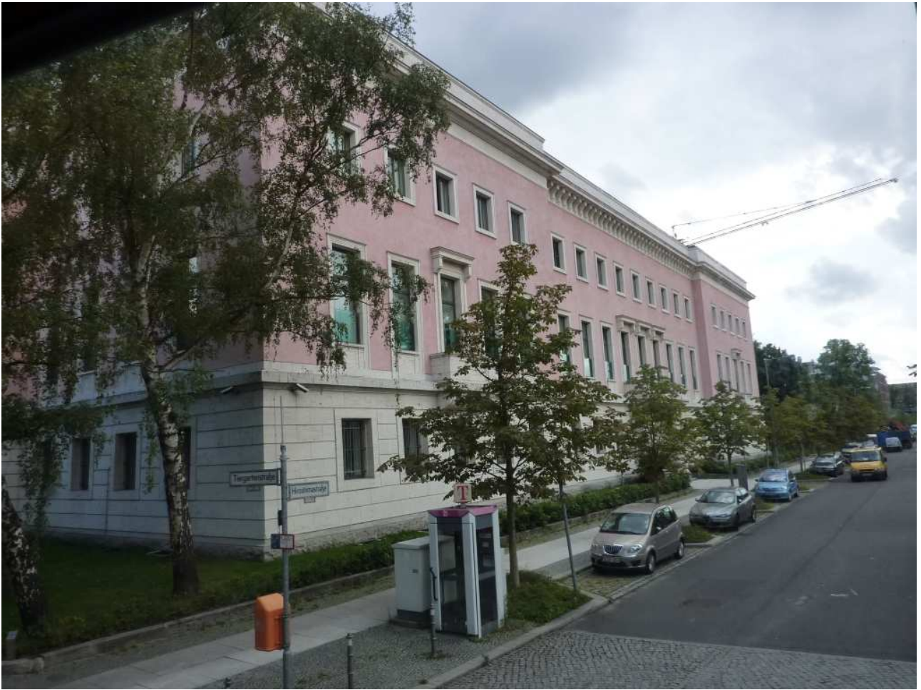
18/08/10 Berlino in bus Ambasciata italiana