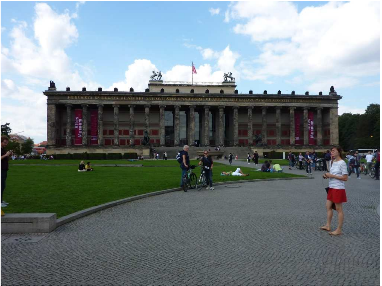
19/08/10 Berlino in bici. L'Altes Museum