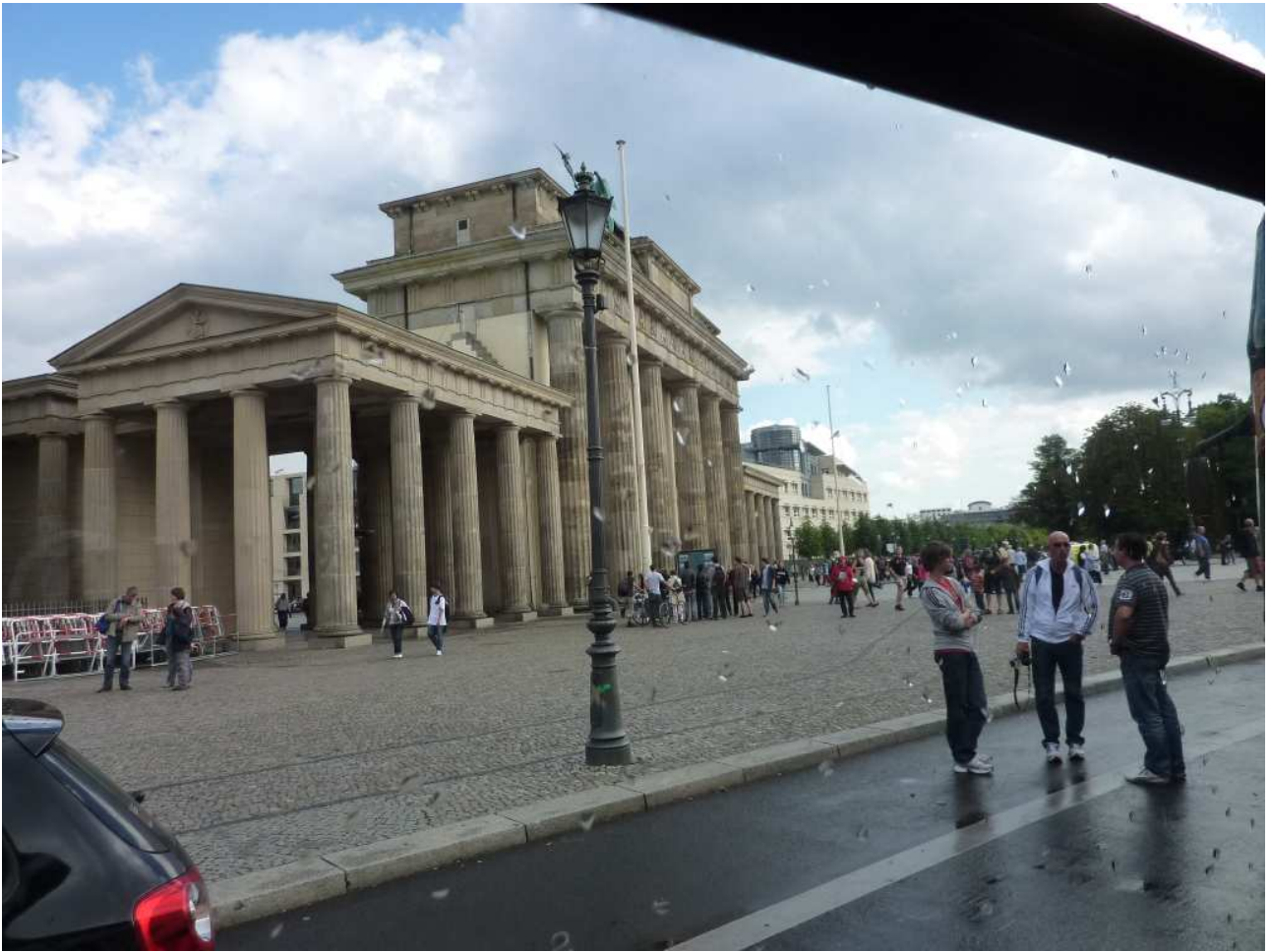
18/08/10 Berlino in bus la Porta di Brandeburgo