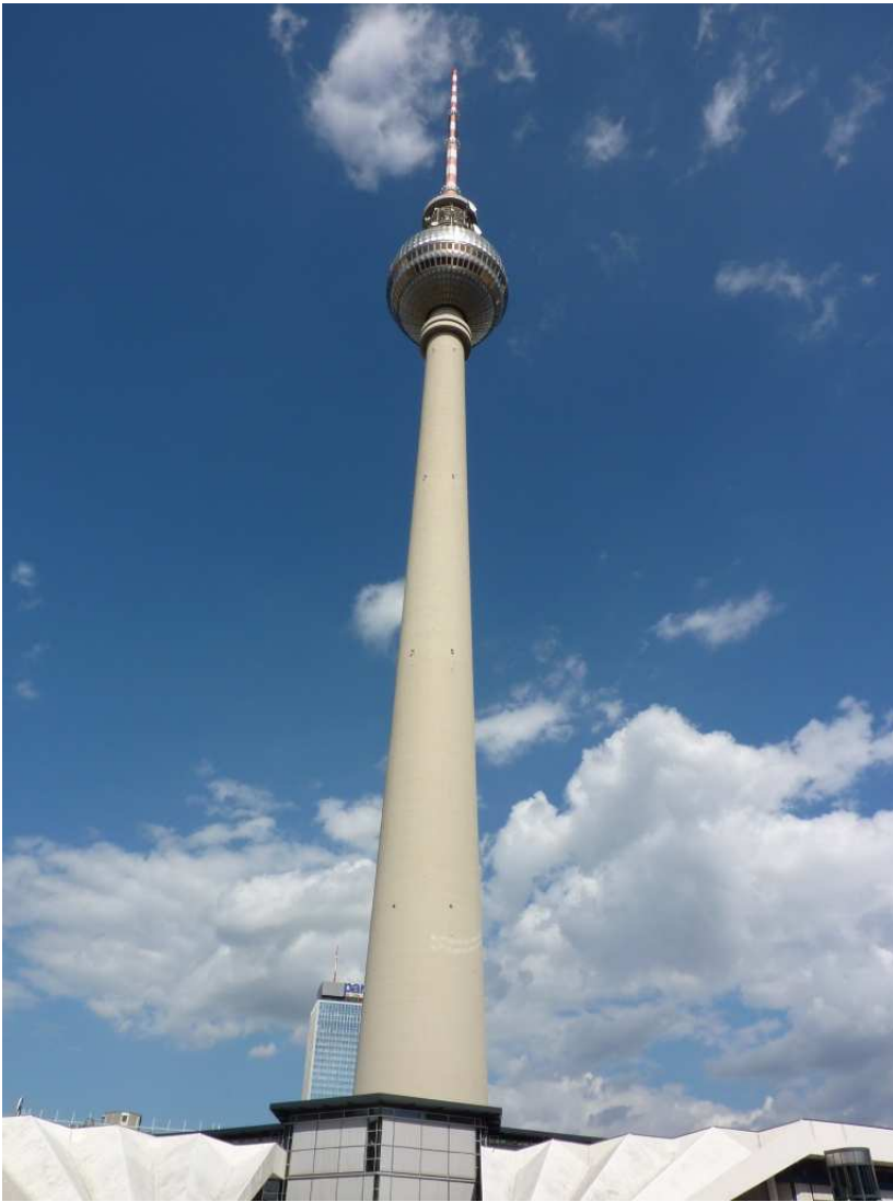
19/08/10 Berlino in bici Sotto la torre della televisione