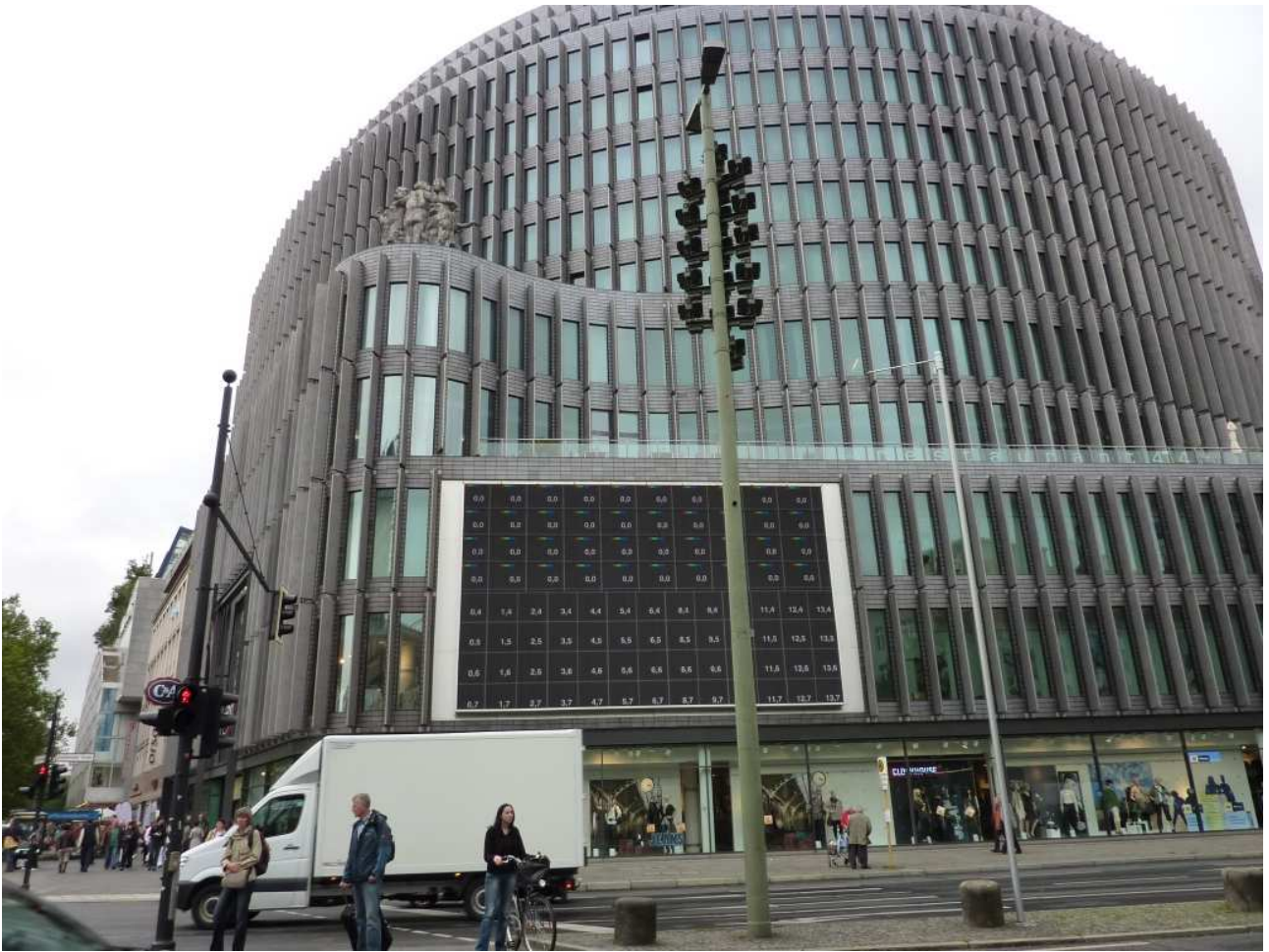
18/08/10 Berlino in bus il palazzo della Borsa