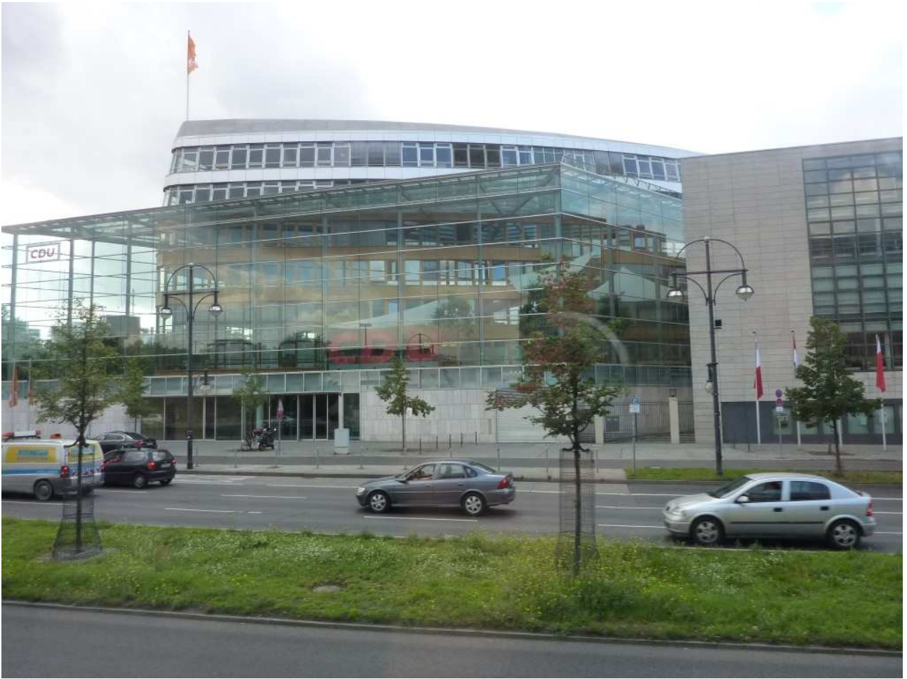
18/08/10 Berlino in bus Palazzo della CDU