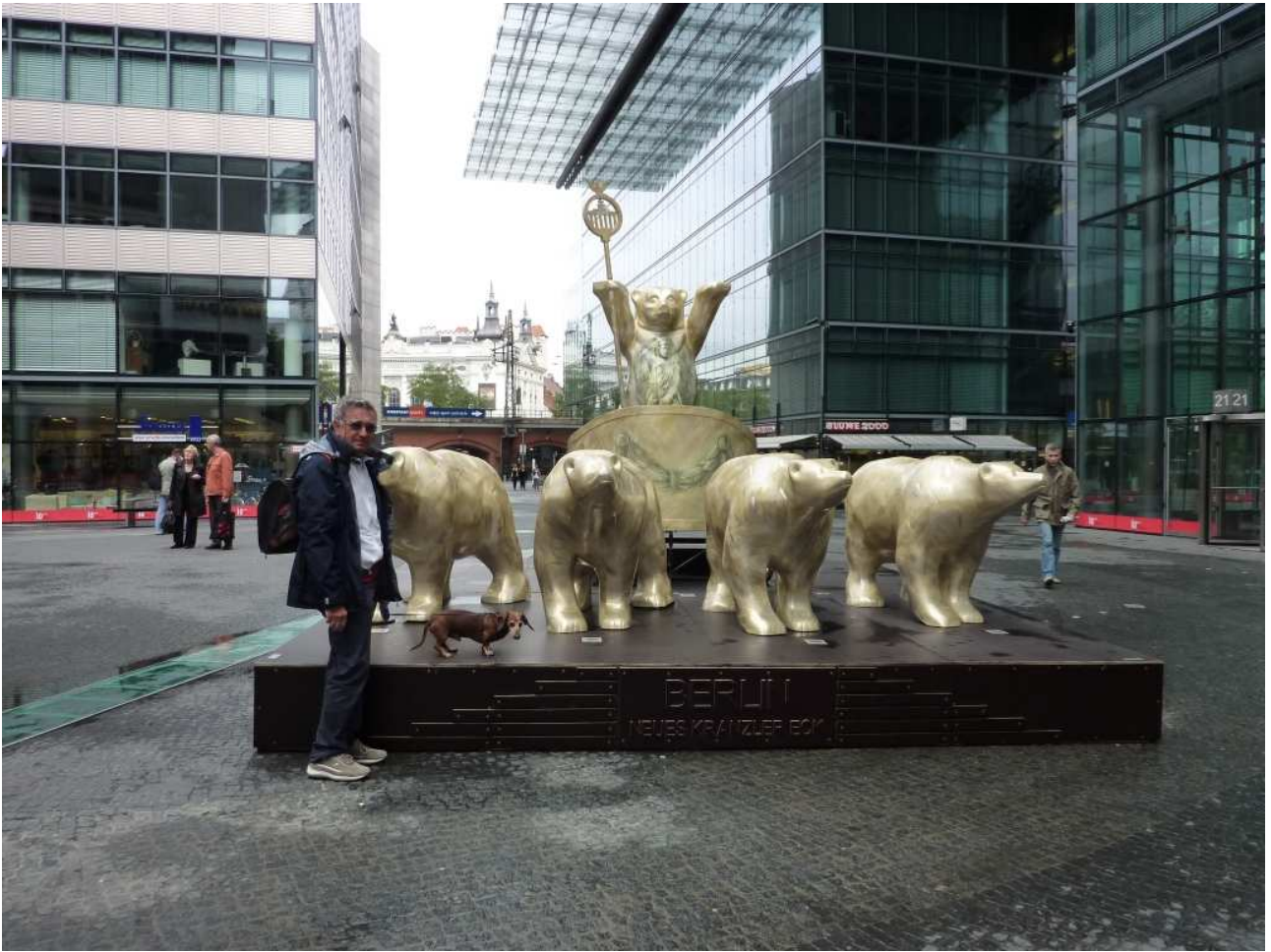
18/08/10 Berlino in bus gli Orsi uno dei simboli di Berlino