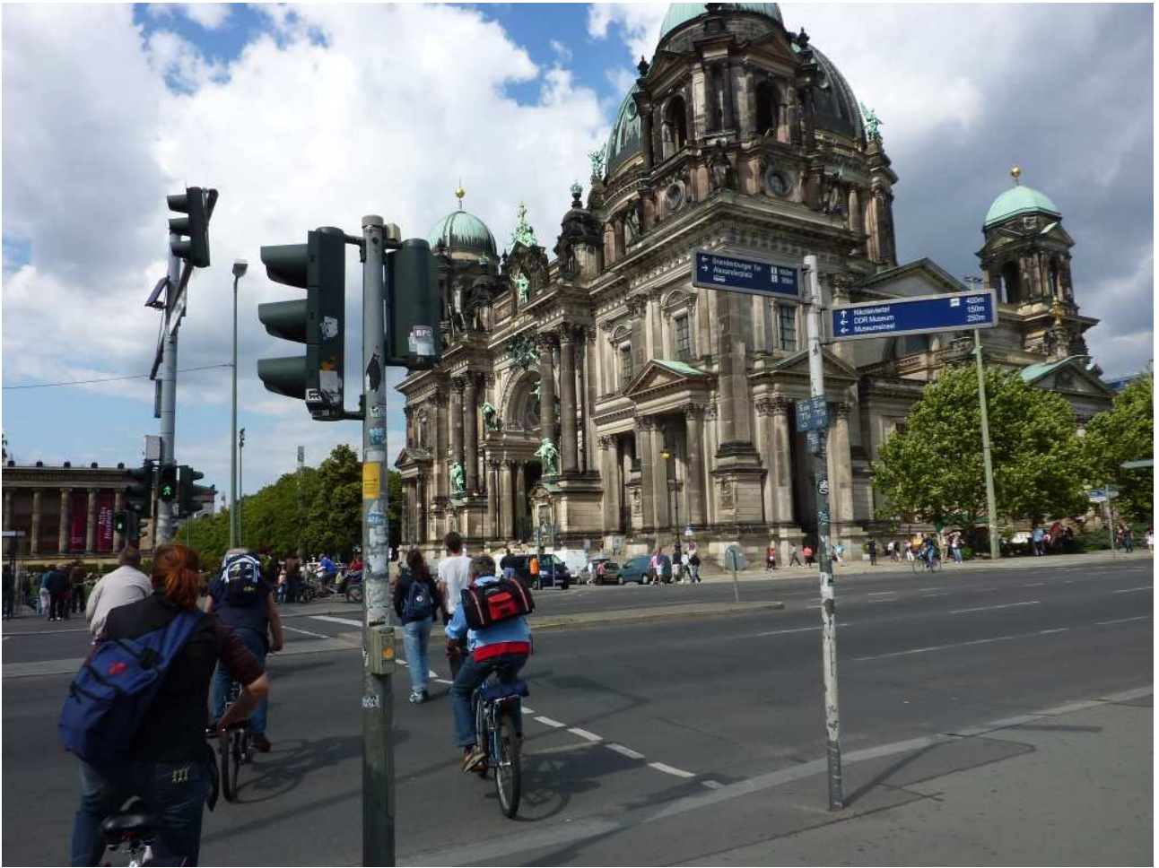
19/08/10 Berlino in bici. Il Duomo