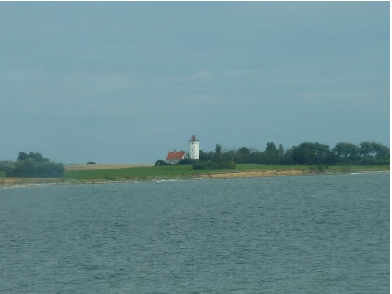
17/08/10 Danimarca Ultimo quadretto danese visto dalla nave che ci porta a Rostock