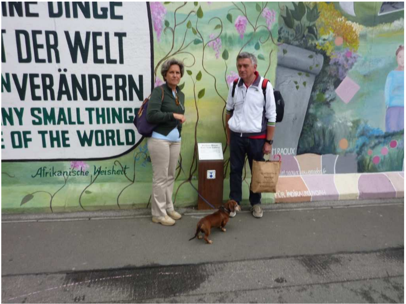
18/08/10 Berlino in bus foto ricordo davanti a ciò che resta del muro