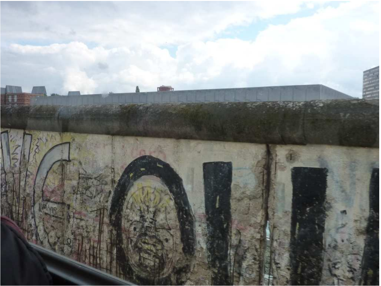
18/08/10 Berlino in bus un pezzo di ciò che rimane del Muro.