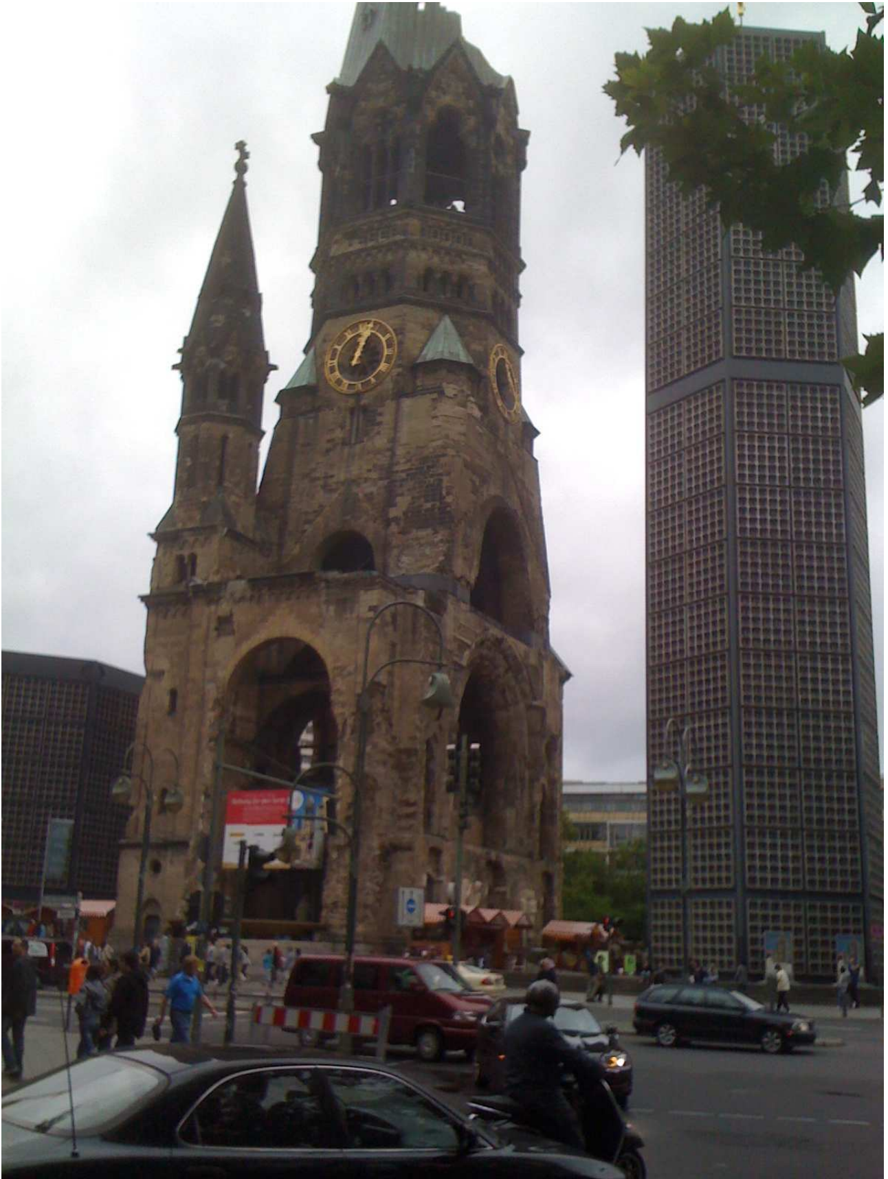
18/08/10 Berlino in bus la Chiesa della Memoria