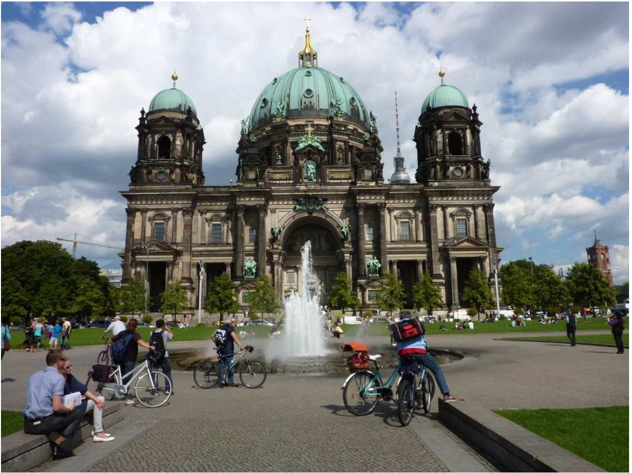
19/08/10 Berlino in bici. Noi, le bici e il Duomo