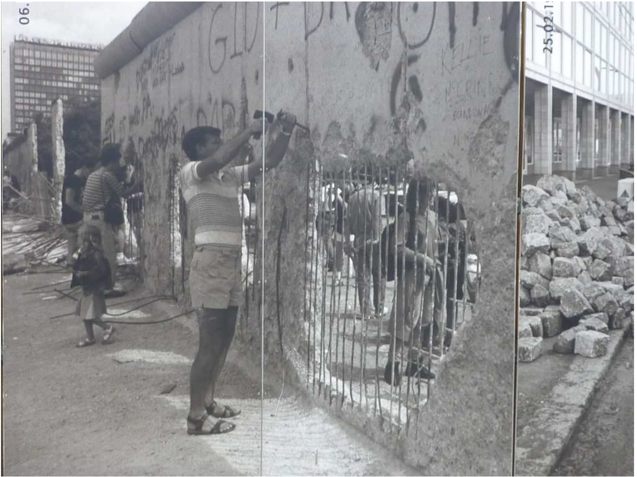
18/08/10 Berlino in bus Una foto che documenta i giorni della caduta del Muro (1989)