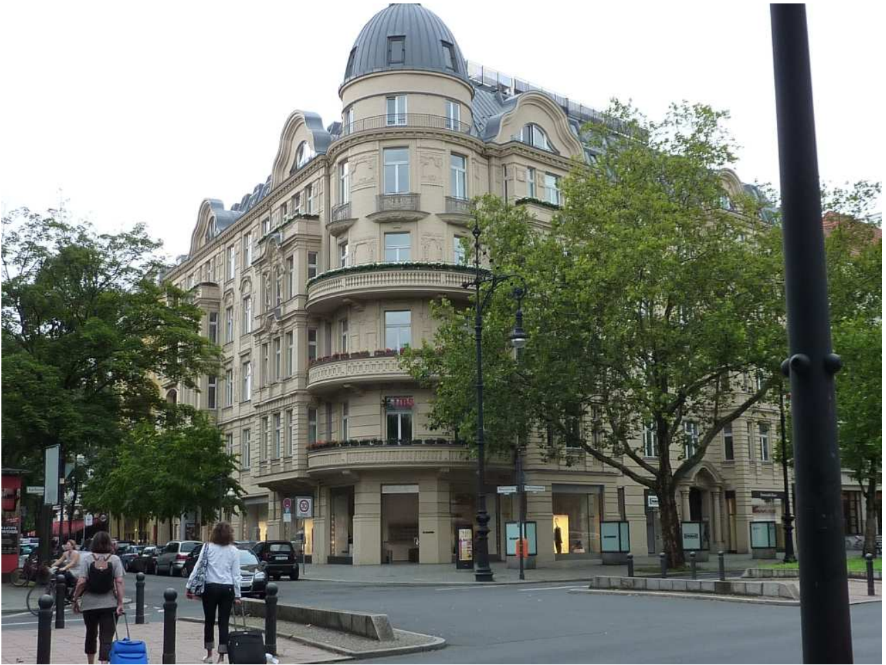
18/08/10 Berlino in bus i bei palazzi non si contano a Berlino