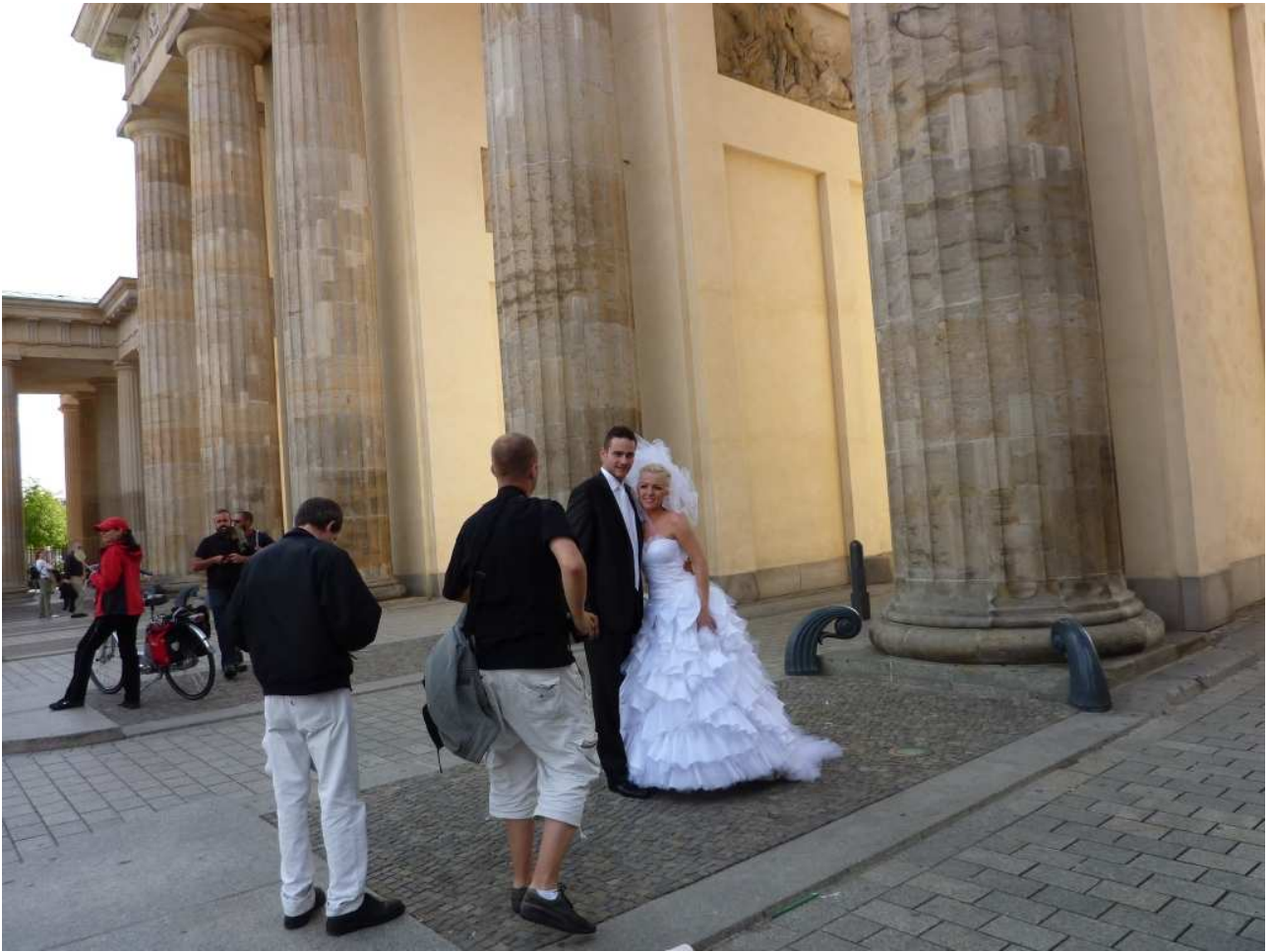
19/08/10 Berlino in bici Una coppia di sposi posa sotto la Porta di Brandeburgo