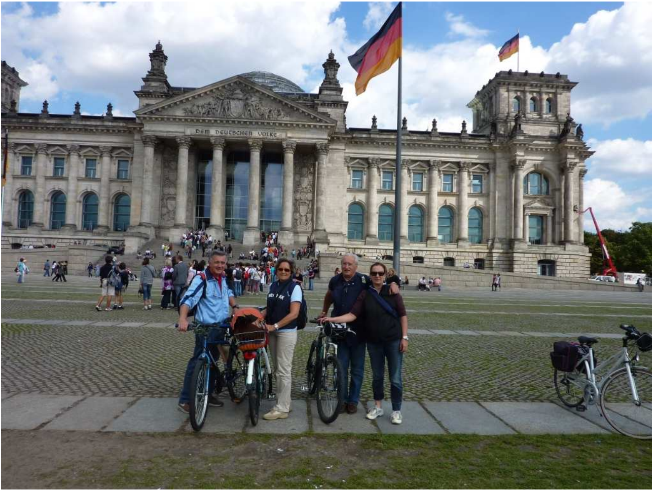
19/08/10 Berlino in bici foto ricordo davanti al Reichstag (il parlamento tedesco)