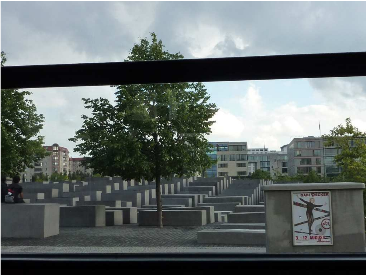
18/08/10 Berlino in bus Monumento all'olocausto