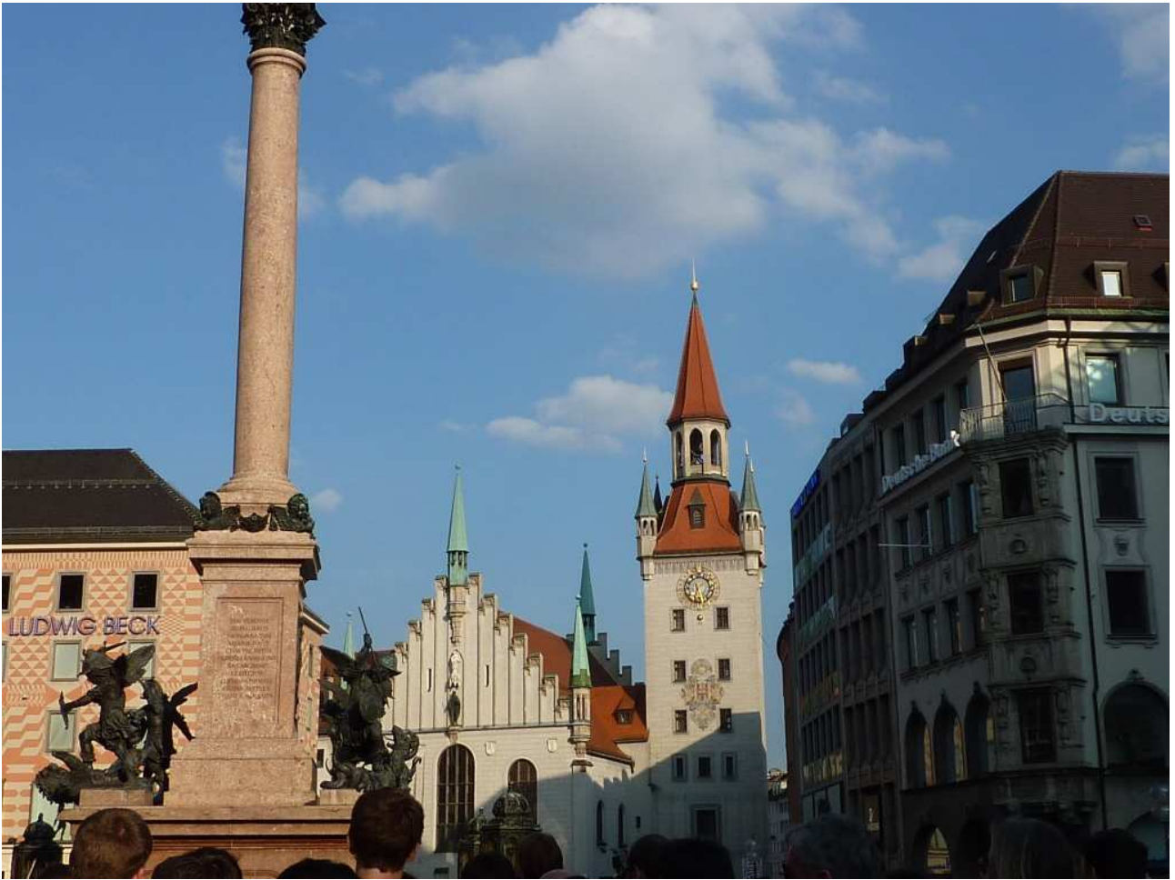
20/08/10 Monaco di Baviera una delle Chiese di Monaco vista da piazza del Municipio