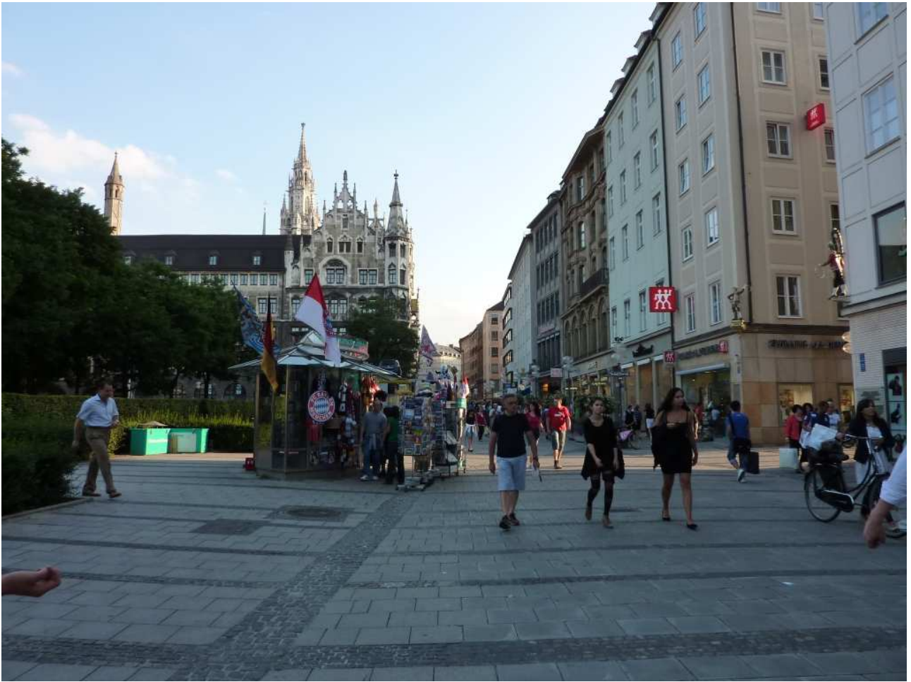
20/08/10 Monaco di Baviera a zonzo per le vie del centro