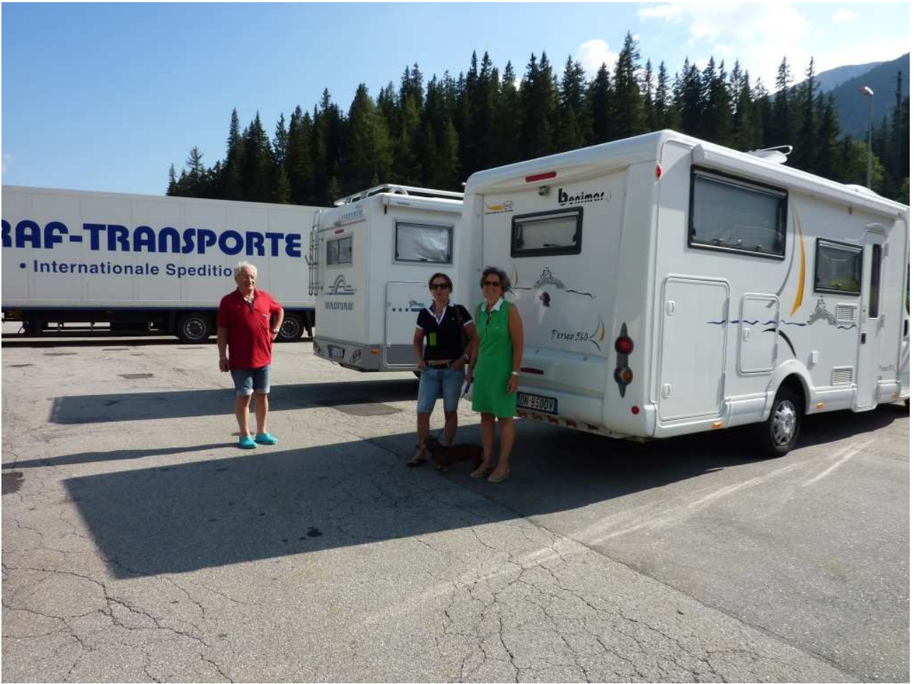
21/08/10 Passo del San Bernardino altra foto ricordo