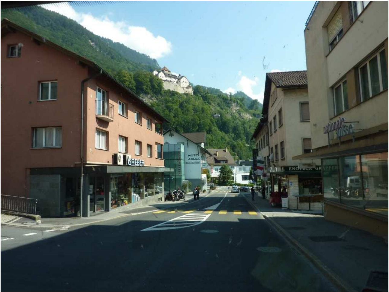
21/08/10 Vaduz una strada di accesso alla città con vista sul castello in alto