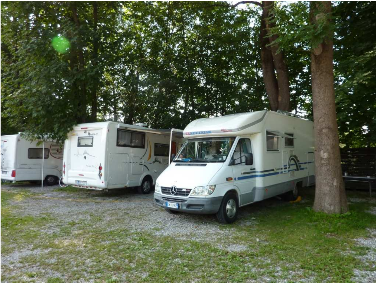
20/08/10 Monaco di Baviera sistemazione in campeggio