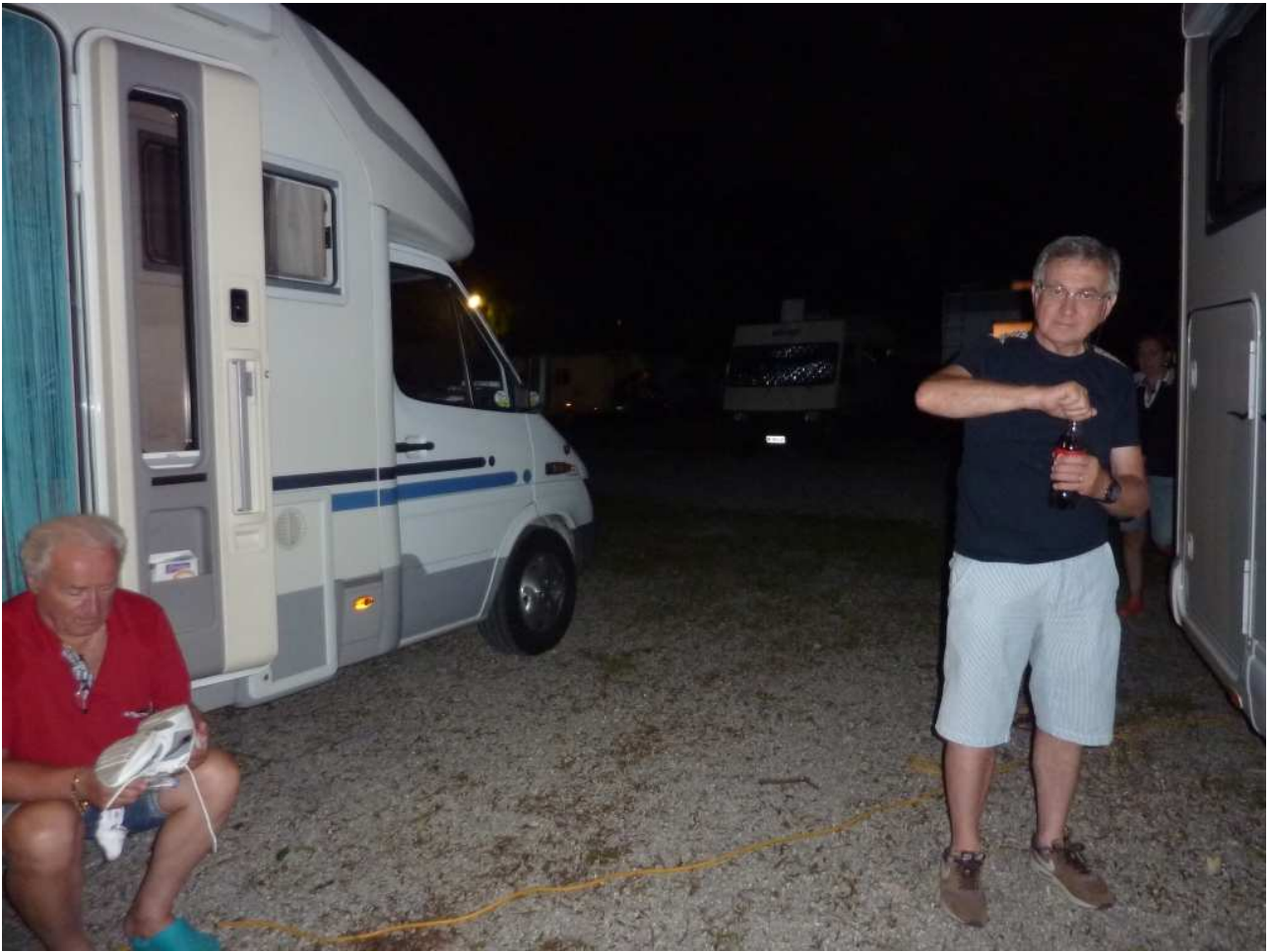
20/08/10 Monaco di Baviera in campeggio ..... rientrati stanchi ma soddisfatti dalla visita alla città