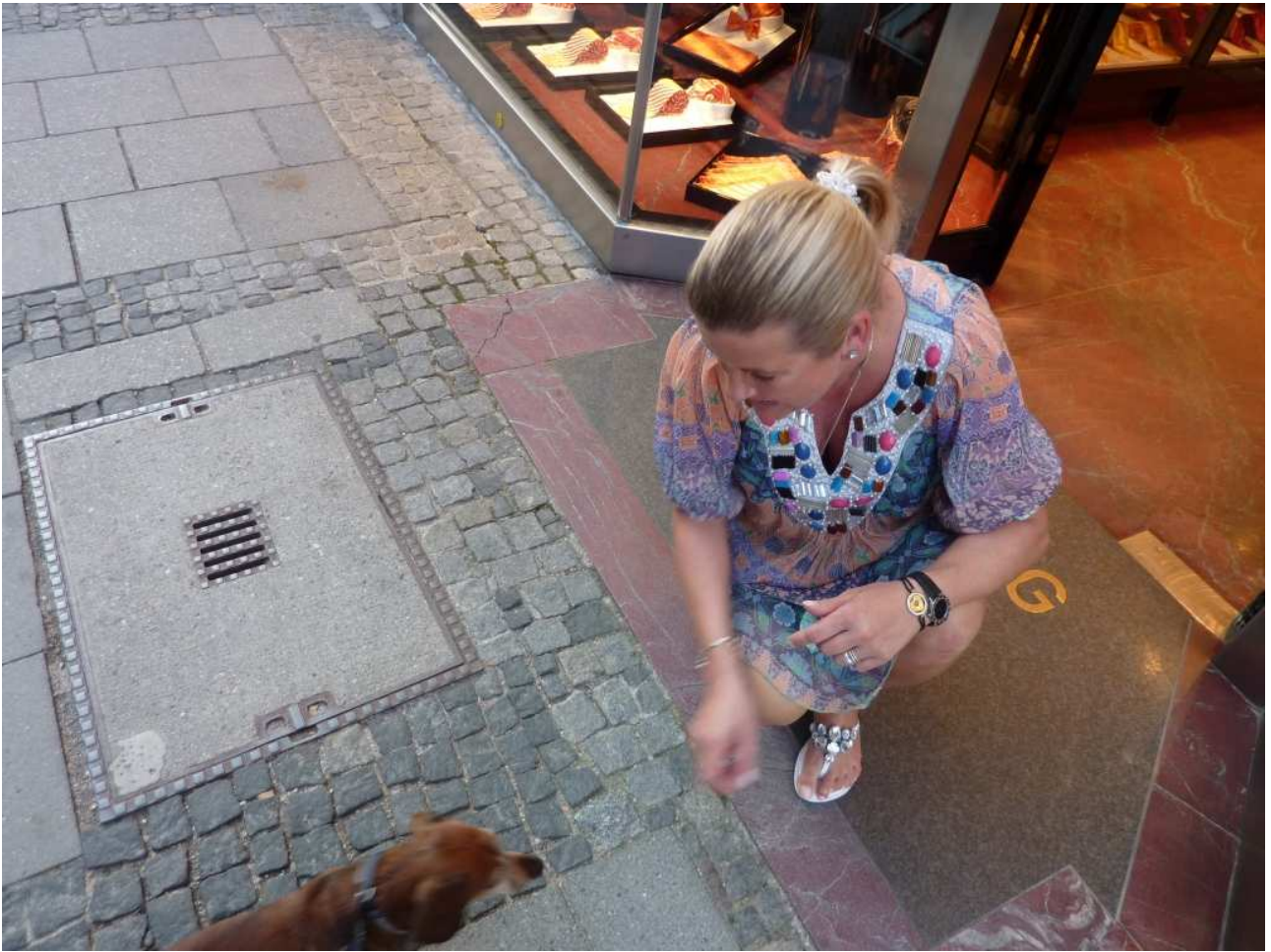
20/08/10 Monaco di Baviera una bella signora fa i complimenti al Teo