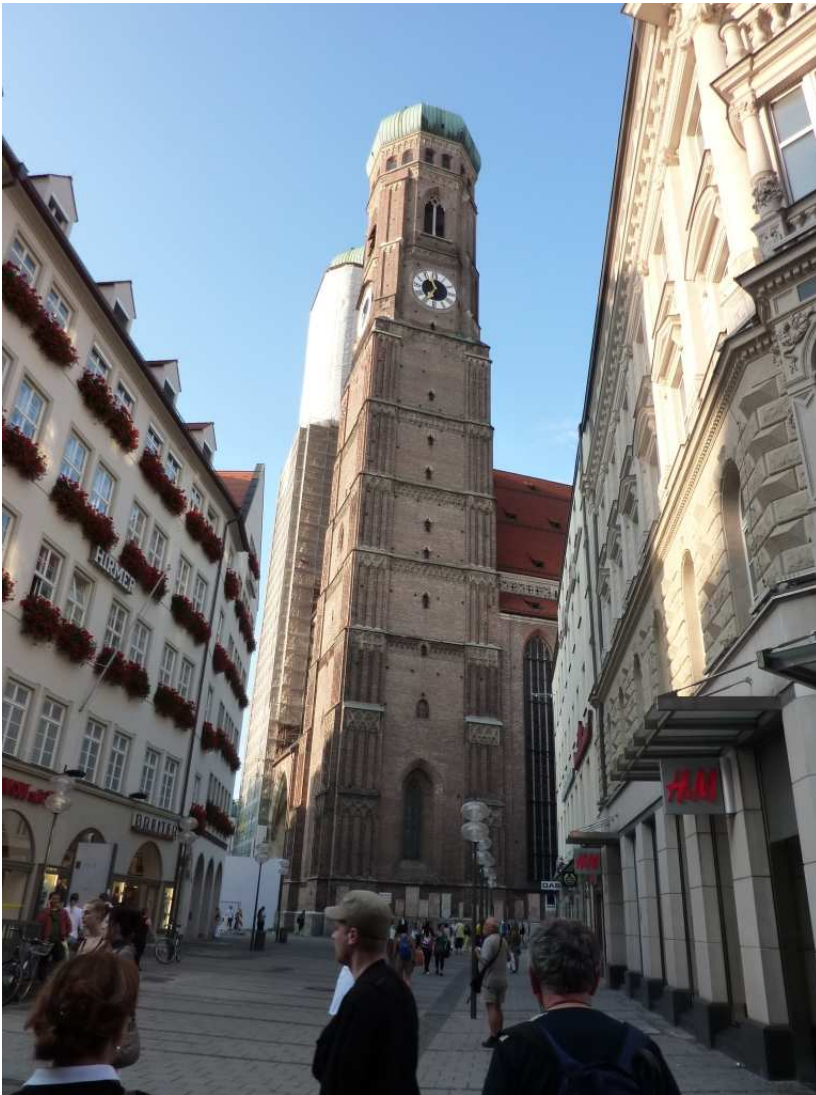
20/08/10 Monaco di Baviera il Duomo