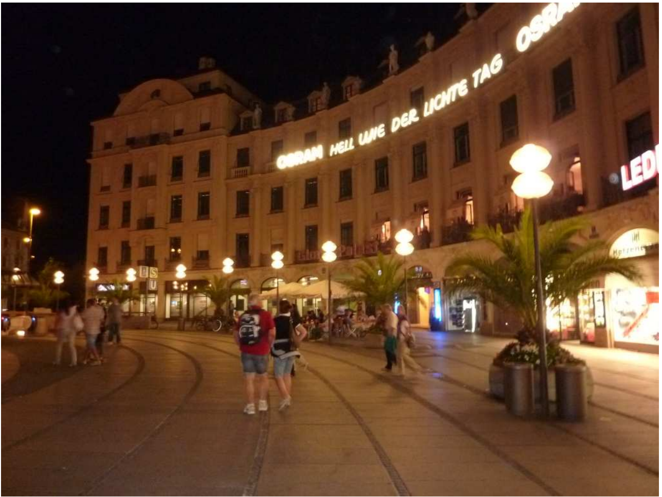
20/08/10 Monaco di Baviera ..... girovagando per la città notturna