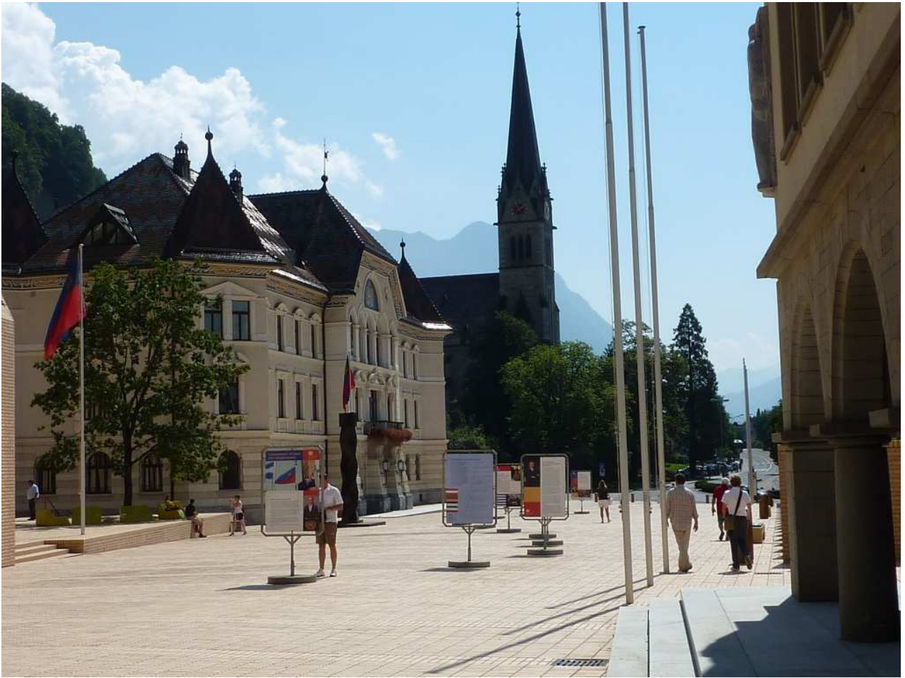
21/08/10 Vaduz il Municipio