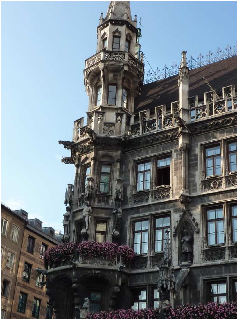
20/08/10 Monaco di Baviera un particolare del Municipio