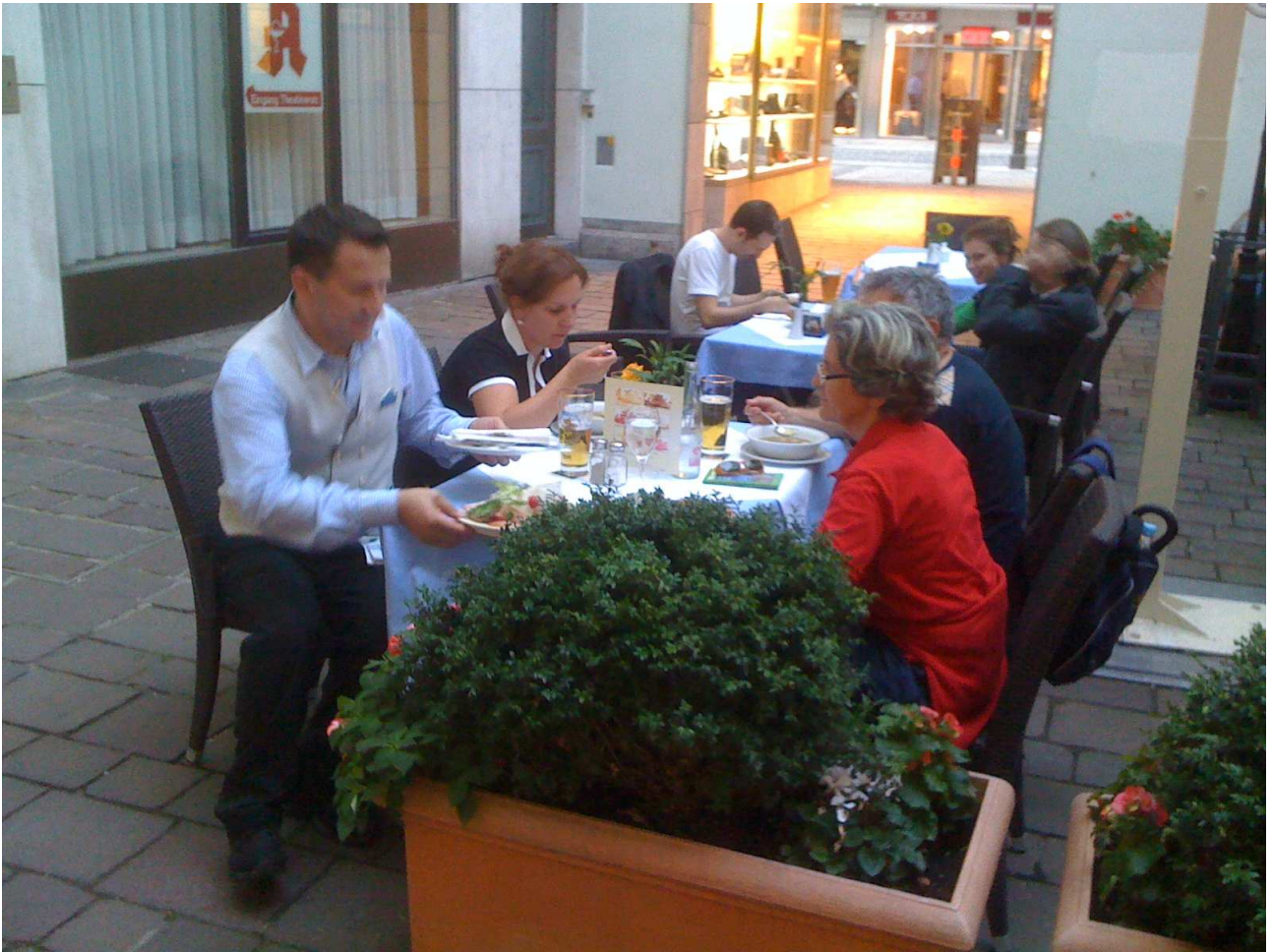
20/08/10 Monaco di Baviera al ristorante ..... al mio posto c'è il cameriere