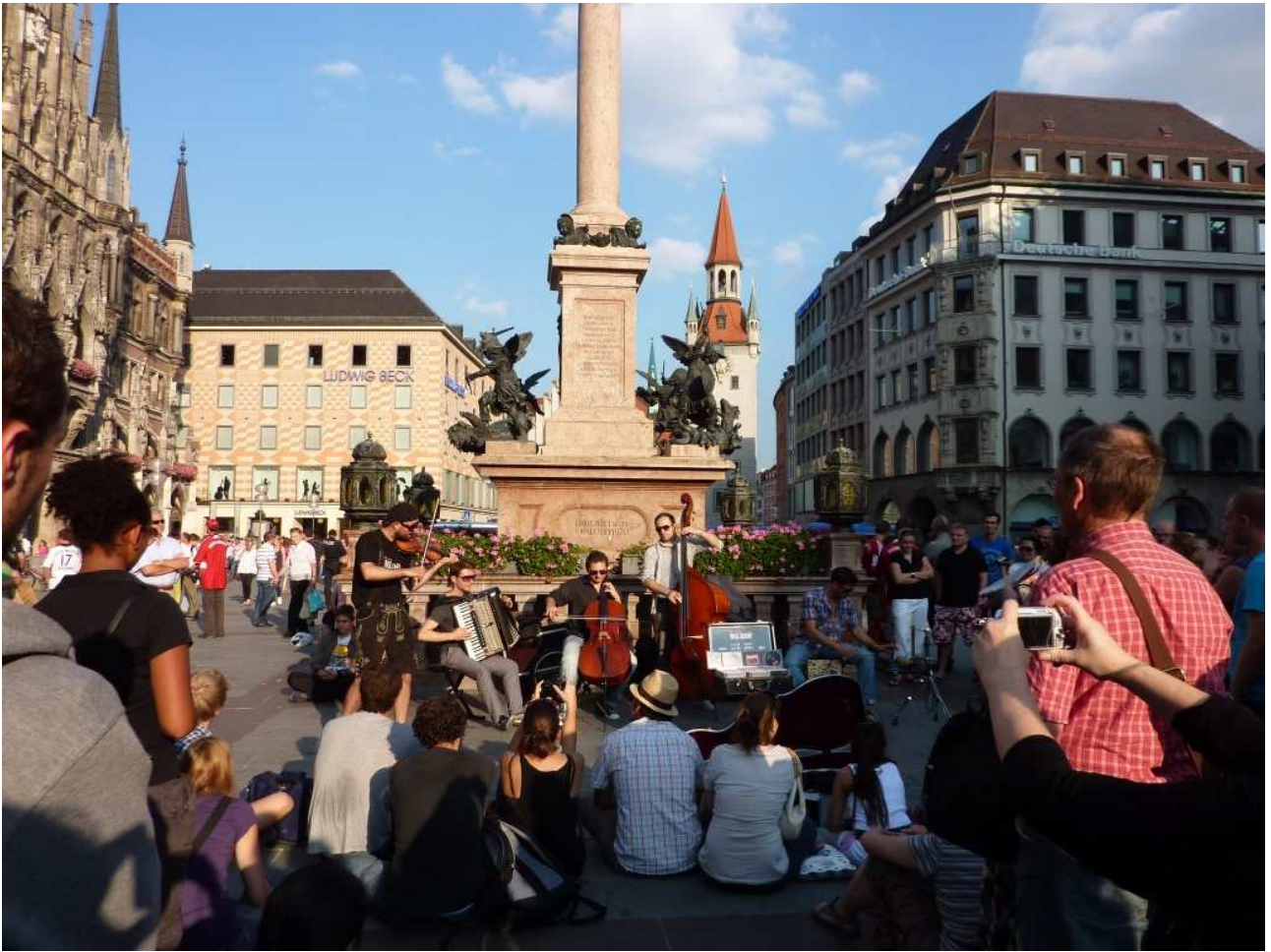
20/08/10 Monaco di Baviera suonatori di strada nella piazza del Municipio