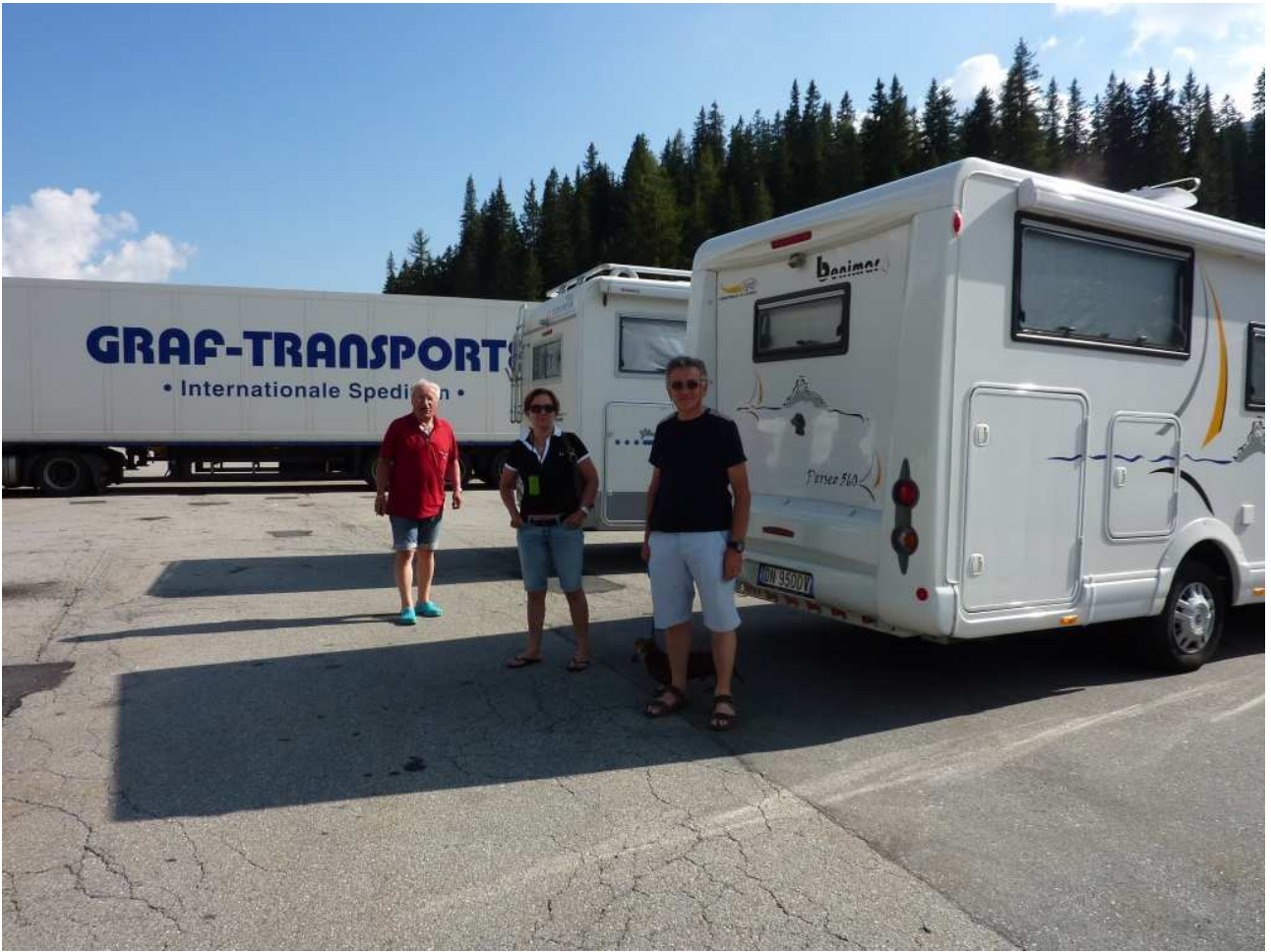
21/08/10 Passo del San Bernardino foto ricordo