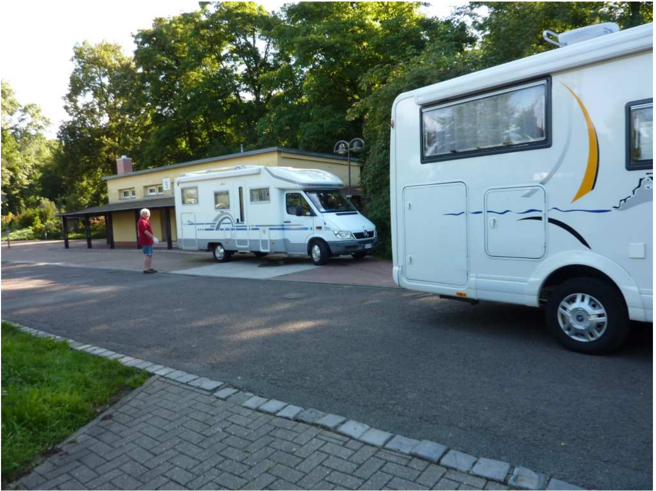
20/08/10 Lipsia Operazioni di carico e scarico in campeggio