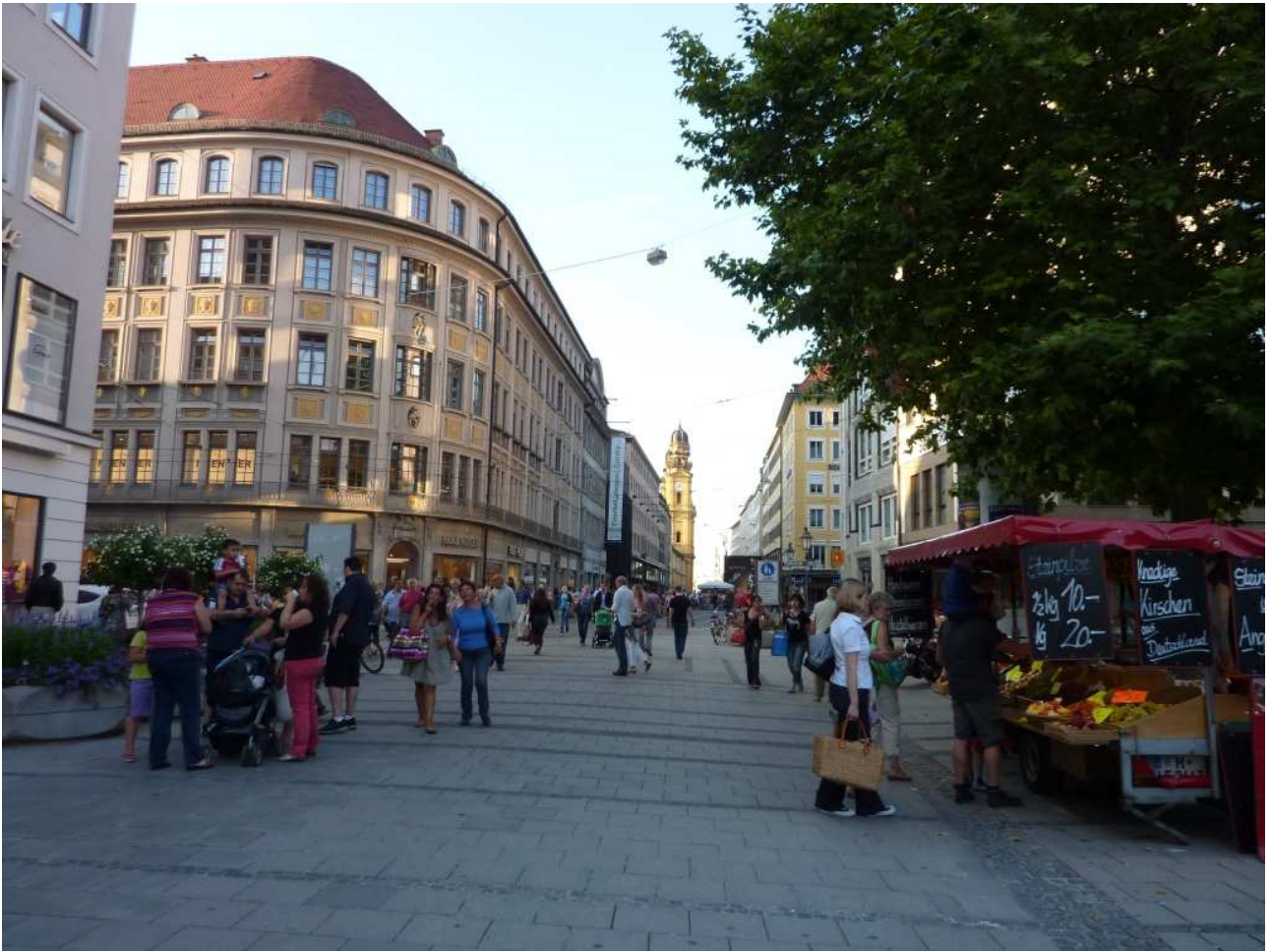
20/08/10 Monaco di Baviera a zonzo per le vie del centro