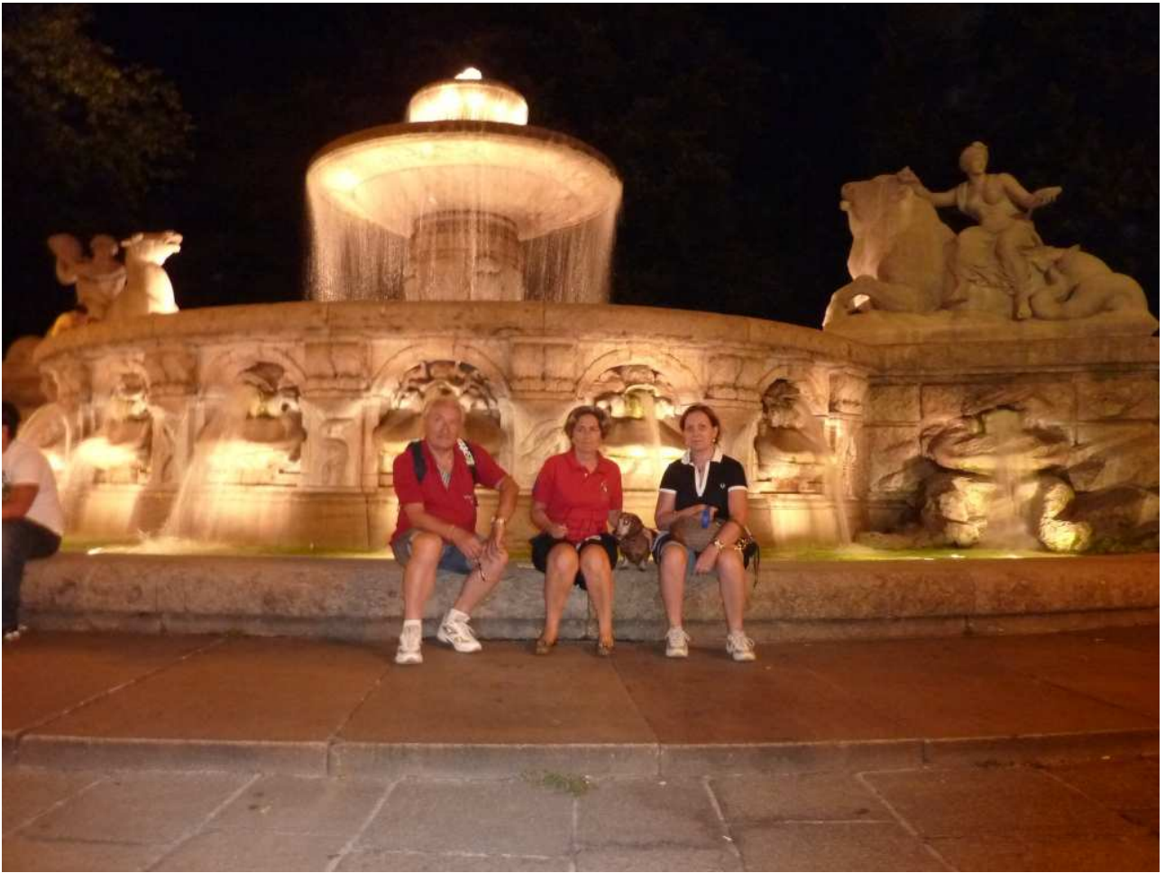
20/08/10 Monaco di Baviera ed altra foto ricordo davanti alla fontana