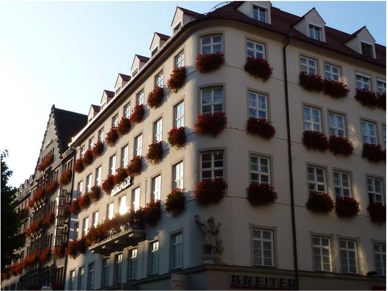
20/08/10 Monaco di Baviera .... Un bel palazzo fiorito