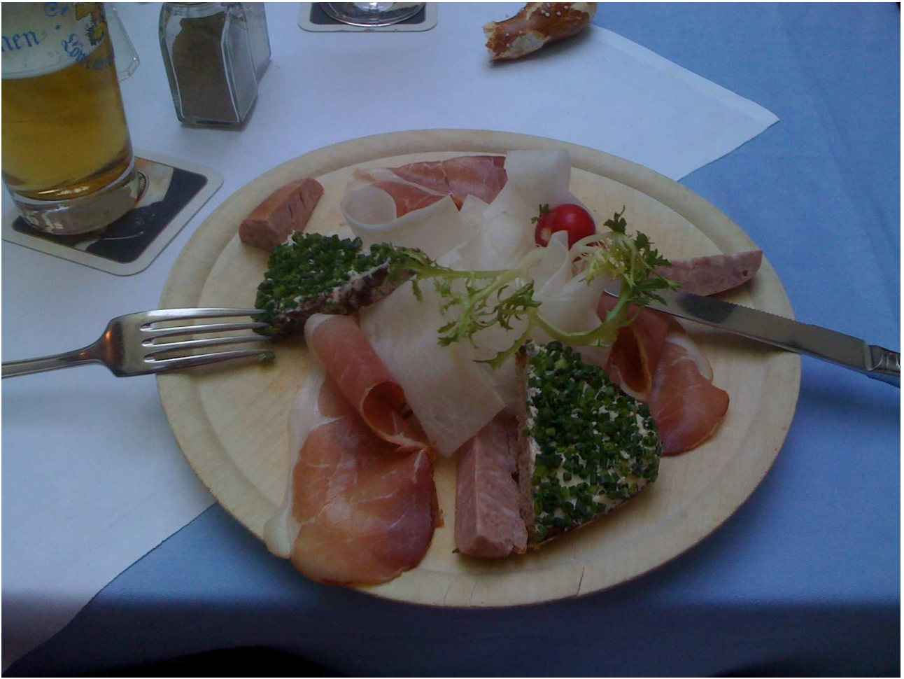
20/08/10 Monaco di Baviera il mio succulento piatto di antipasto tipico.