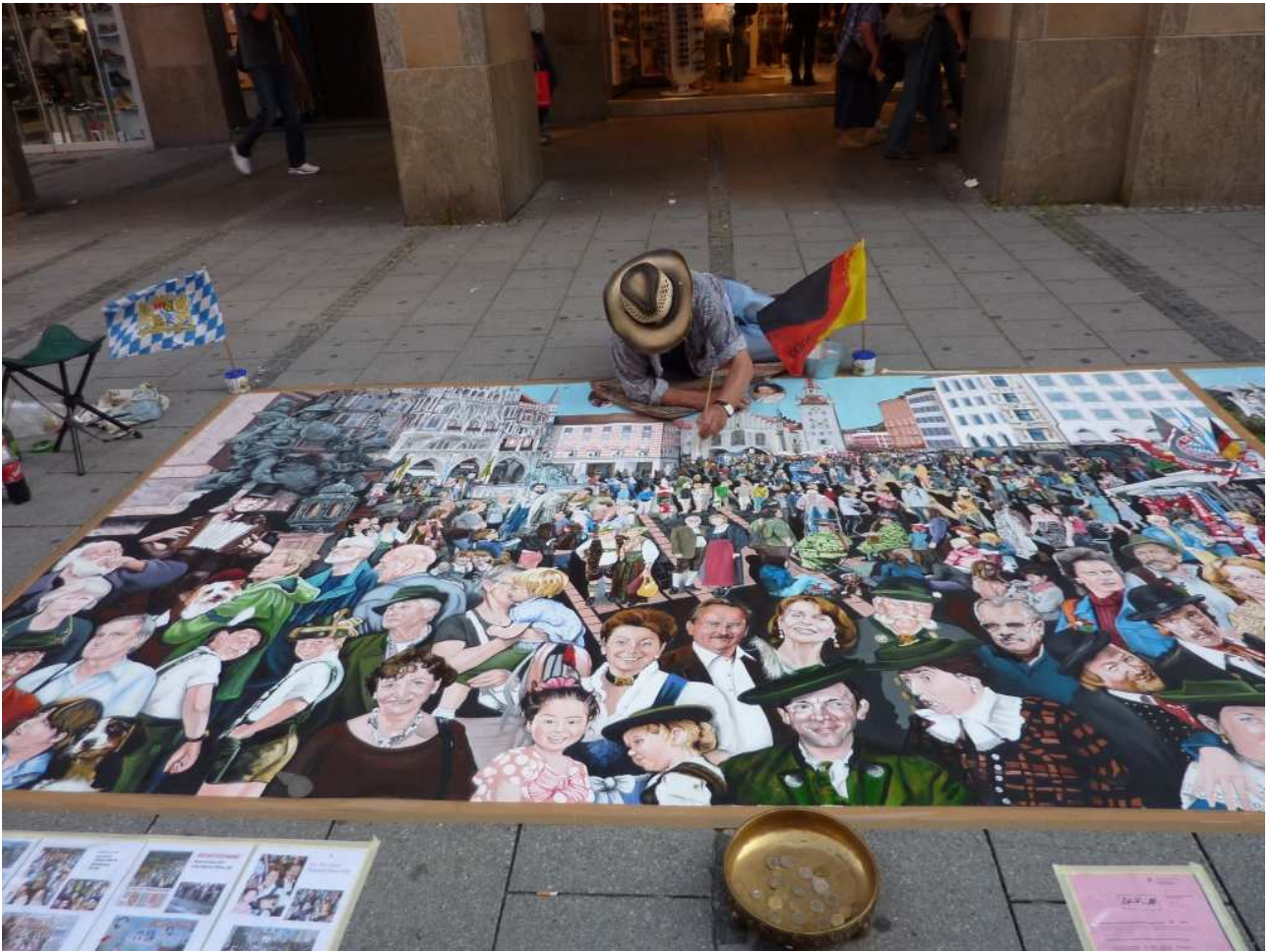
20/08/10 Monaco di Baviera un'artista di strada con la sua opera