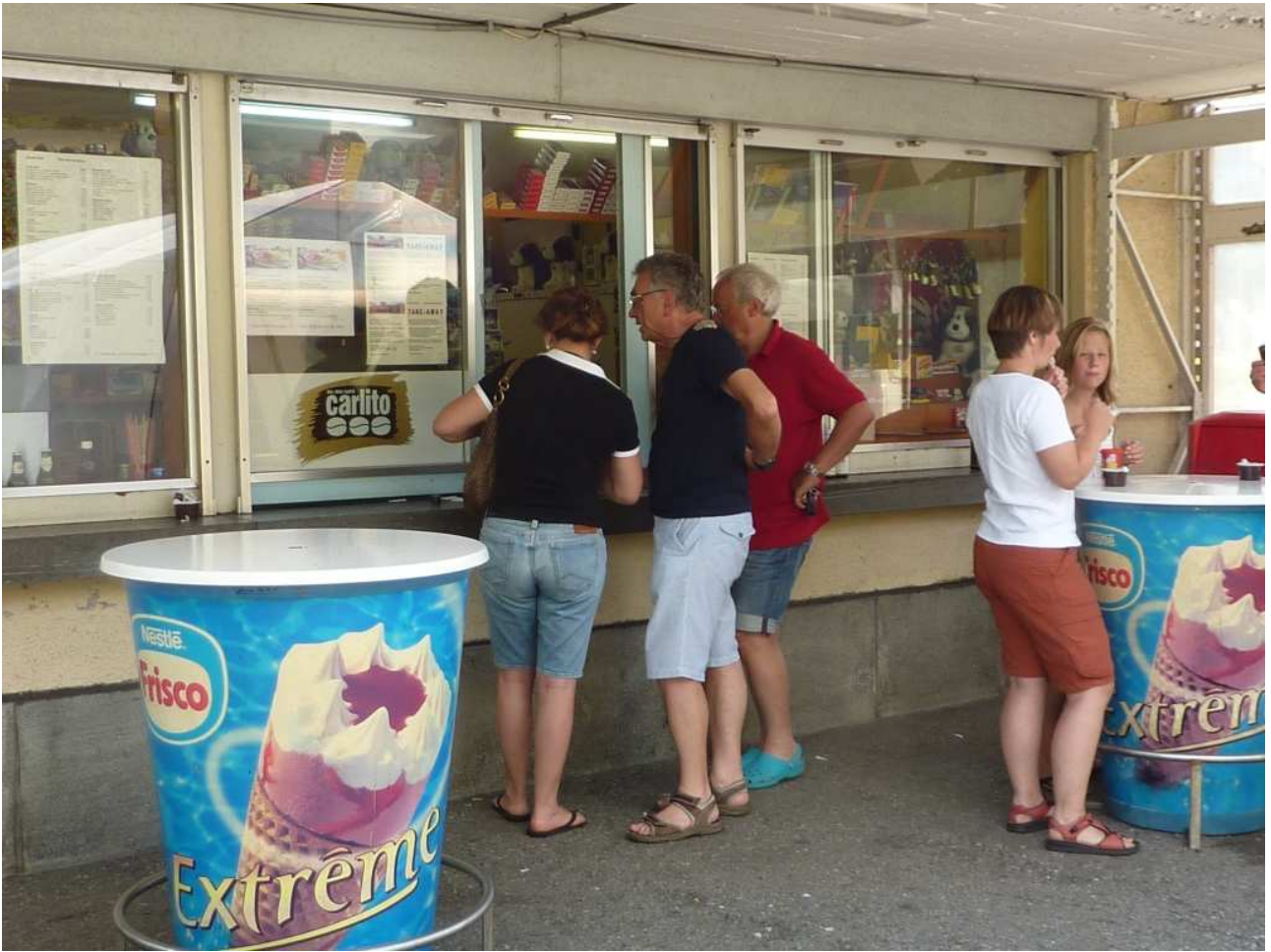
21/08/10 Passo del San Bernardino ..... dobbiamo spendere le ultime monetine in franchi svizzeri