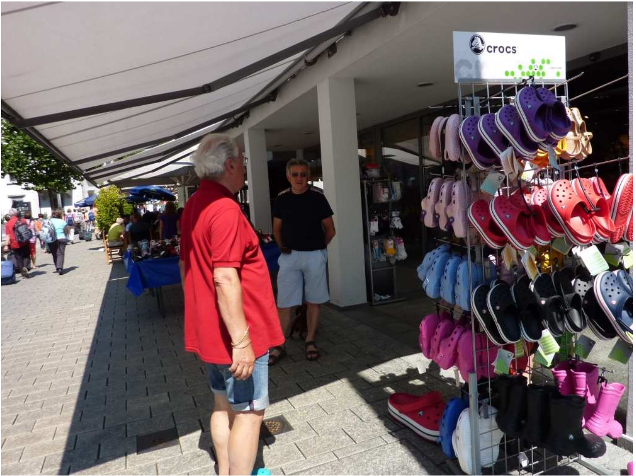
21/08/10 Vaduz girinzolando per le vie del centro