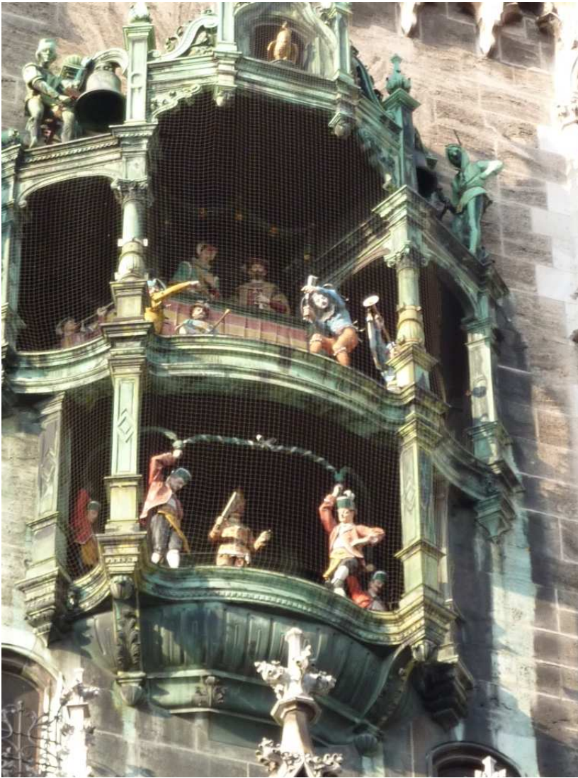
20/08/10 Monaco di Baviera un altro particolare del Municipio