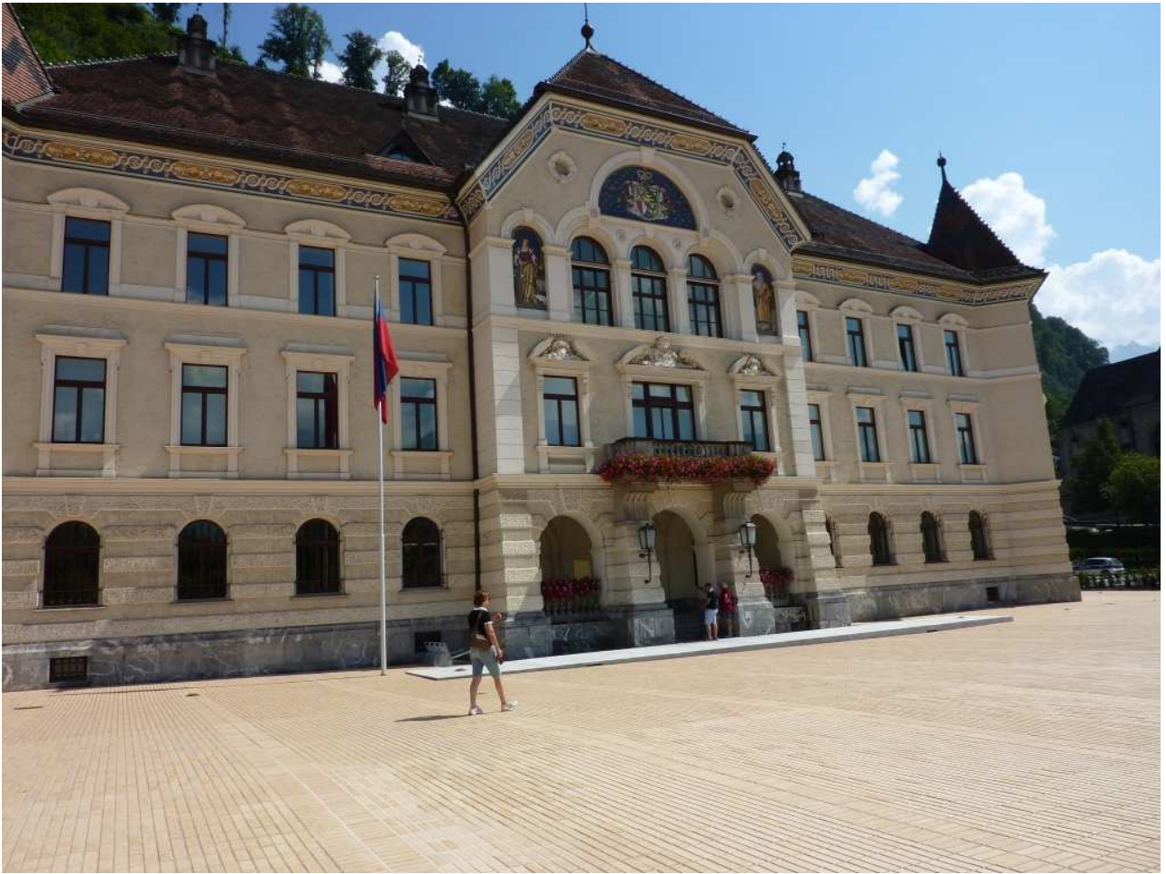
21/08/10 Vaduz il Municipio e forse anche sede del governo