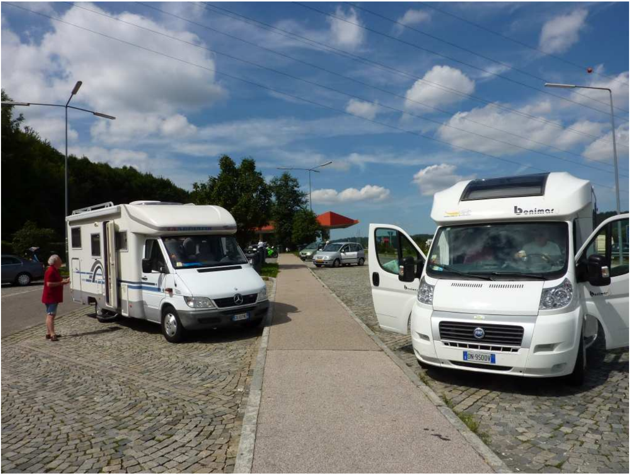
20/08/10 Una sosta per il pranzo durante il trasferimento verso Monaco di Baviera