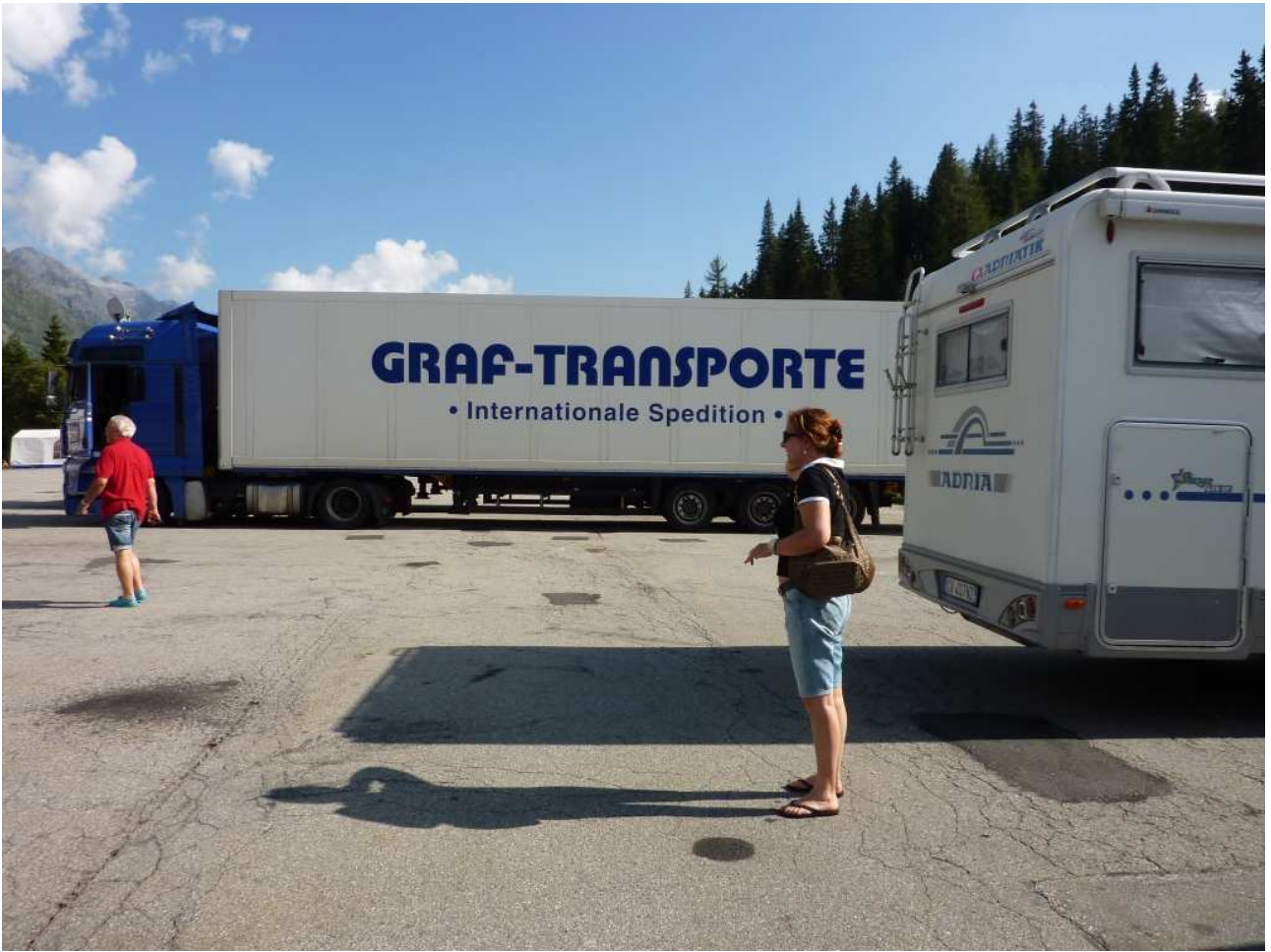
21/08/10 Passo del San Bernardino (Svizzera) e risiamo da dove eravamo partiti