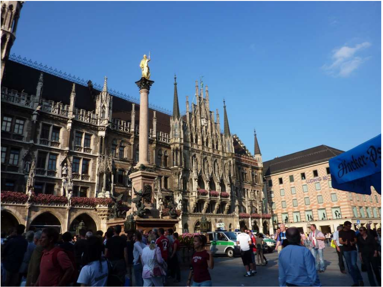
20/08/10 Monaco di Baviera il Municipio