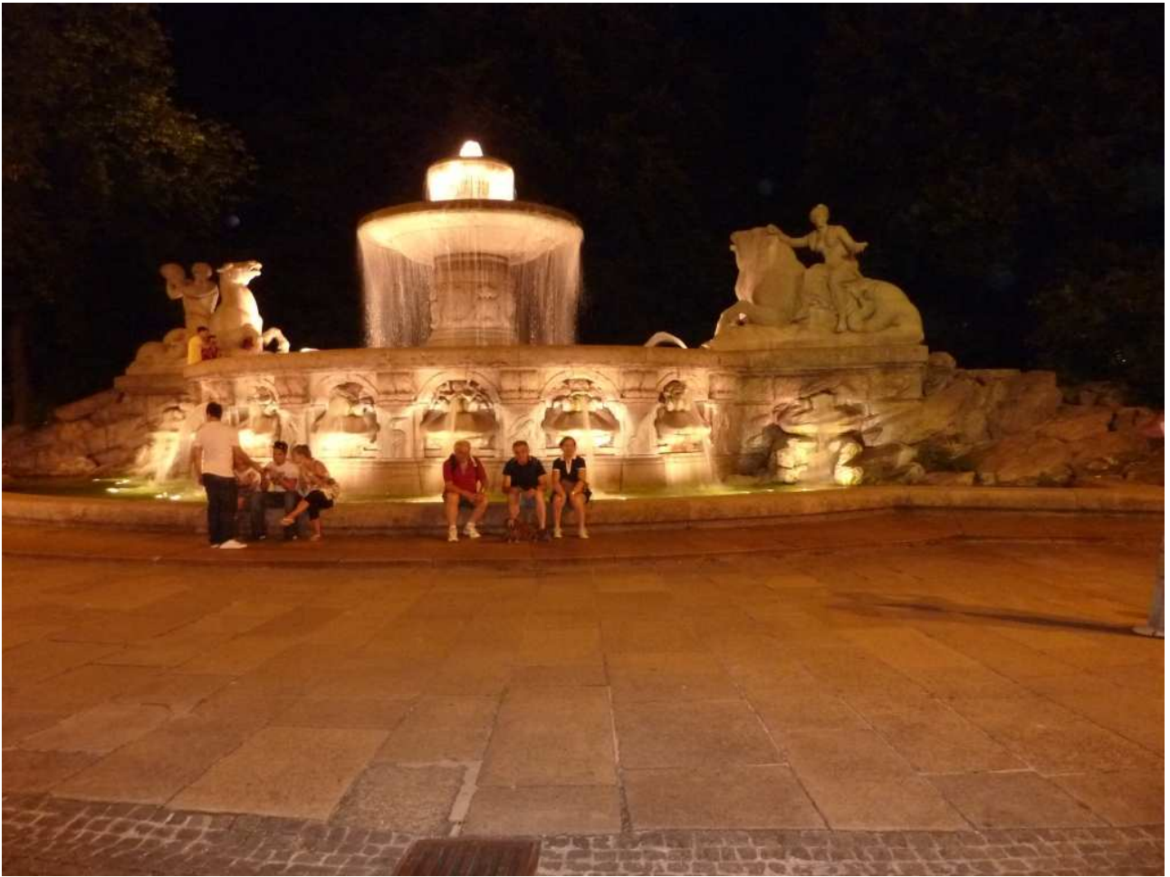
20/08/10 Monaco di Baviera foto ricordo davanti ad una splendida fontana