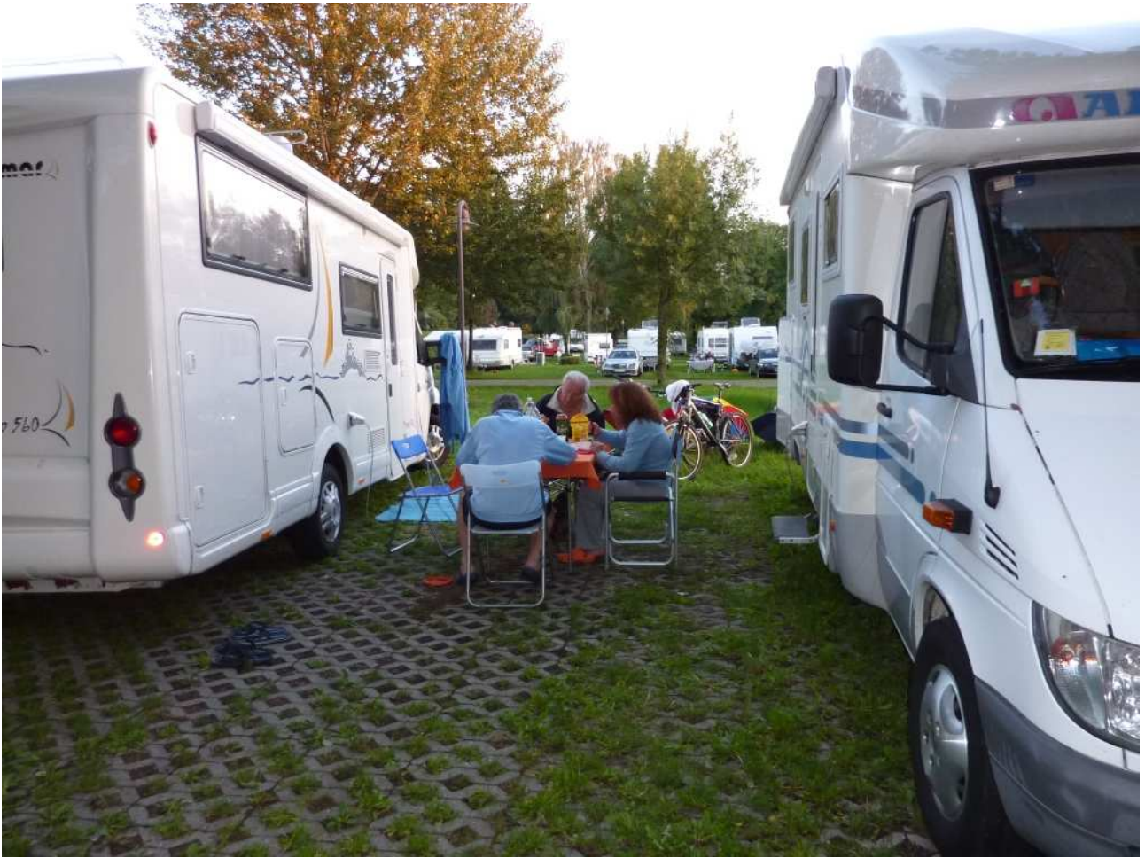
19/08/10 Lipsia Cena in campeggio