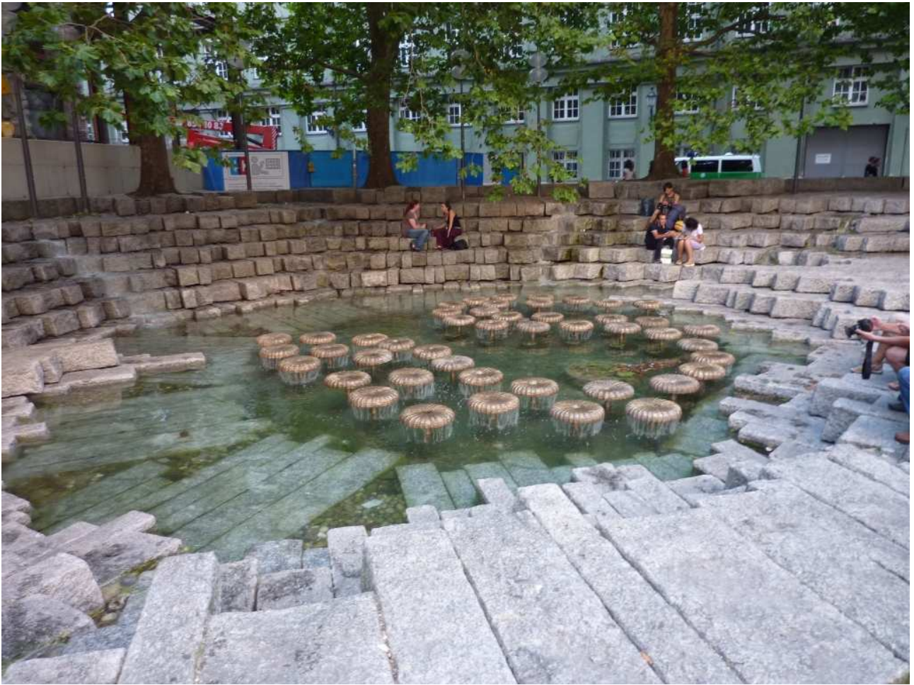
20/08/10 Monaco di Baviera una fontana