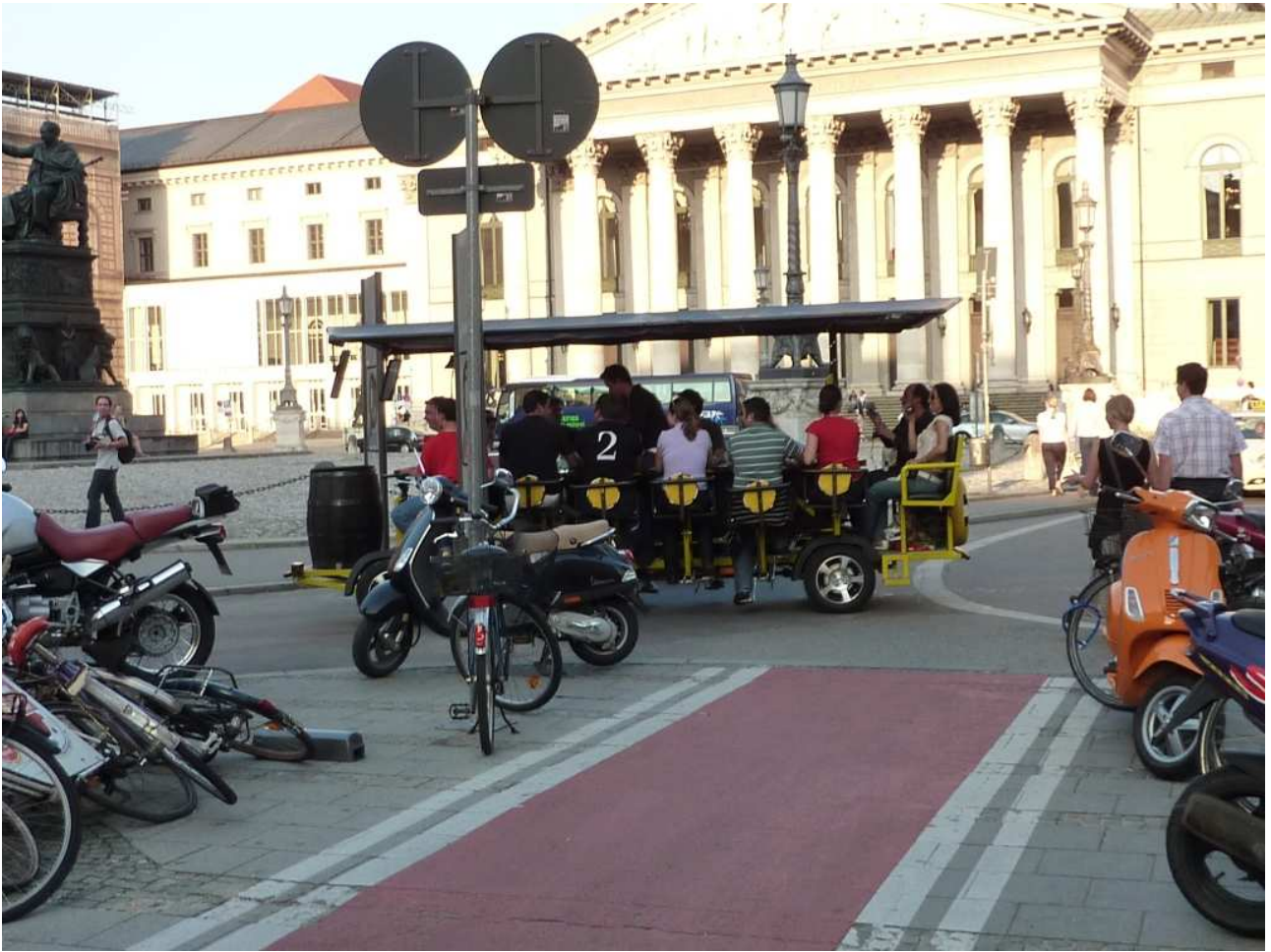
20/08/10 Monaco di Baviera una piazza del centro