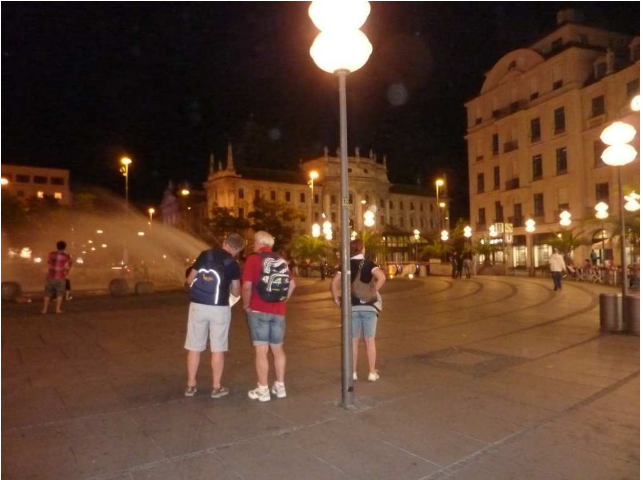
20/08/10 Monaco di Baviera ..... girovagando per la città notturna