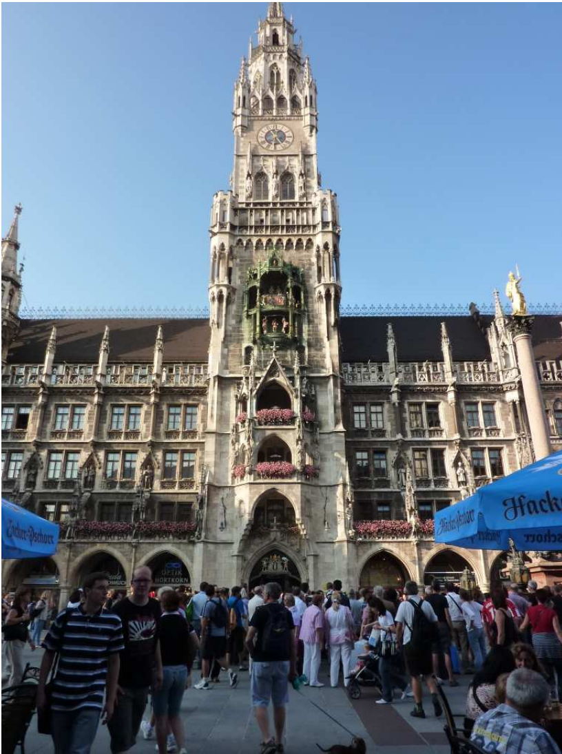
20/08/10 Monaco di Baviera arriviamo con il treno in piazza del Municipio