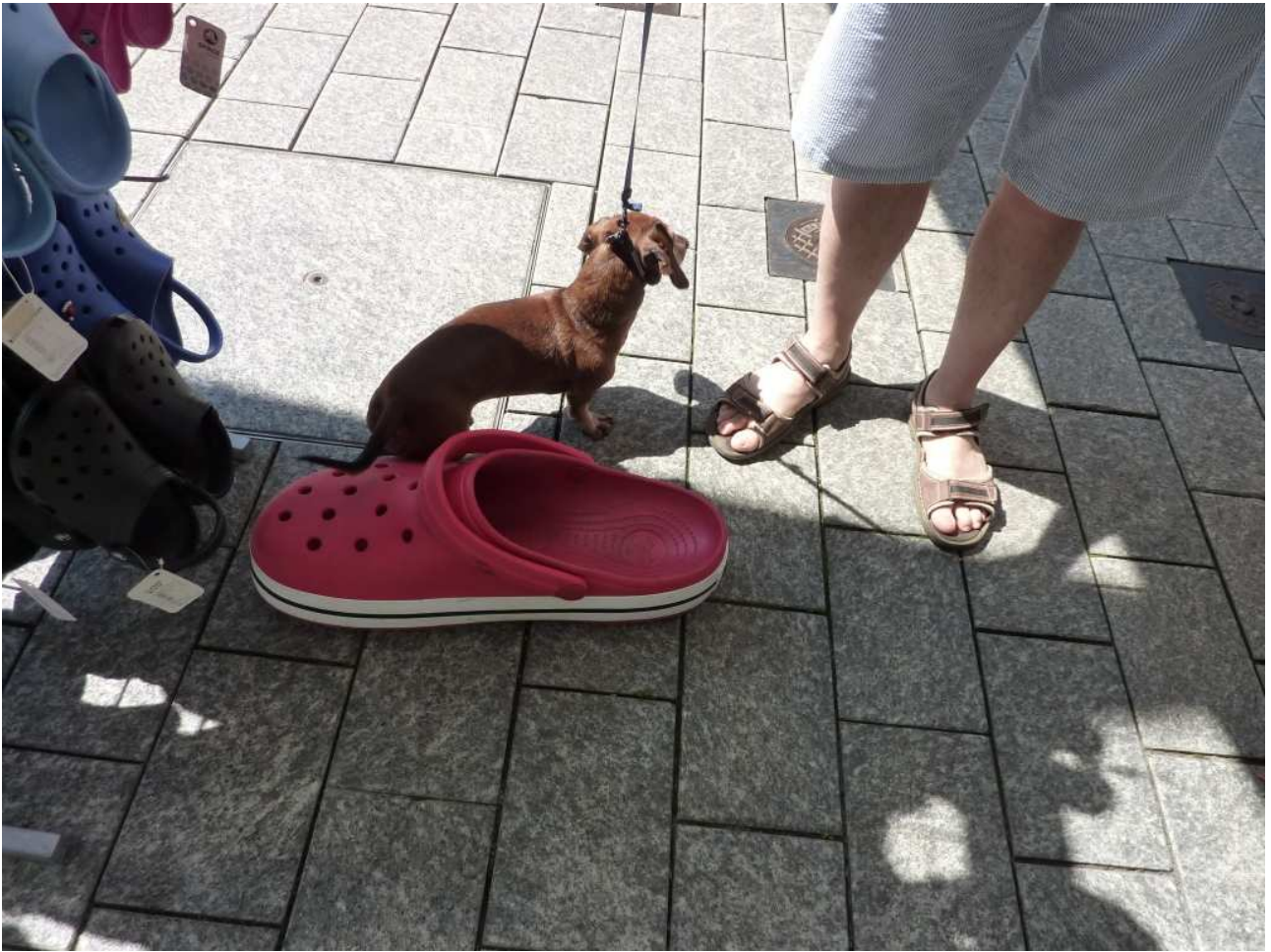
21/08/10 Vaduz il Teo e la super Crocs