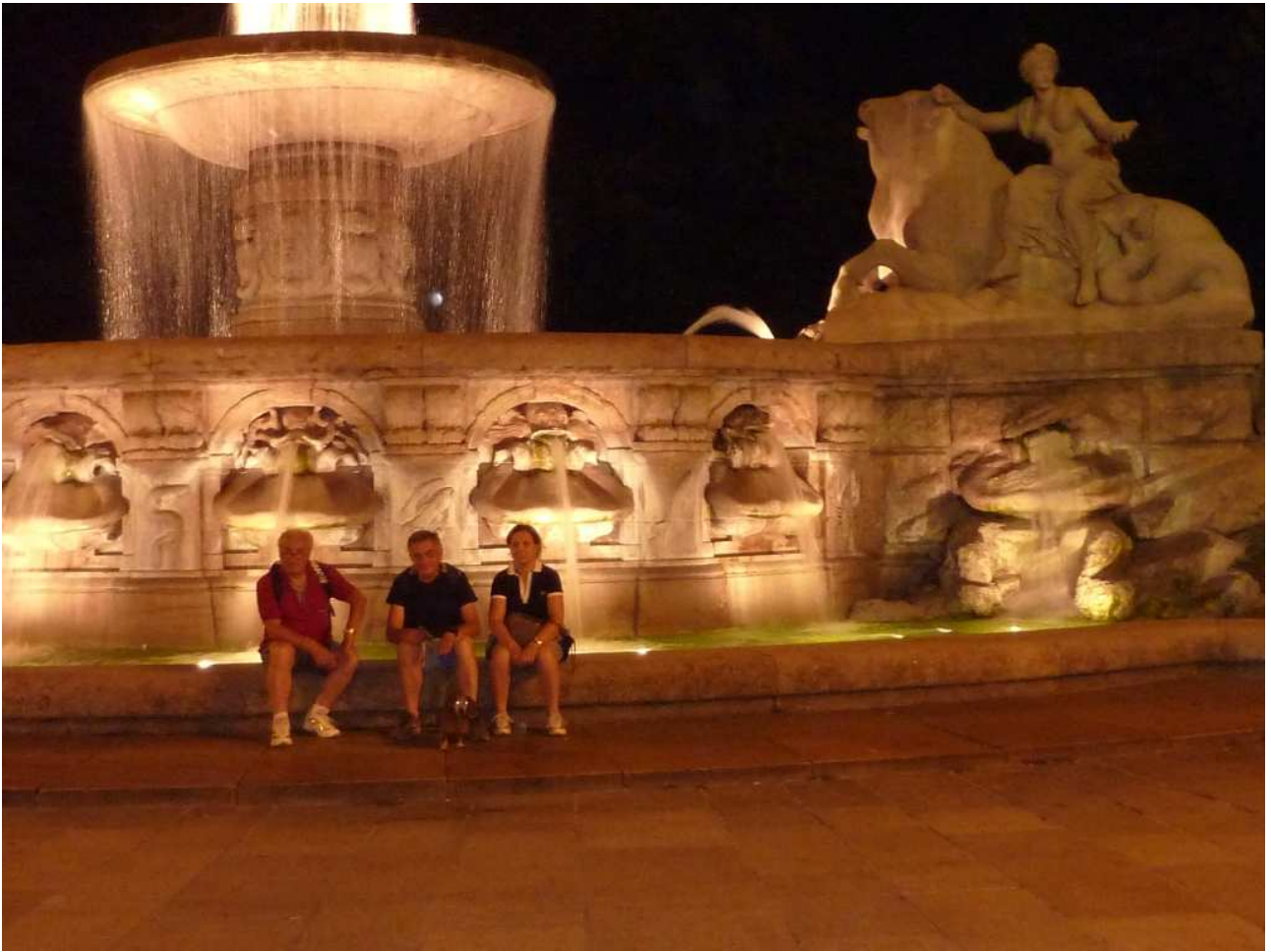
20/08/10 Monaco di Baviera ....altra foto ricordo davanti alla fontana