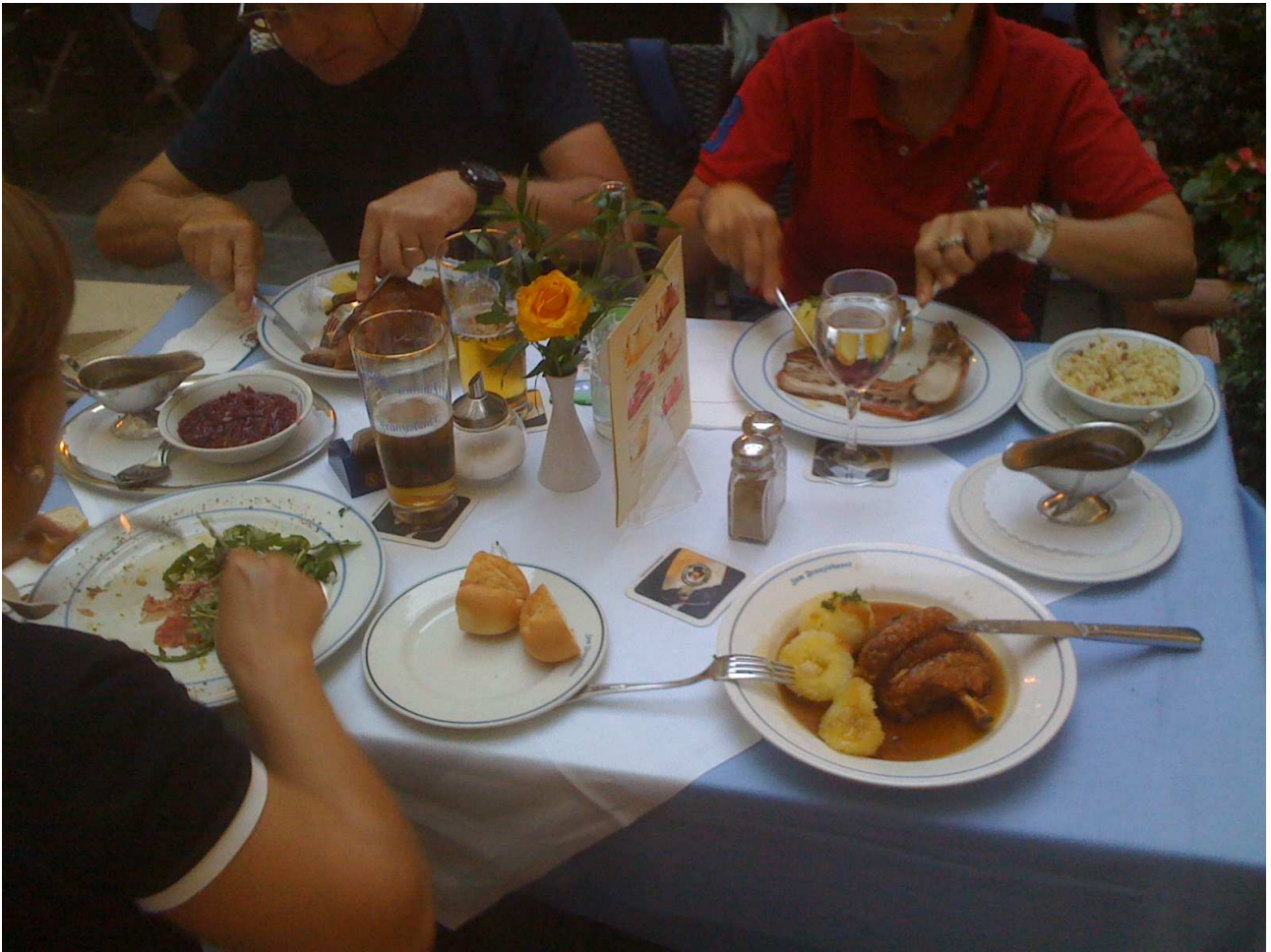
20/08/10 Monaco di Baviera al ristorante .... Sulla destra il mio piatto con stinco e patate. SQUISITI