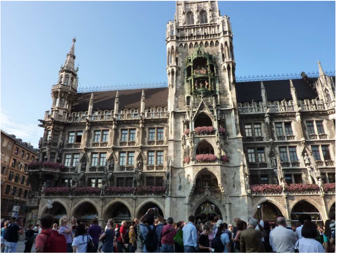
20/08/10 Monaco di Baviera il Municipio