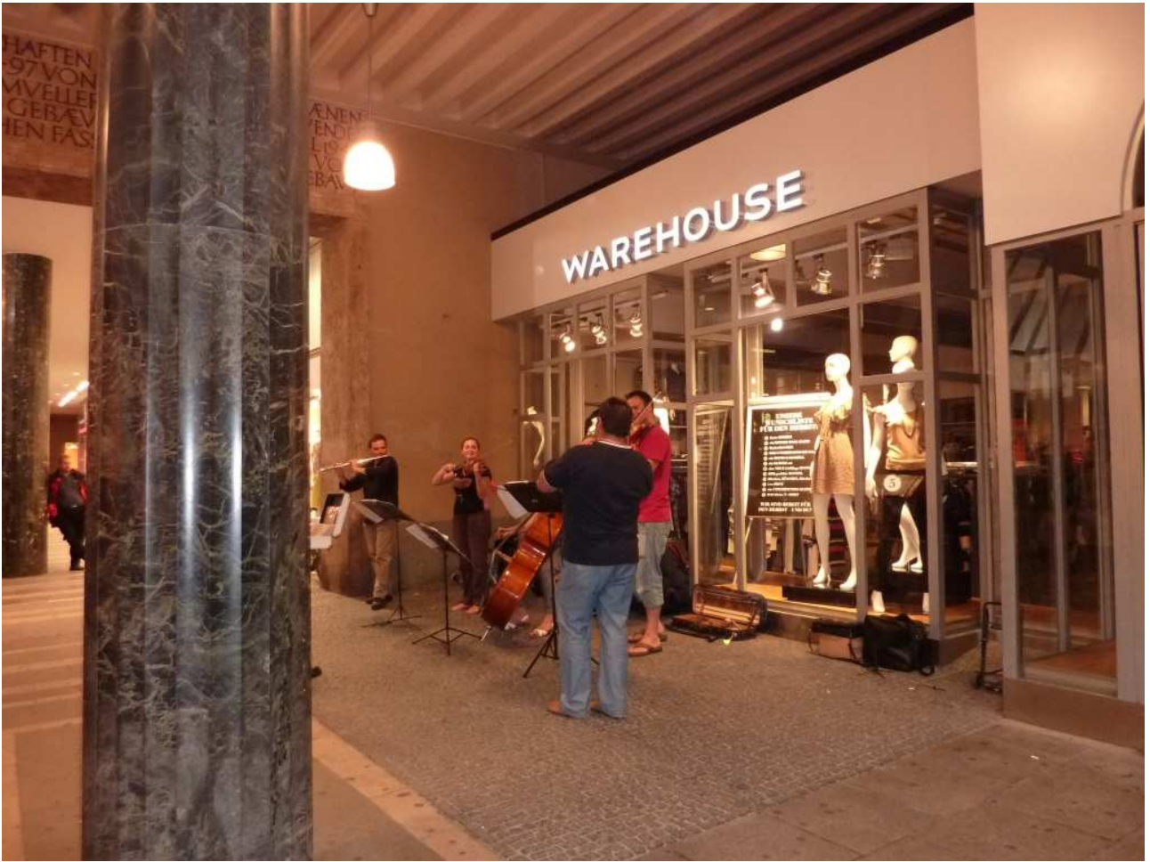
20/08/10 Monaco di Baviera bravissimi suonatori di strada