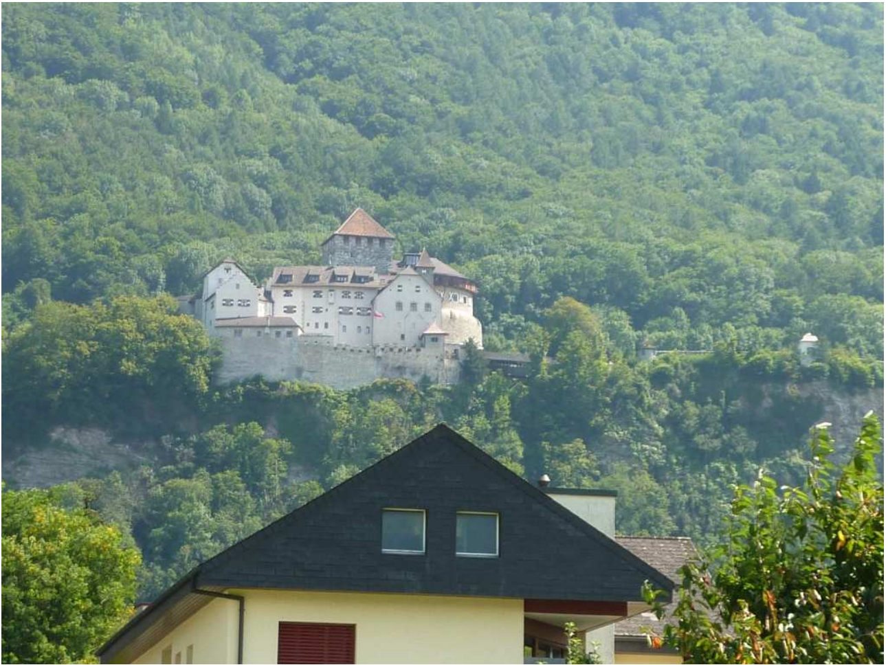
21/08/10 Vaduz (capitale del Lichtenstein) il Castello