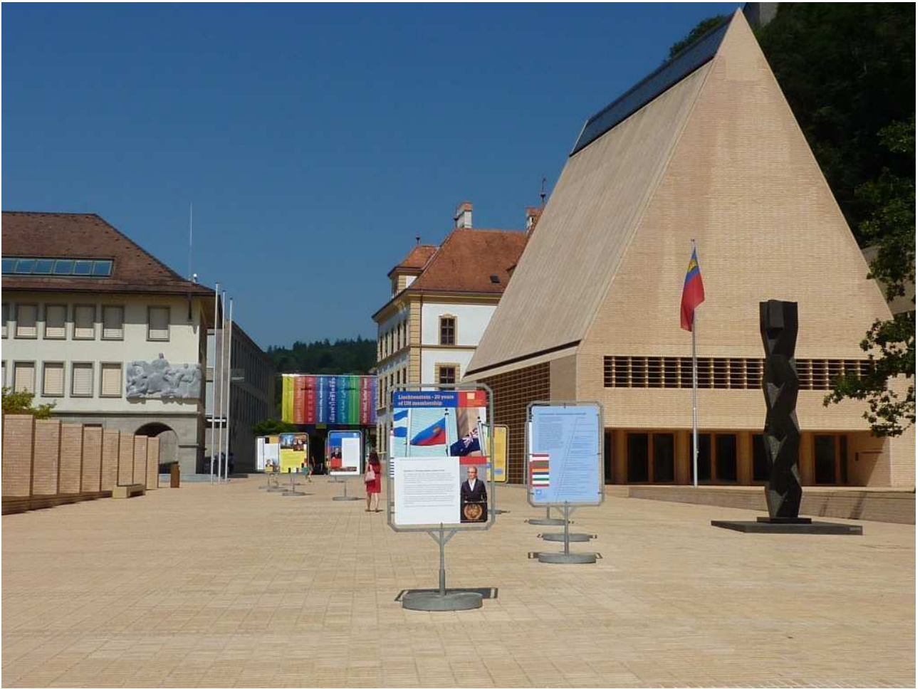
21/08/10 Vaduz una piazza della capitale del Licktenstein