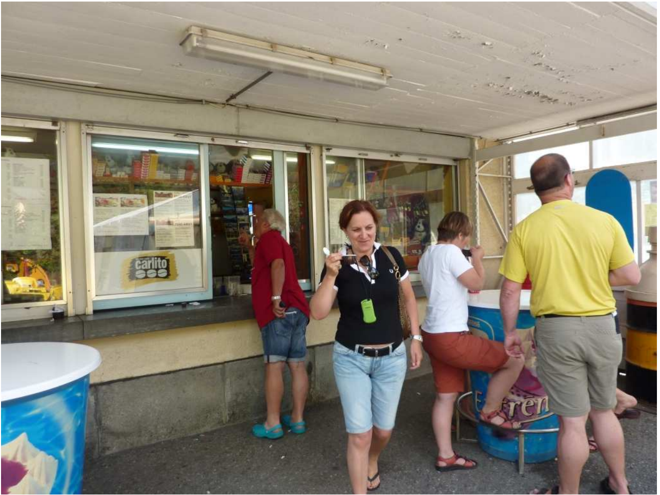
21/08/10 Passo del San Bernardino ..... e noi l'ultimo caffè