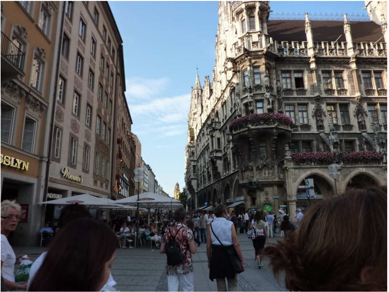
20/08/10 Monaco di Baviera ..... Per le strade della città