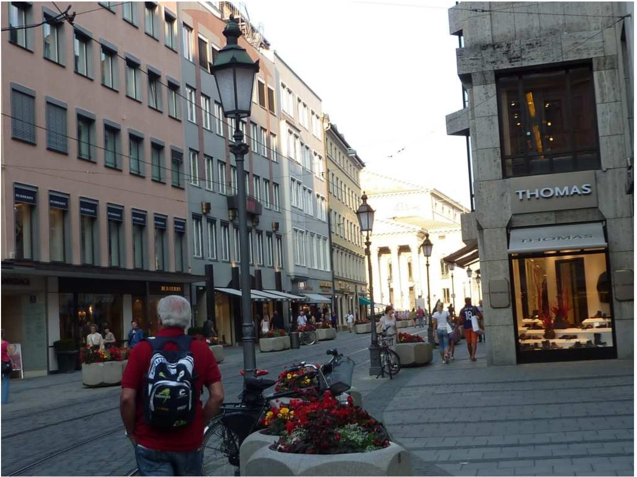
20/08/10 Monaco di Baviera ..... alla ricerca di un ristorante