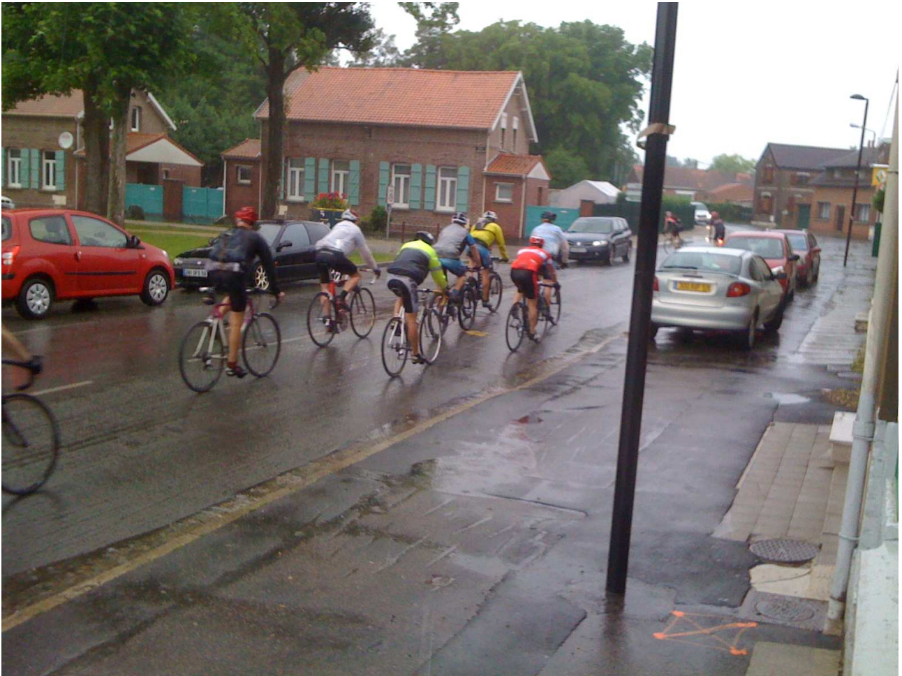
Domenica 6 giugno 2010 Aremberg ..... passaggio di ciclisti sotto la pioggia