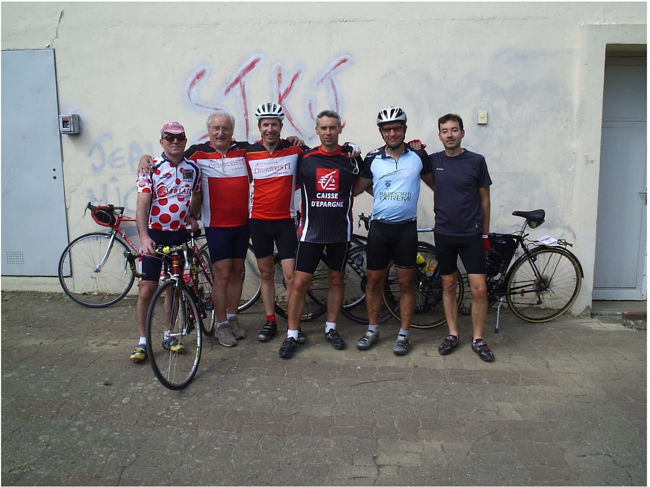
Sabato 5 giugno 2010 Cambronne-lès-Ribécourt foto ricordo appena dopo l'iscrizione.