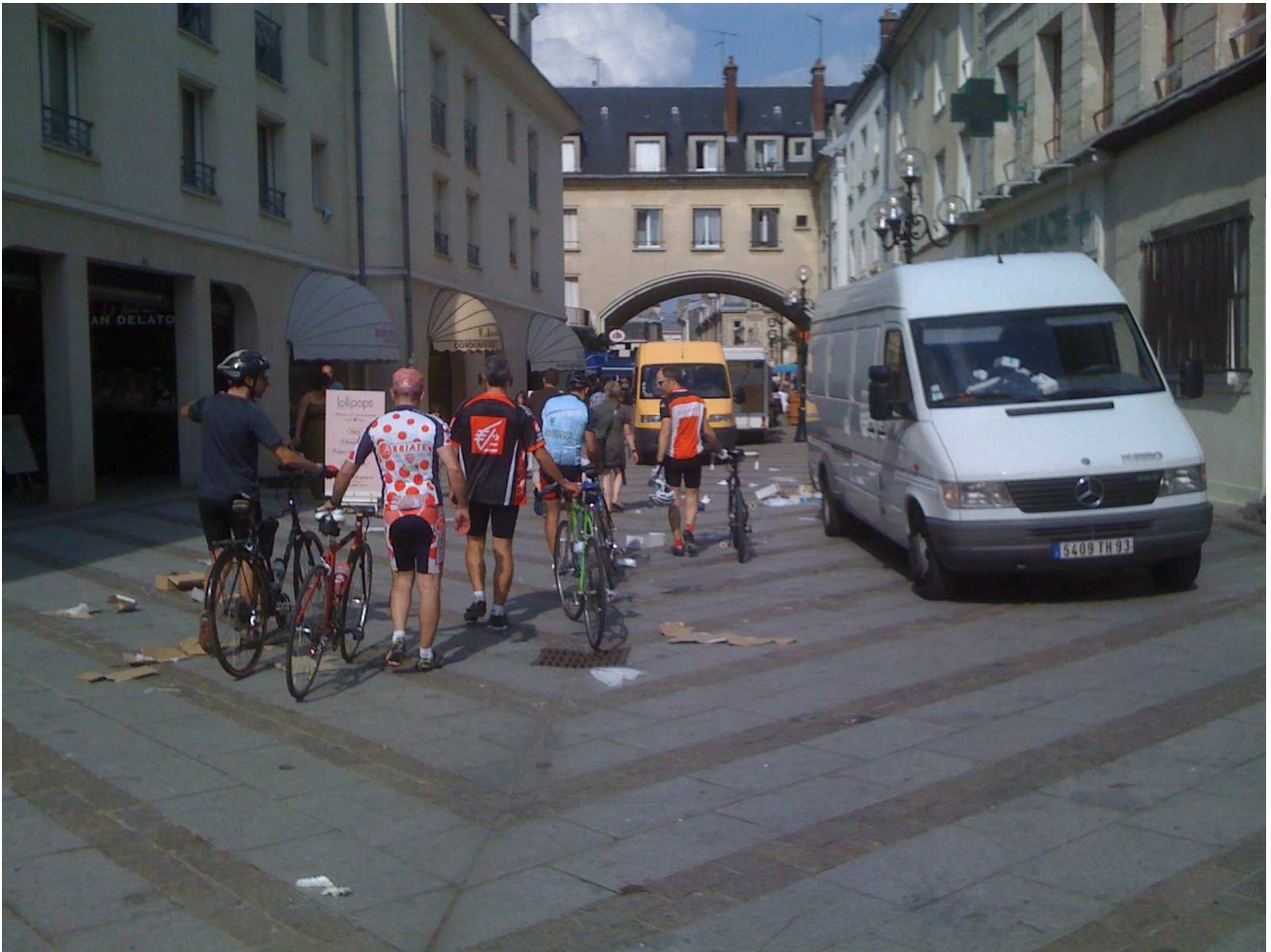
Sabato 5 giugno 2010 Compiegne A zozzo per le strade del mercato.