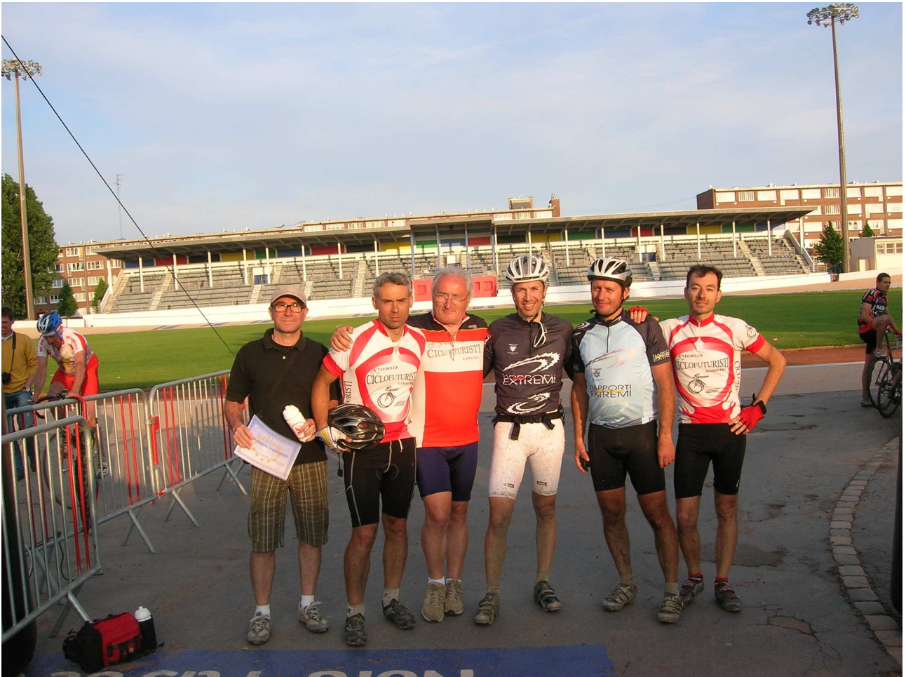
Domenica 6 giugno 2010 Roubaix ore 20,15 Foto ricordo, e che ricordo, all'ingresso del Velodromo