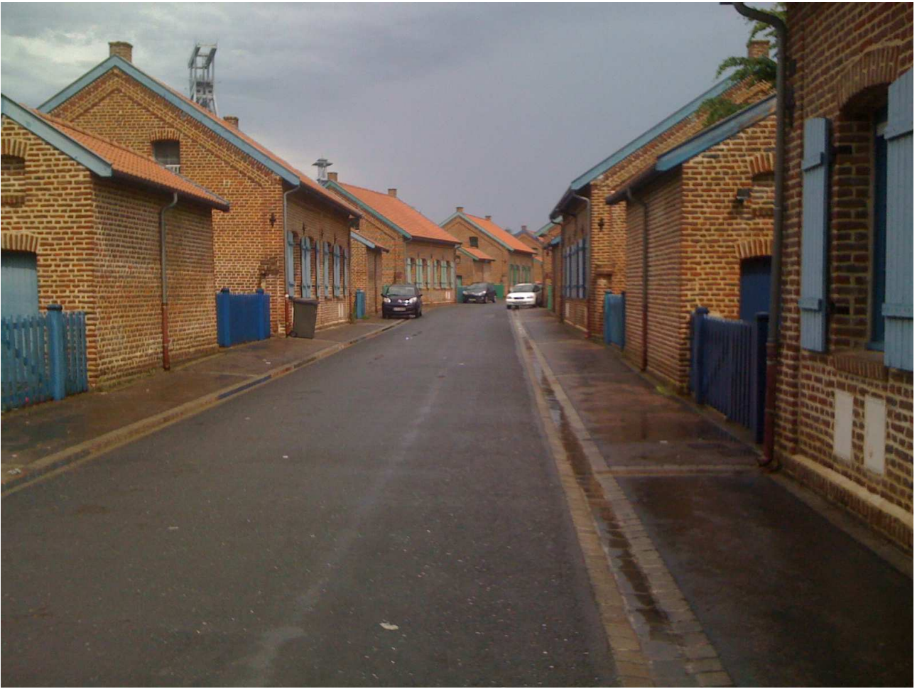
Domenica 6 giugno 2010 Aremberg .... Tipiche stradine dei villaggi di quelle latitudini