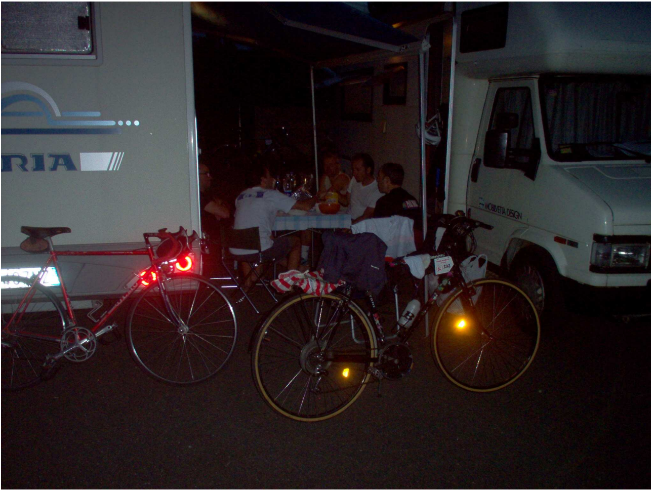
Sabato 5 giugno 2010 Cambronne-lès-Ribécourt Cena sotto la veranda.