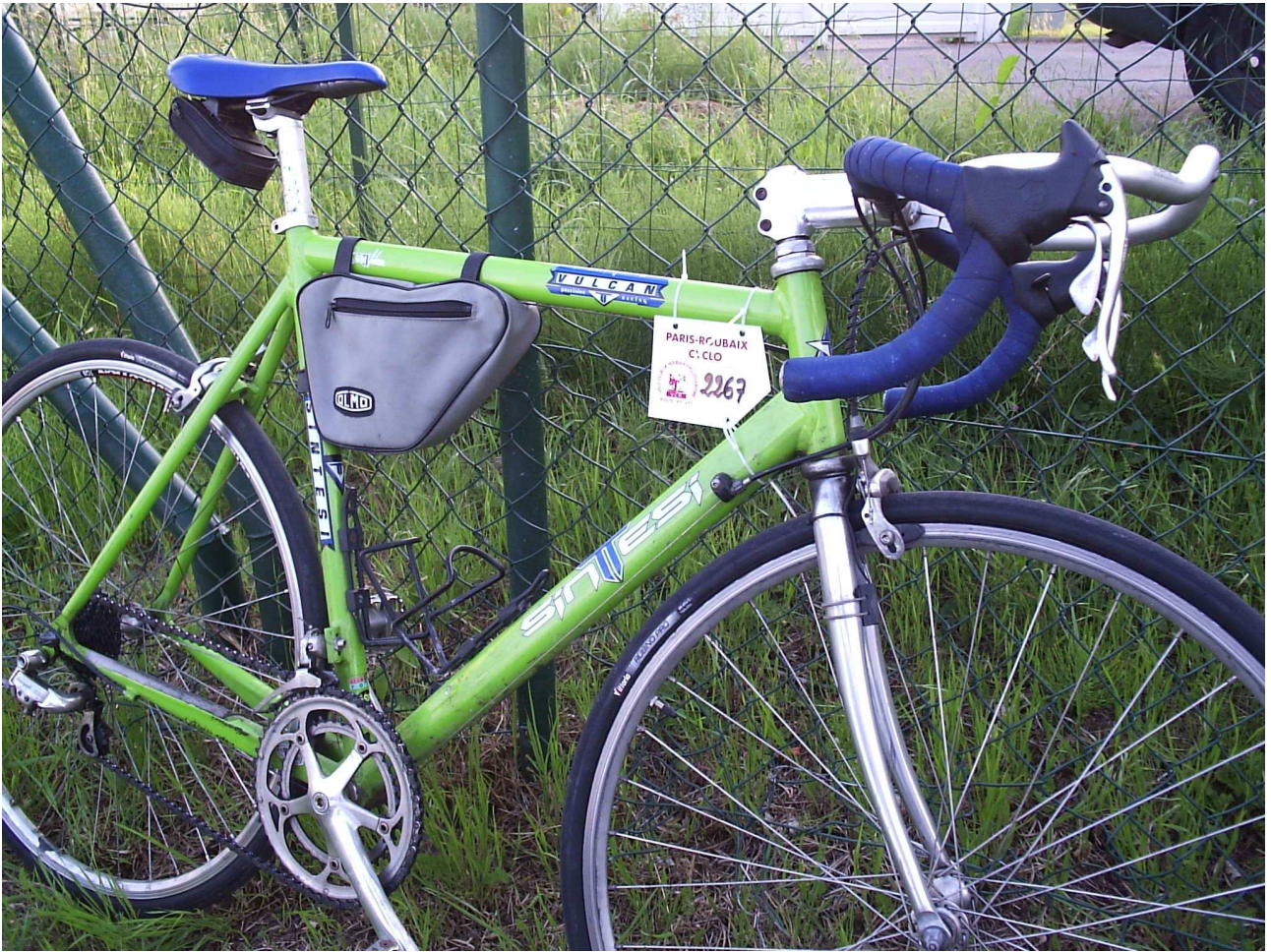
Sabato 5 giugno 2010 Cambronne-lès-Ribécourt ..... la bici di Igor già iscritta col N°2267.