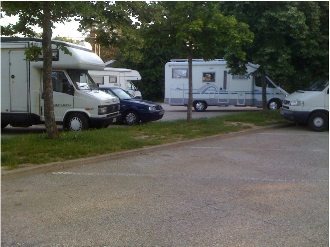
Sabato 5 giugno 2010. Sosta in un'area di servizio nei pressi di Lione.