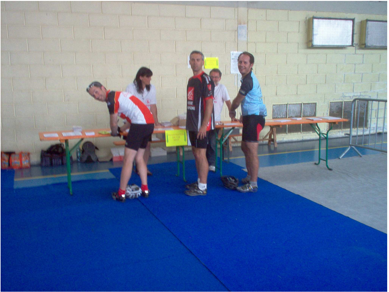
Sabato 5 giugno 2010 Cambronne-lès-Ribécourt Operazioni per l'iscrizione alla Parigi-Roubaix Cyclo 2010.