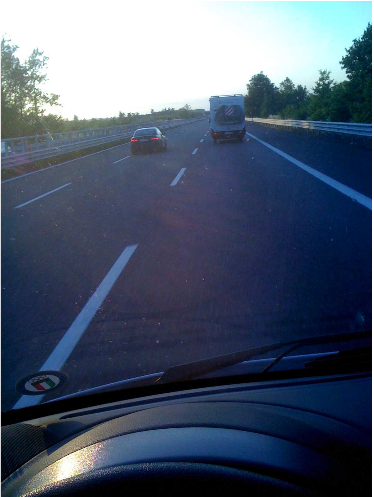
Venerdì 4 giugno 2010 In autostrada ..... verso la Parigi-Robaix