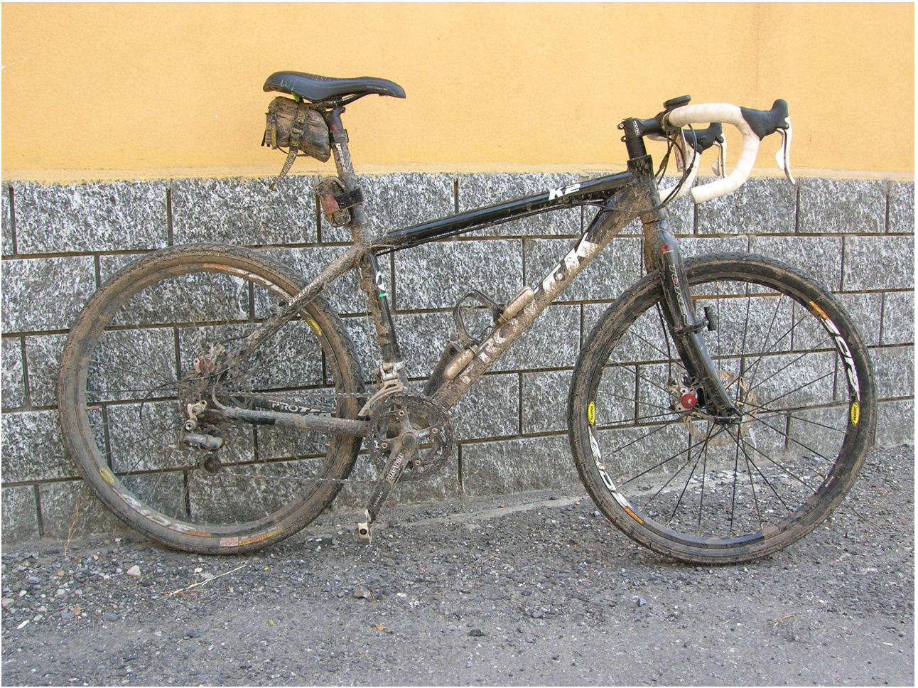
Domenica 6 giugno 2010 Roubaix la bici di Stefano com'è all'arrivo.