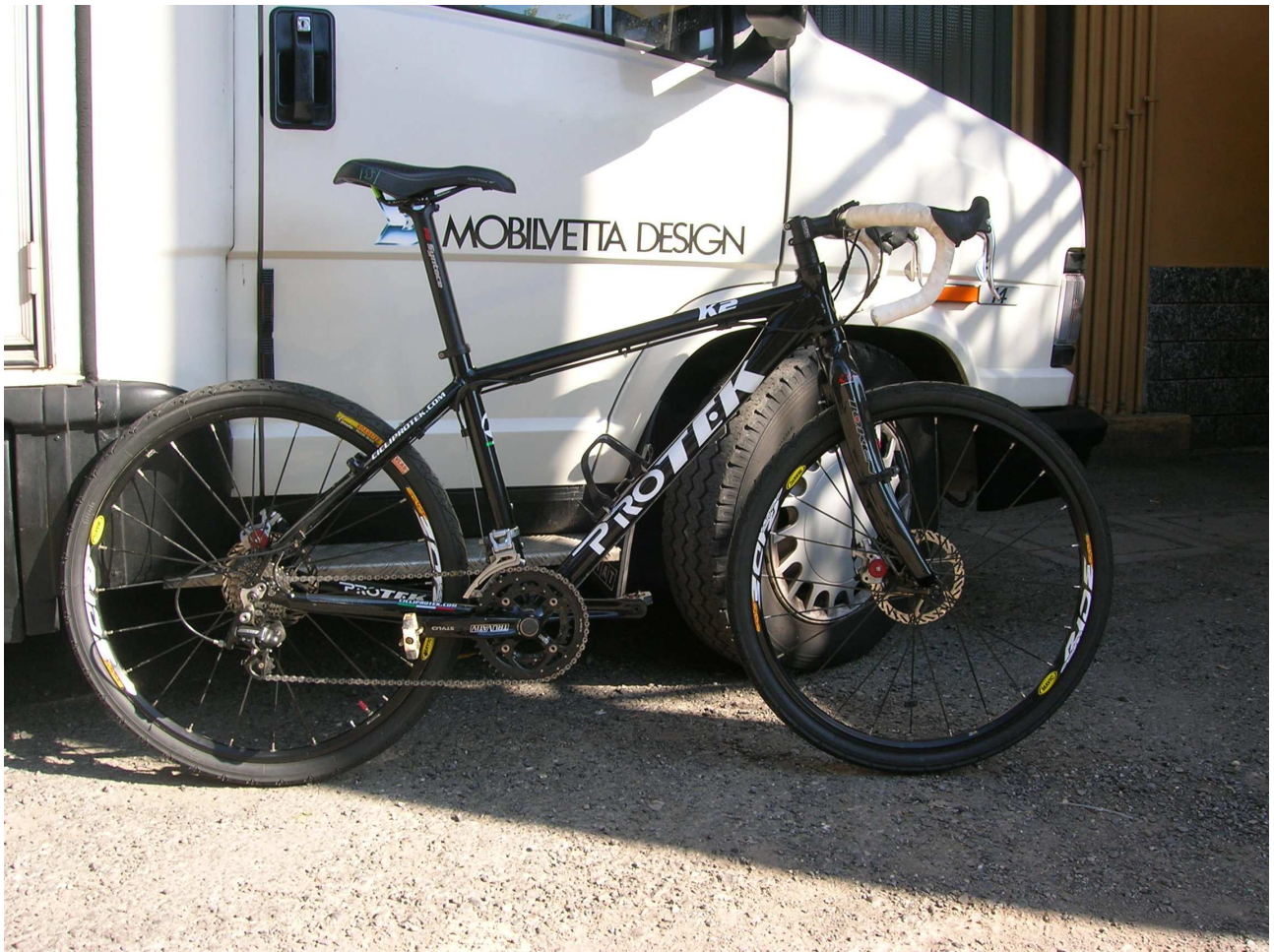
Domenica 6 giugno 2010 Roubaix la bici di Stefano ..... com'era alla partenza