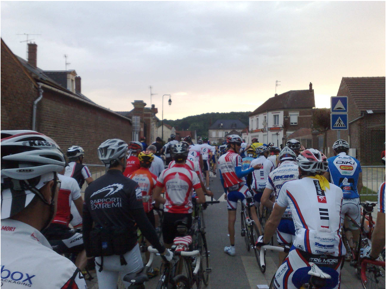
Domenica 6 giugno 2010 Cambronne-lès-Ribécourt ..... ore 6,30 si parte.