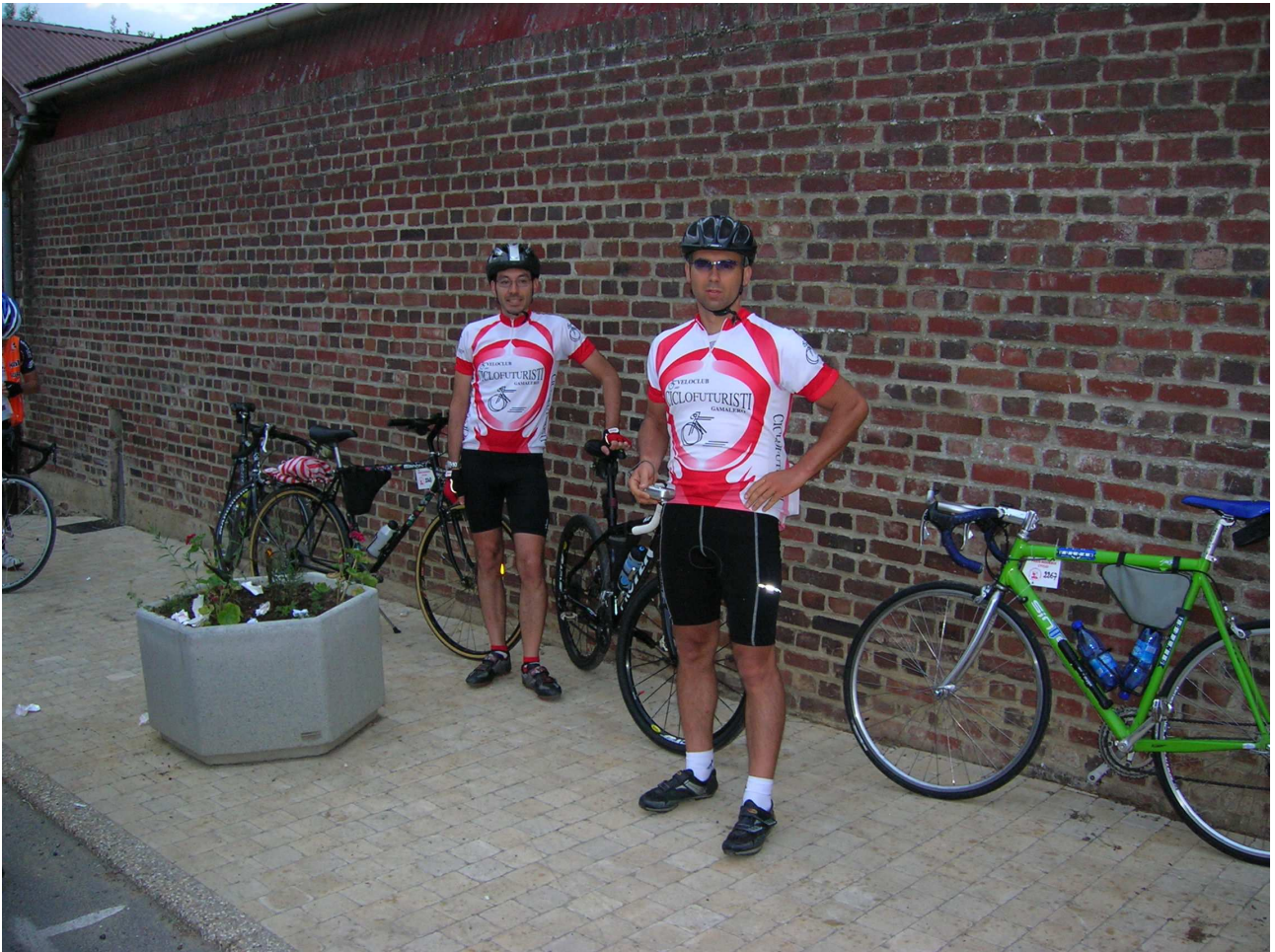
Domenica 6 giugno 2010 Cambronne-lès-Ribécourt ore 6 è quasi l'ora della partenza.