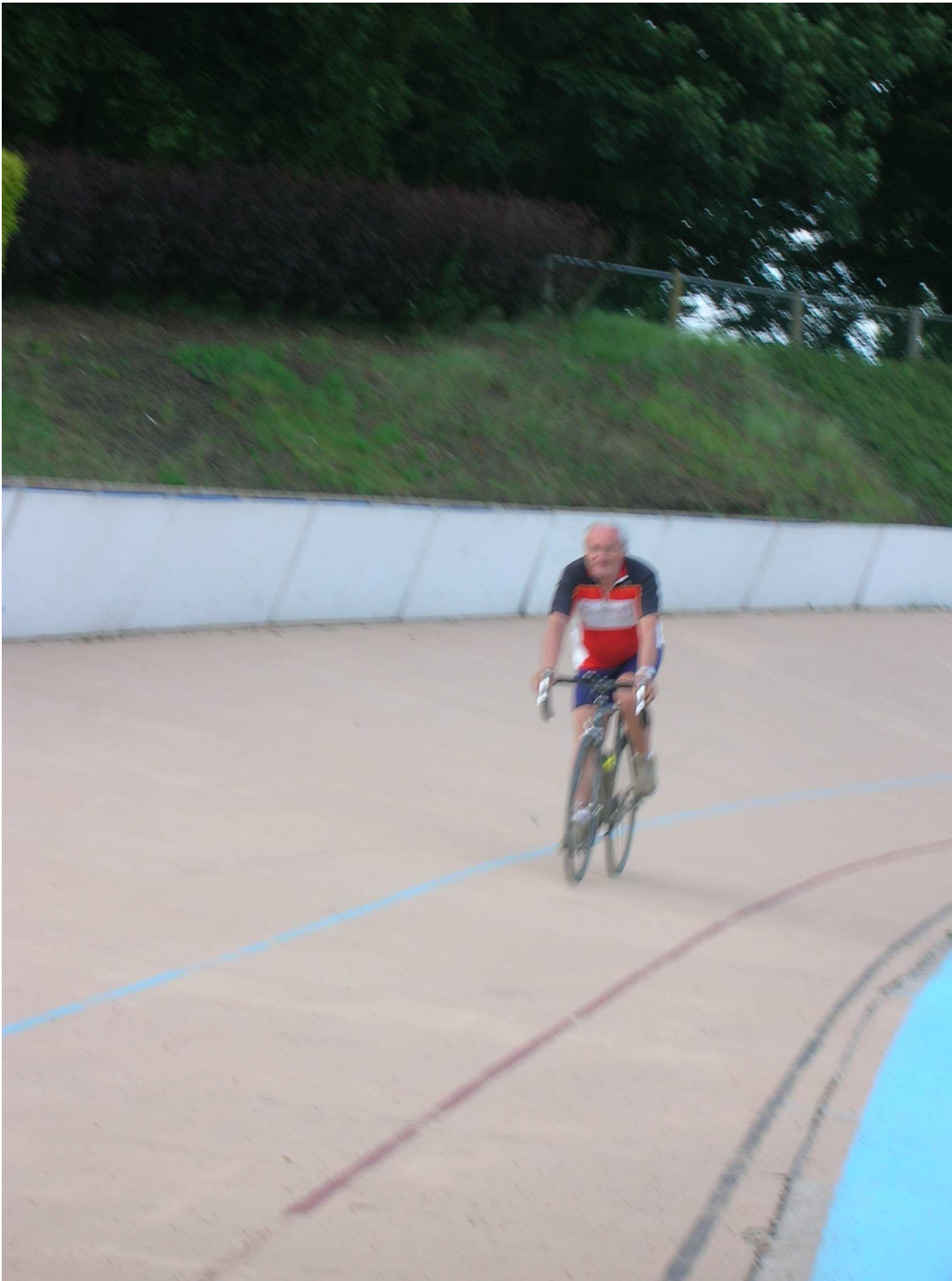
Domenica 6 giugno 2010 Roubaix ..... anch'io ho voluto provare l'emozione di un giro nel Velodrome