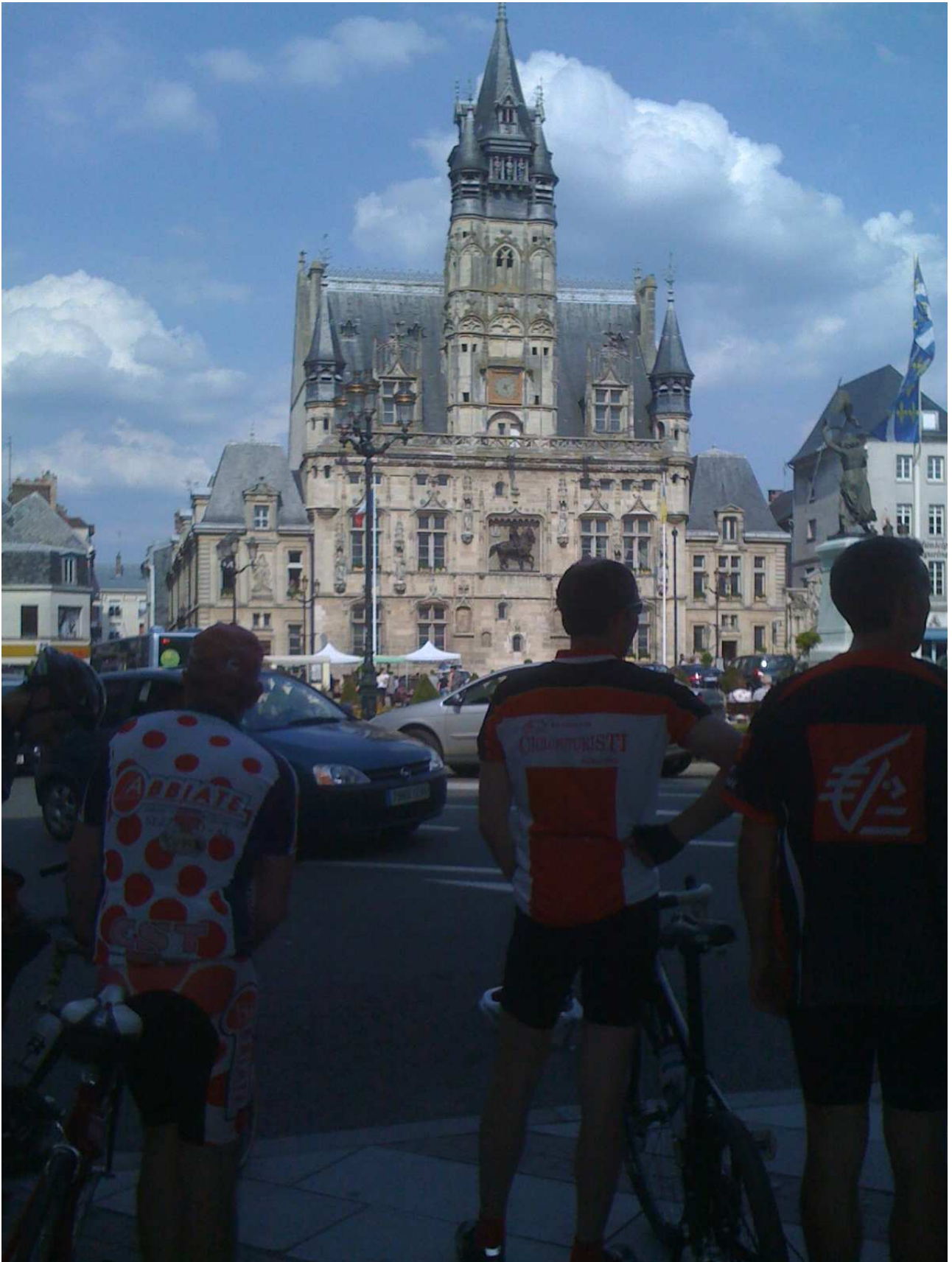
Sabato 5 giugno 2010 Compiegne In visita alla città. (a destra sopra la testa di Igor il monumento a Giovanna D'arco).