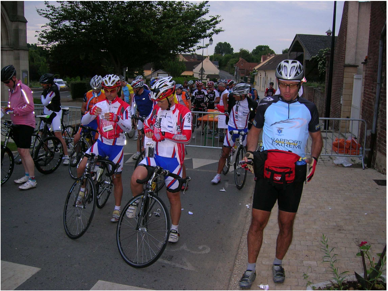
Domenica 6 giugno 2010 Cambronne-lès-Ribécourt La partenza è imminente