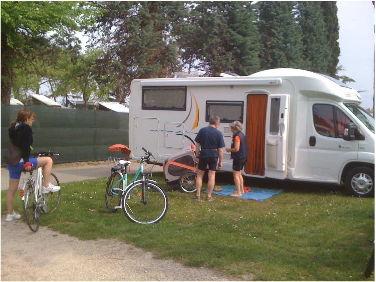
Sabato 1° maggio 2010 – Peschiera del Garda – Camping Cappuccini – Preparativi per la pedalata