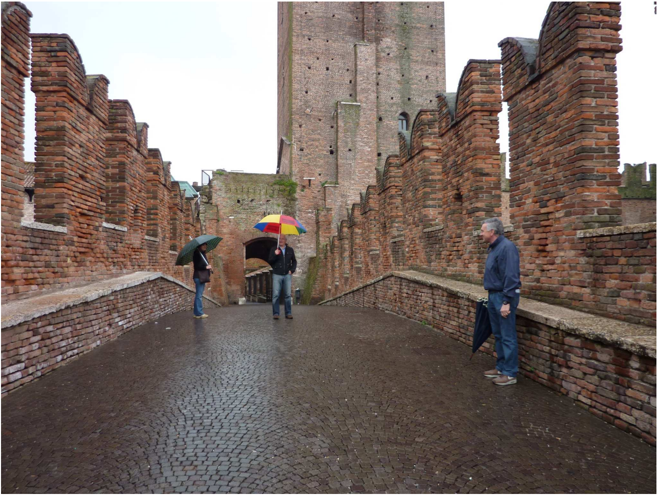
Domenica 2 maggio 2010 Verona – Ponte Scaligero