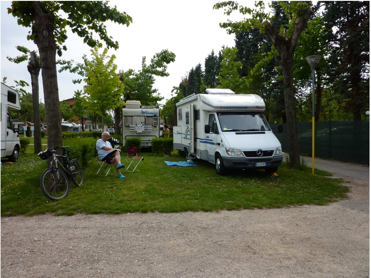
Sabato 1° maggio 2010 – Peschiera del Garda – un momento di relax al camping Cappuccini.