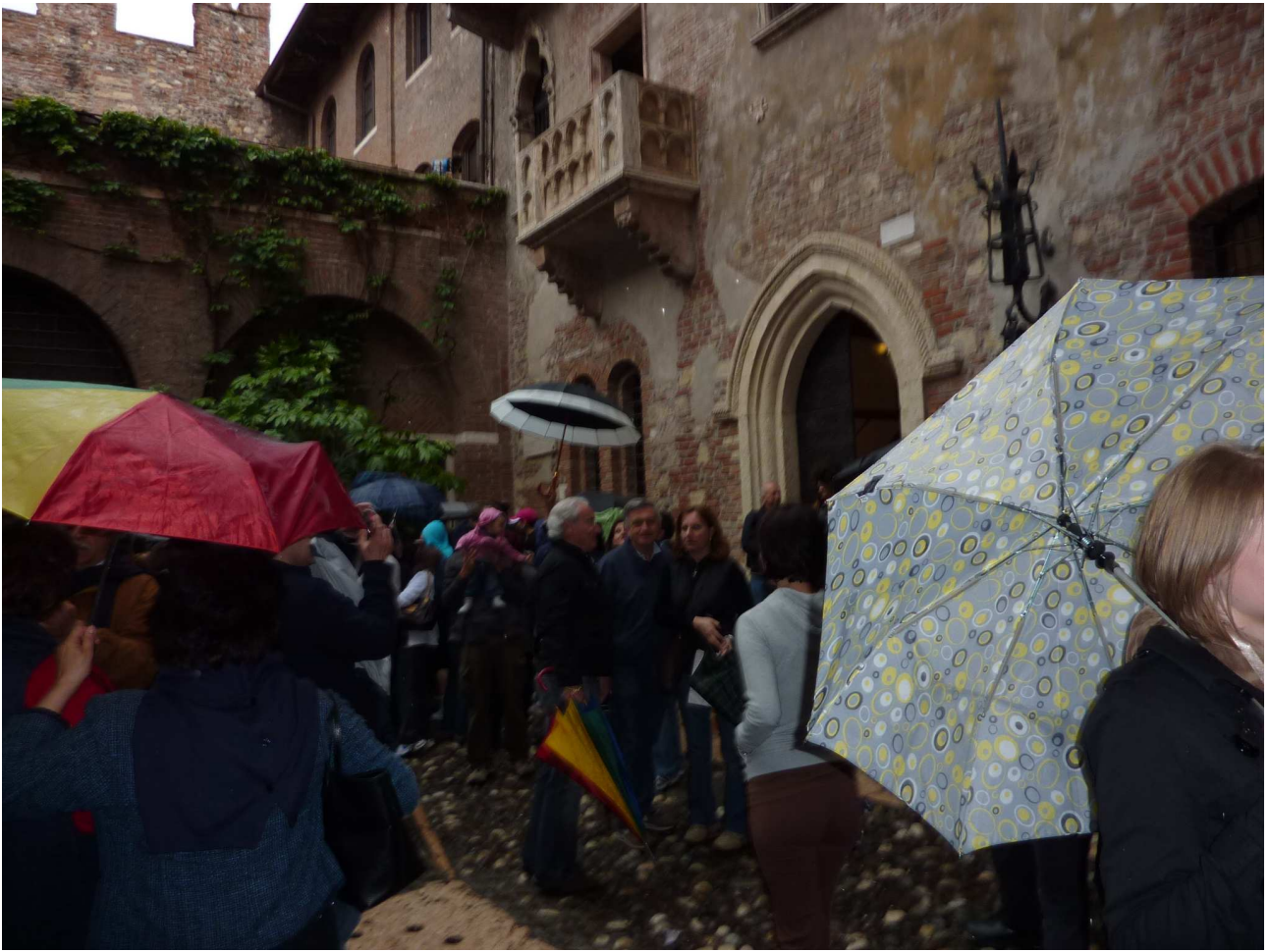
Domenica 2 maggio 2010 Verona – Balcone di Giulietta