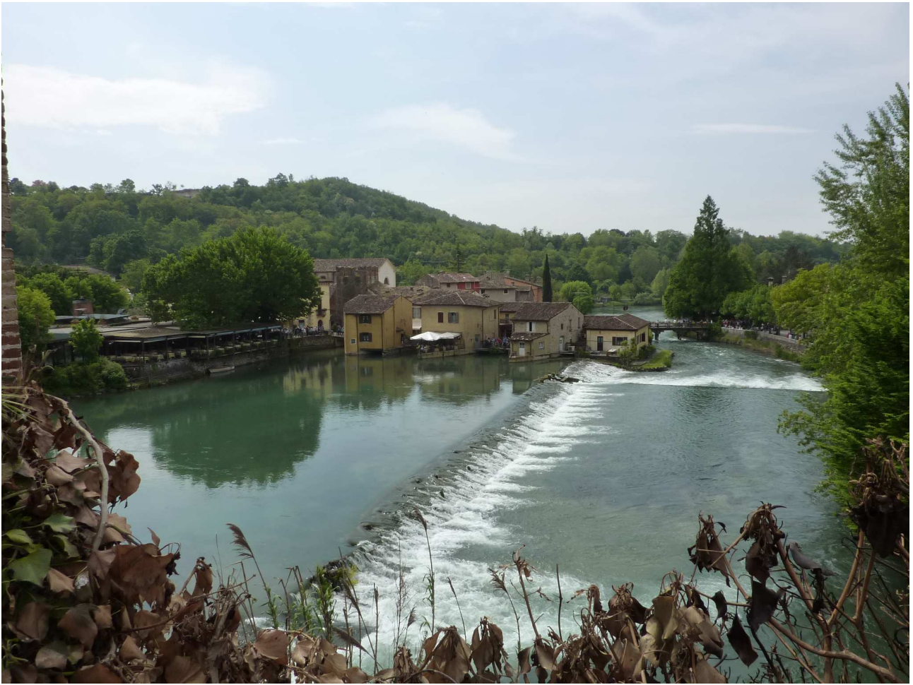
Sabato 1° maggio 2010 Borghetto di Valeggio sul Mincio visto dal ponte Visconteo.