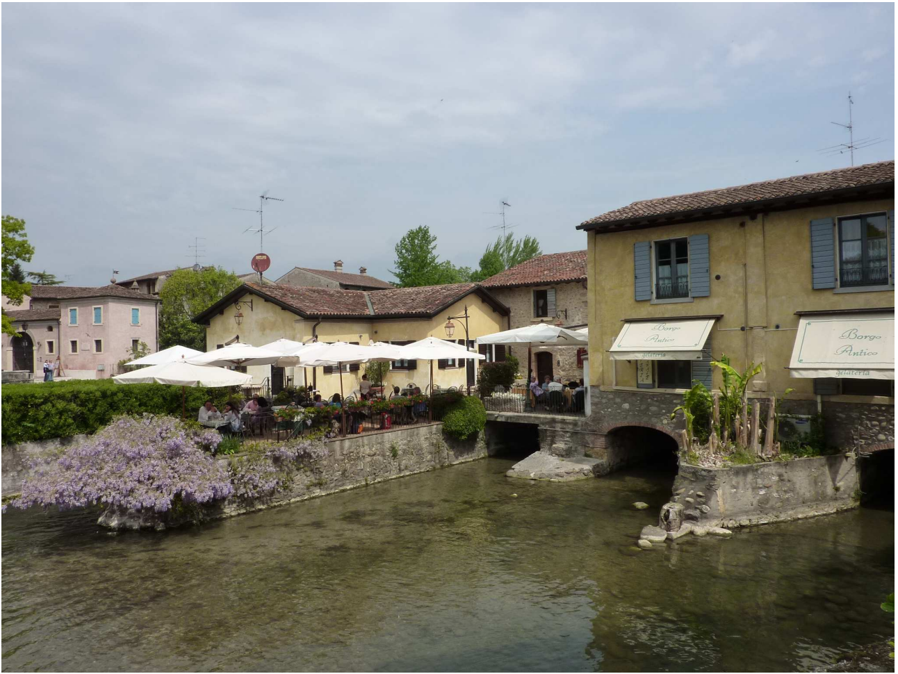
Sabato 1° maggio 2010 – Borghetto di Valeggio sul Mincio.