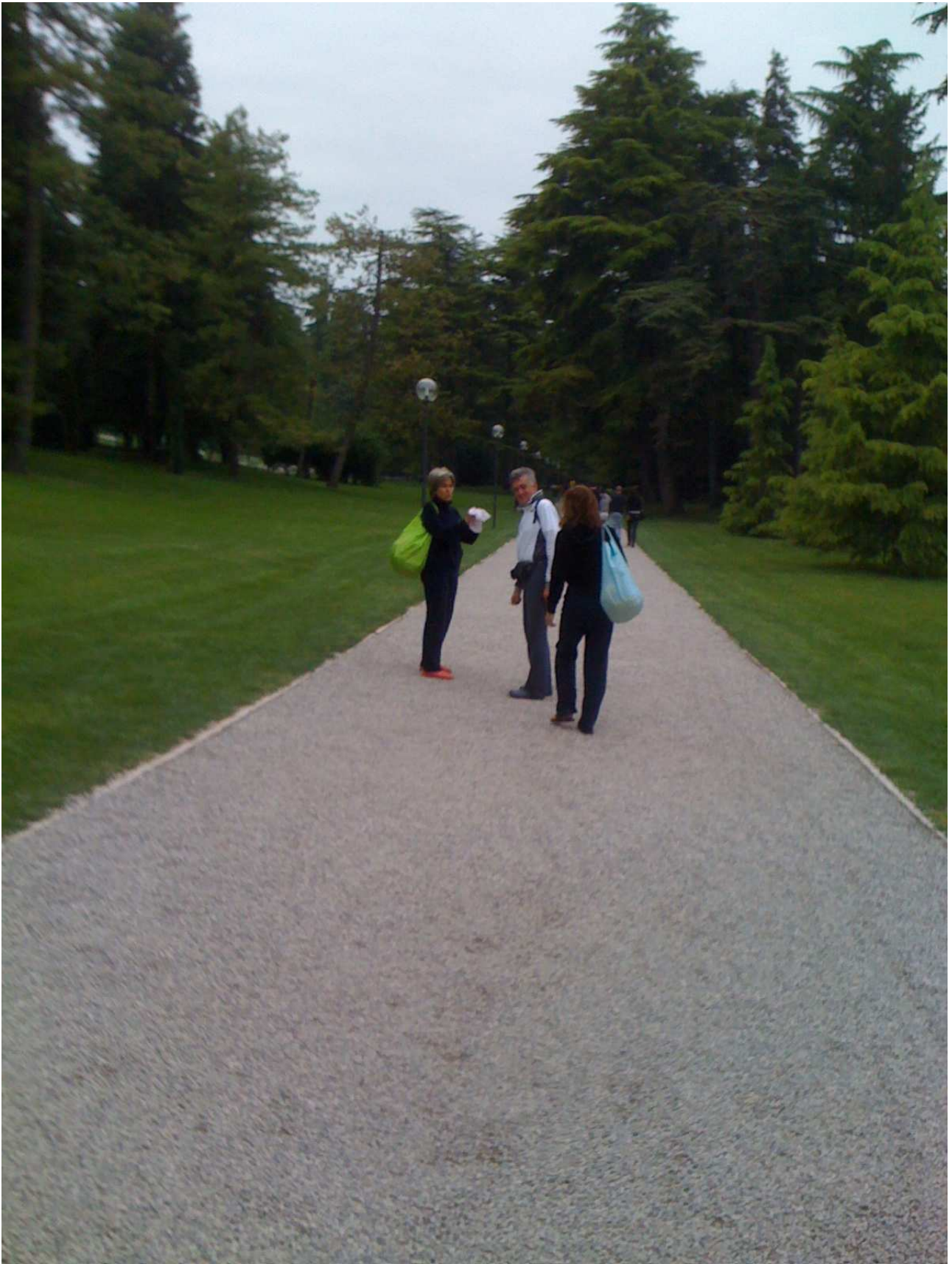
Domenica 2 maggio 2010 Parco termale di Colà