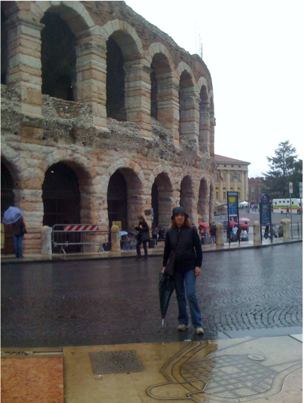
Domenica 2 maggio 2010 Verona – L’Arena ..... l’antico.