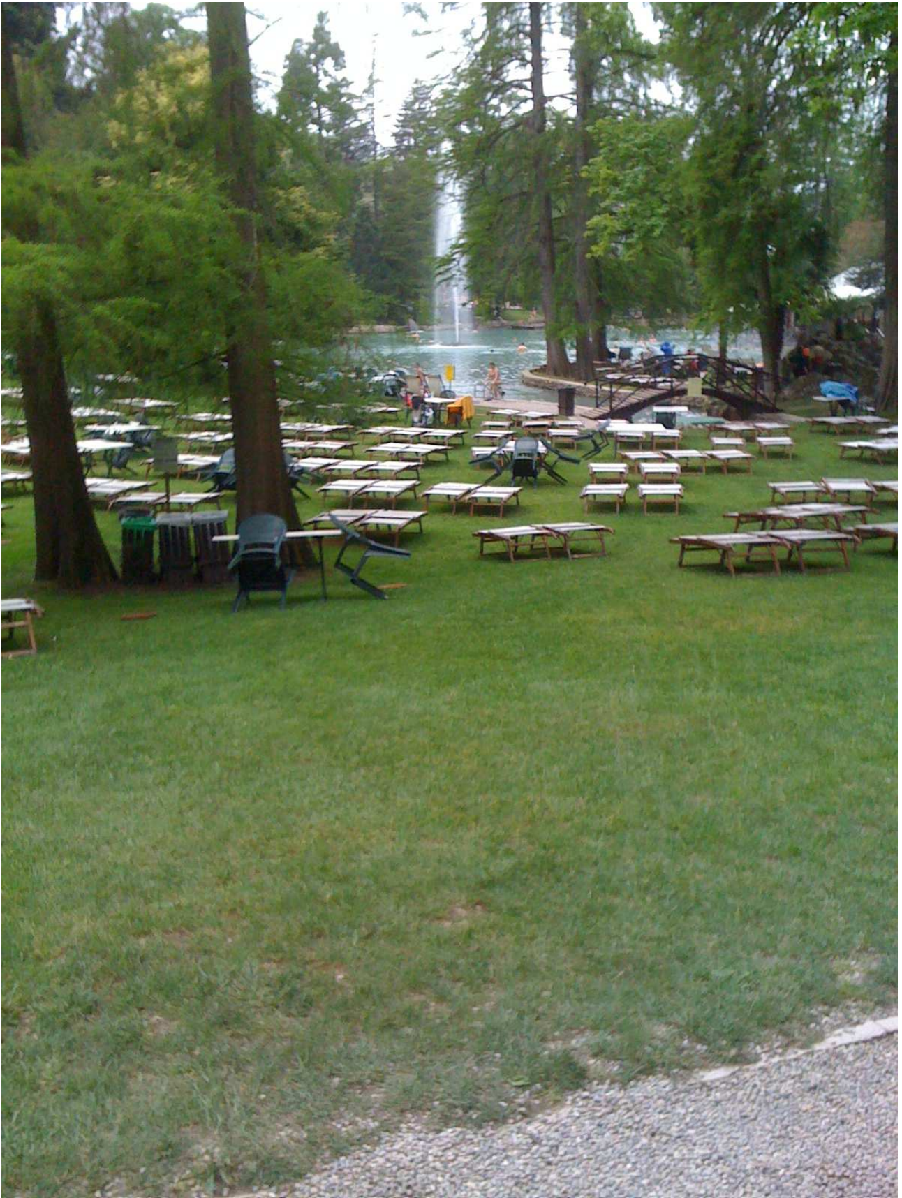
Domenica 2 maggio 2010 Parco termale di Colà