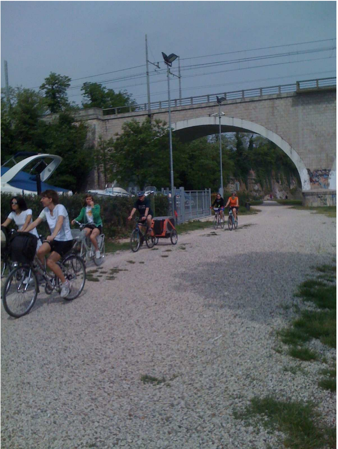
Sabato 1° maggio 2010 – Peschiera del Garda ..... Quasi sulla pista ciclabile