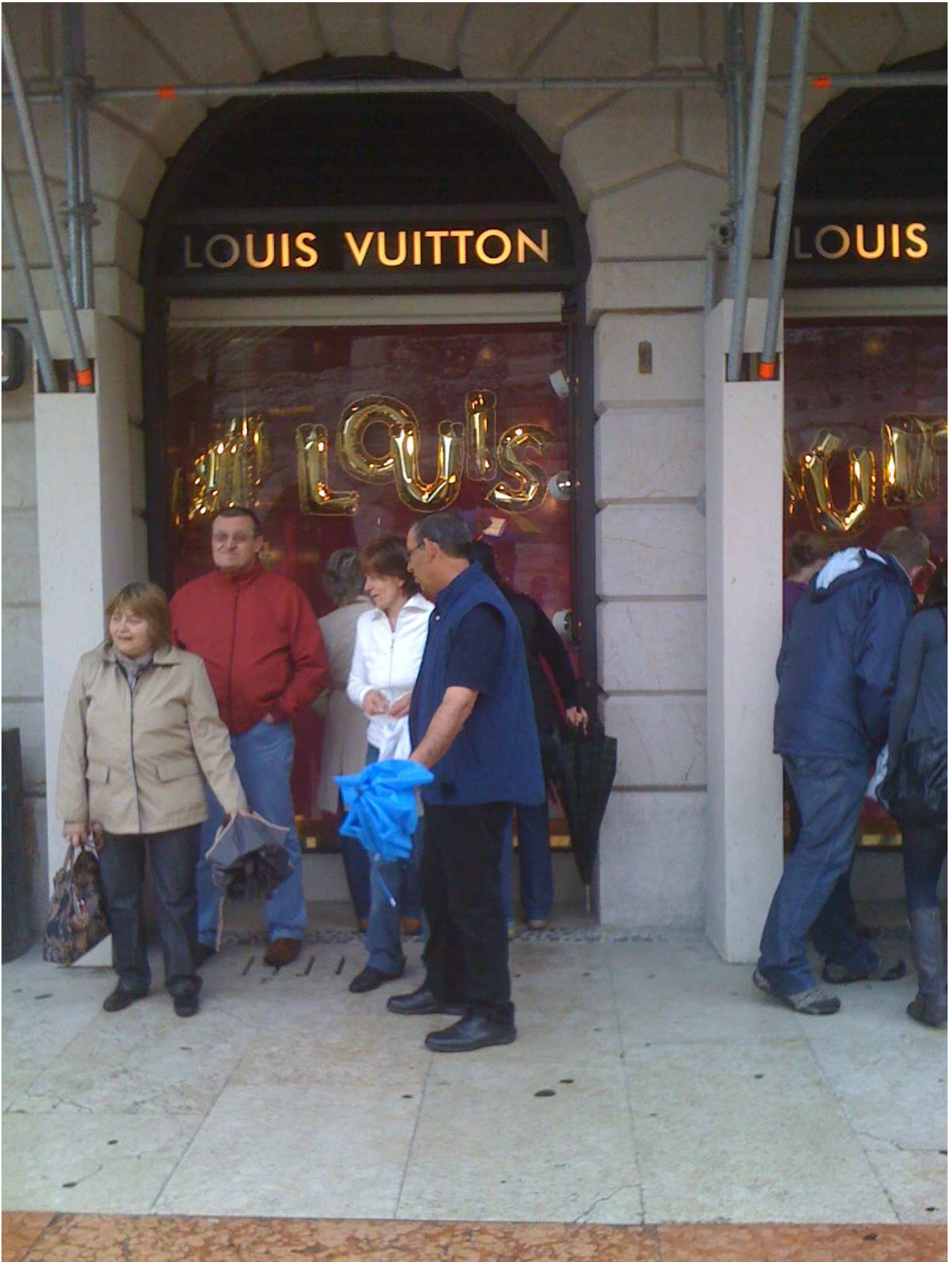
Domenica 2 maggio 2010 Verona ..... il moderno.