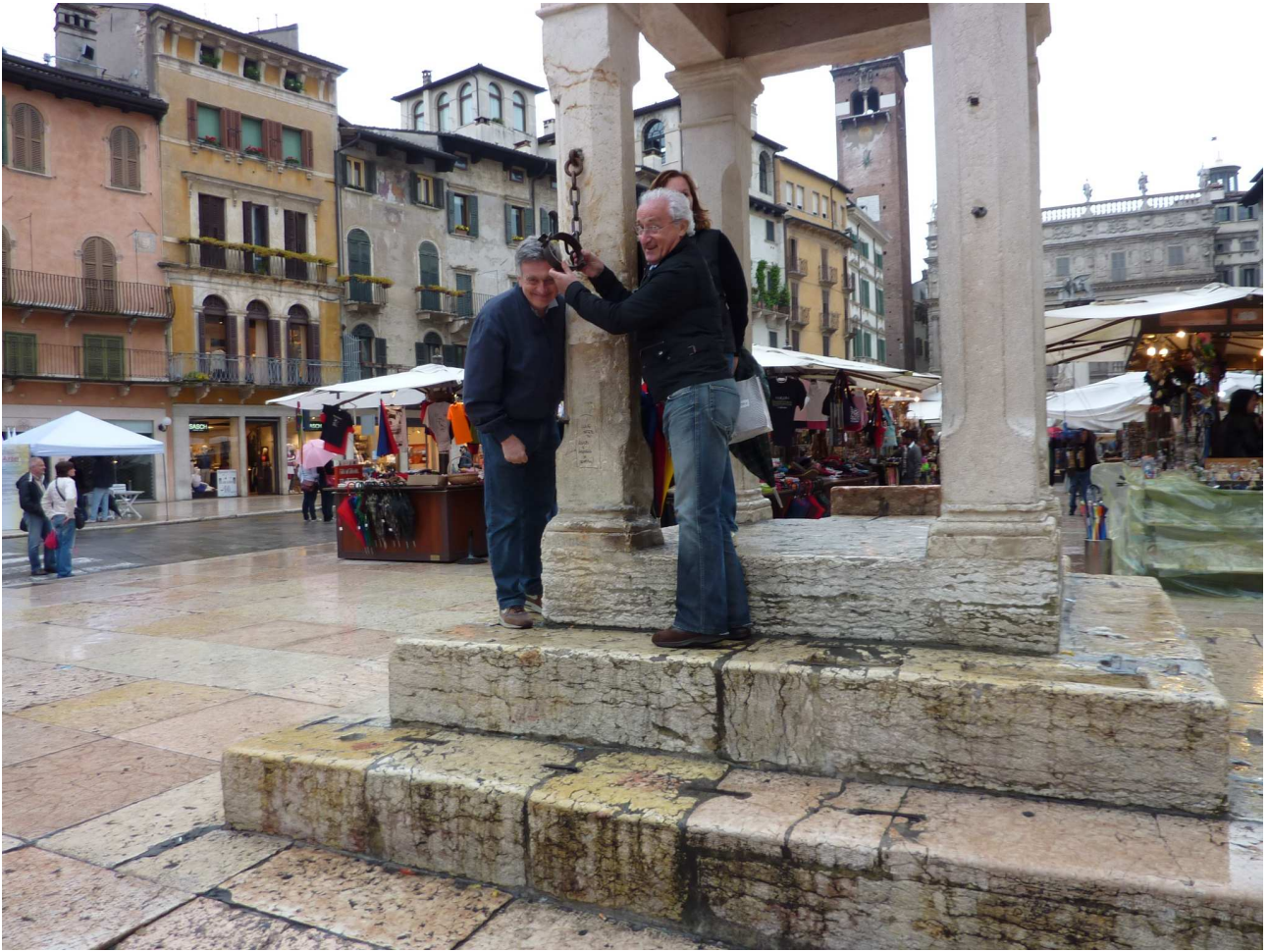
Domenica 2 maggio 2010 Verona – Piazza delle Erbe

Che dire ..... il week-end è stato breve, ma intenso. Ci siamo divertiti come sempre, perché quello che conta, è il piacere di stare insieme, non importa dove, anche se il dove questa volta è stato di rara bellezza. E poi, in barba a tutte le catastrofiche previsioni metereologiche, il tempo ci è stato più amico che nemico.