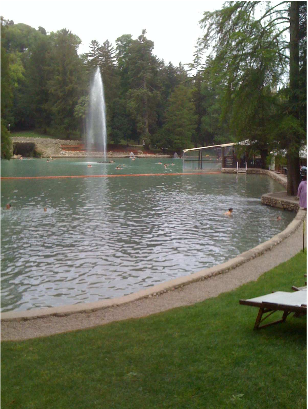
Domenica 2 maggio 2010 Laghetto con acqua 37-39 gradi nel parco termale di Colà