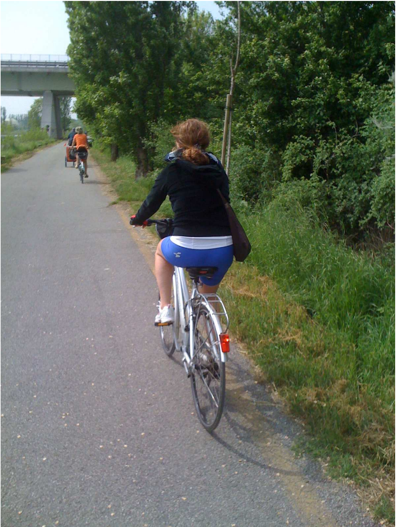
Sabato 1° maggio – Peschiera del Garda ..... sulla pista ciclabile