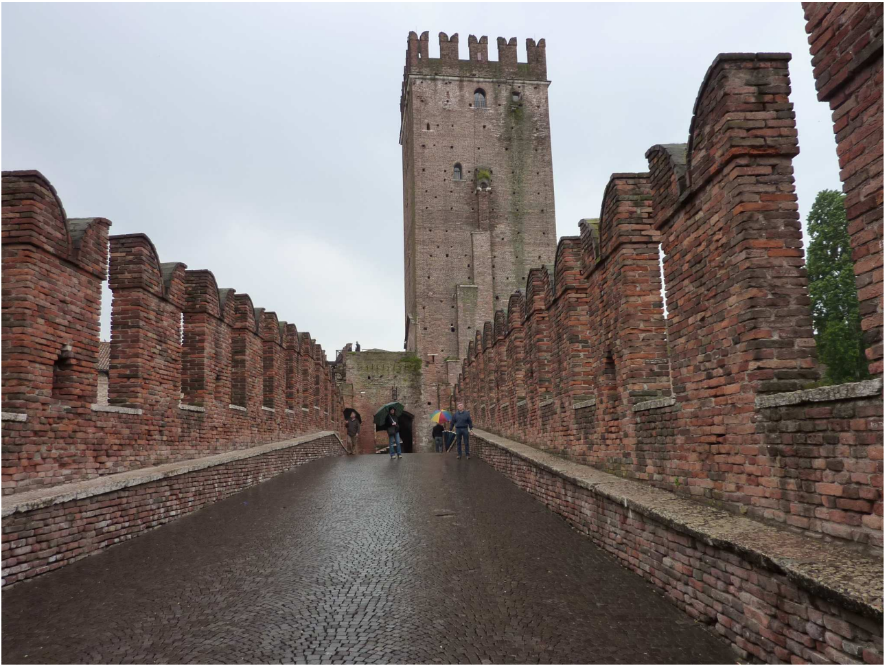
Domenica 2 maggio 2010 Verona – Ponte Scaligero