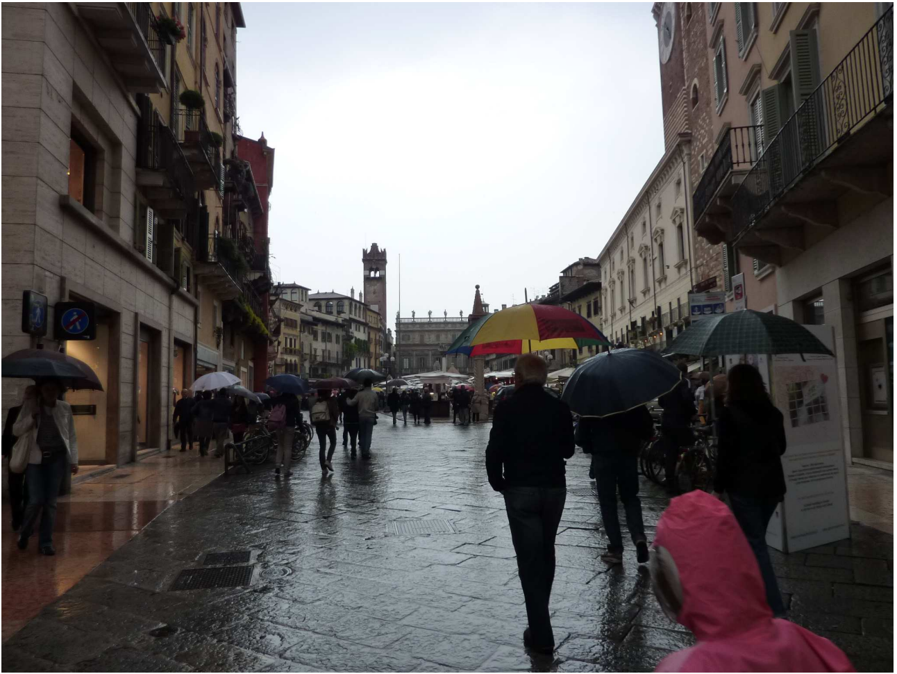
Domenica 2 maggio 2010 Verona – Verso Piazza delle Erbe