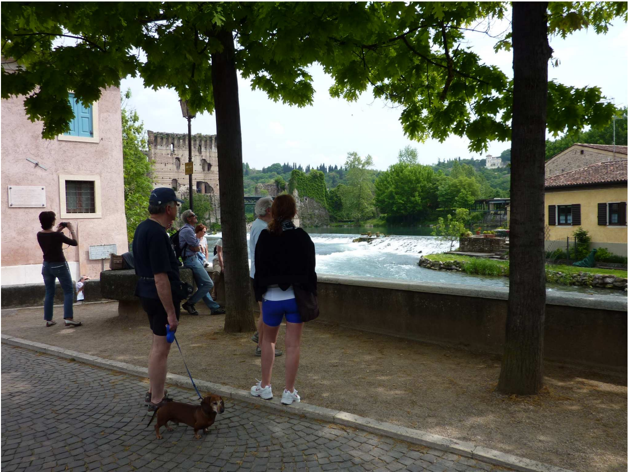
Sabato 1° maggio 2010 – a zonzo per le vie di Borghetto di Valeggio sul Mincio