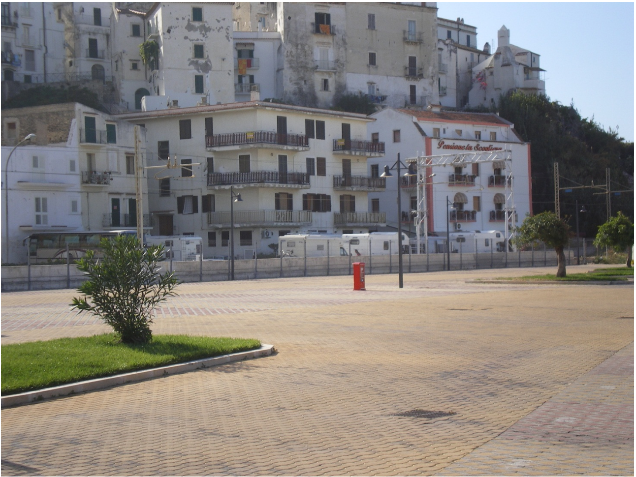
Sabato 1 ottobre Con i camper infilati in un vicolo cieco di Rodi Garganico