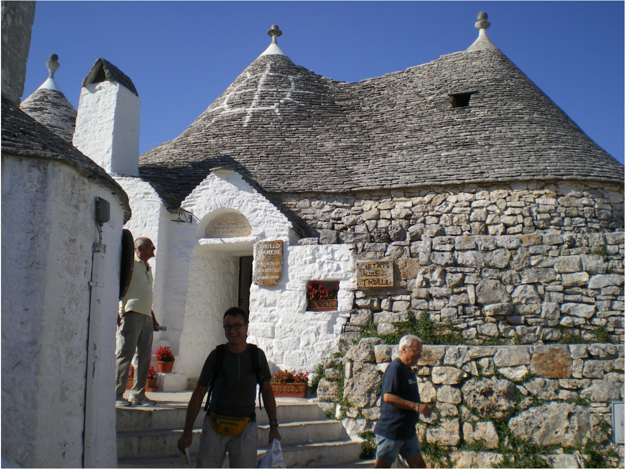
Martedì 4 ottobre ..... a spasso per le vie di Alberobello