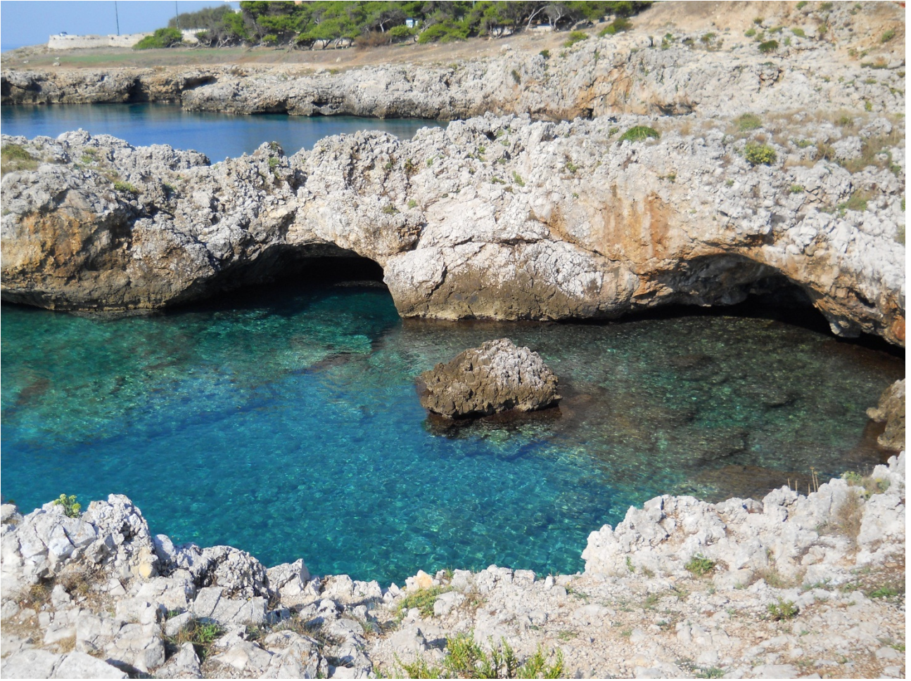
Giovedì 6 ottobre Lo splendore del Salento