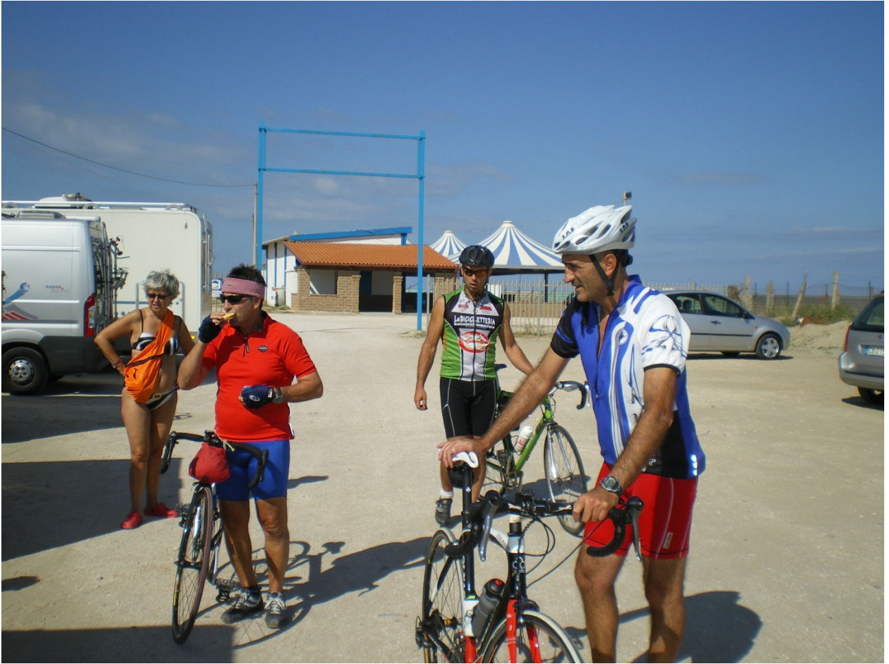
Sabato 1 ottobre Lesina ..... quasi pronti