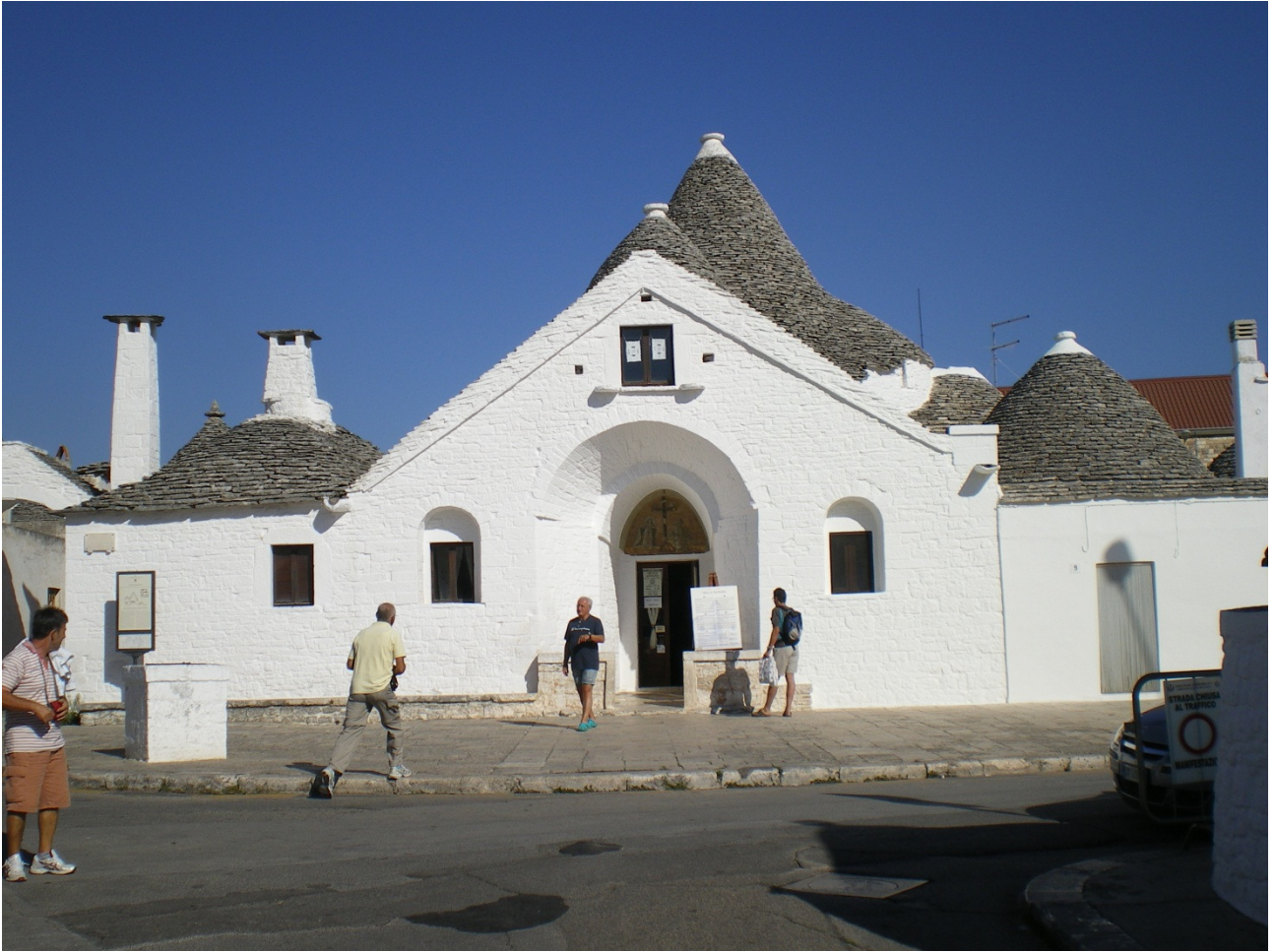
Martedì 4 ottobre A zozzo per le strade di Alberobello