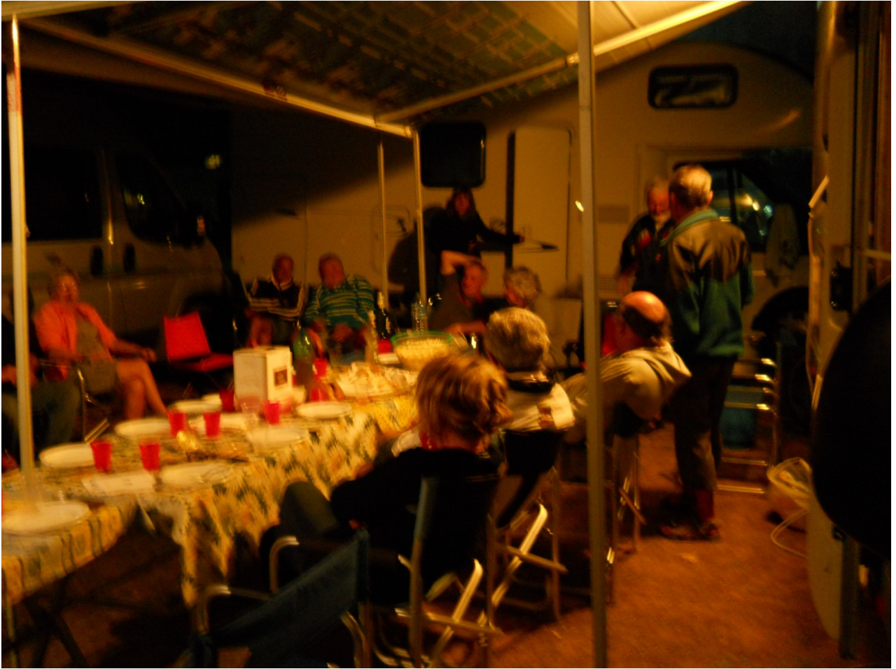
Giovedì 6 ottobre Cena conviviale nel campeggio "La Masseria" di Gallipoli