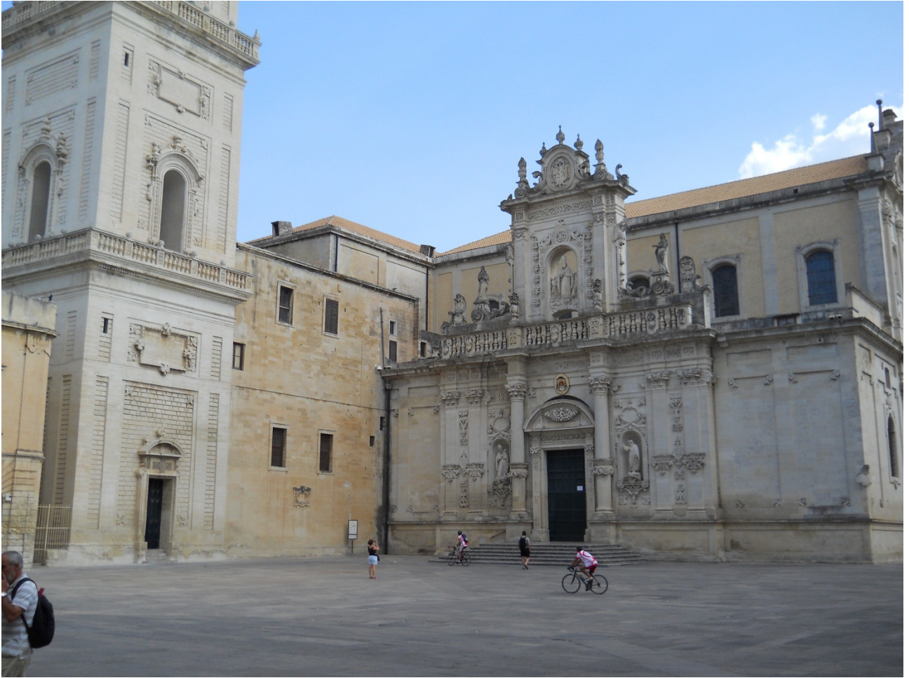
Mercoledì 5 ottobre Lecce