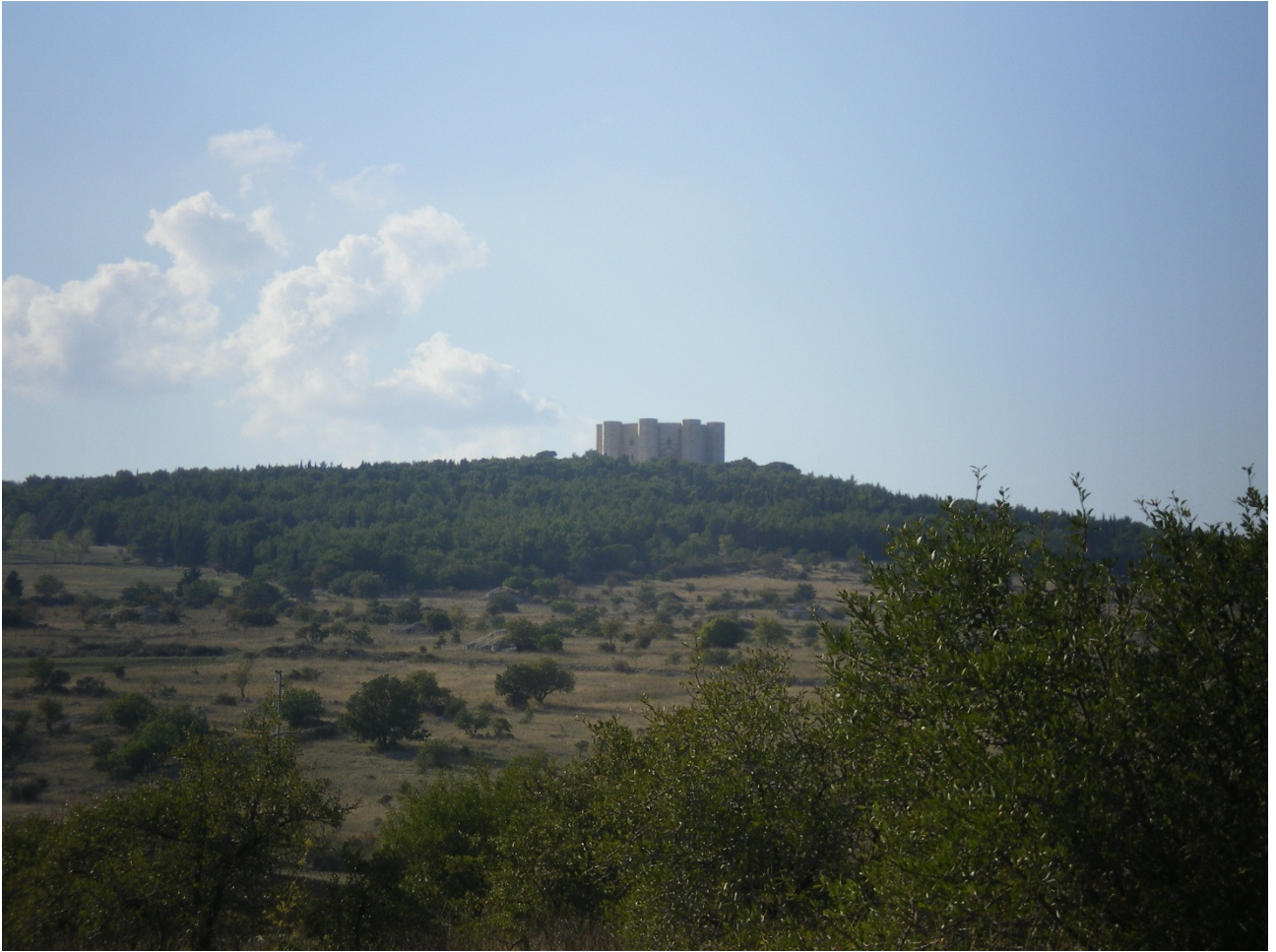
Lunedì 3 ottobre Castel del Monte visto pedalando sulla strada che in continua salita ci porterà lì.