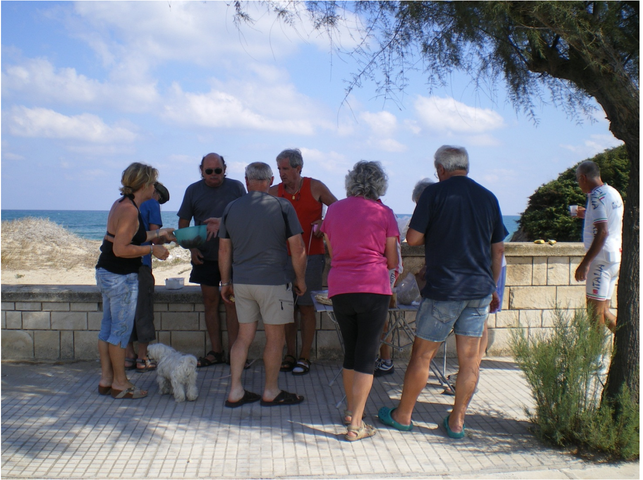
Martedì 4 ottobre .... pranzo più che frugale sul lungomare di Torre di San Gennaro