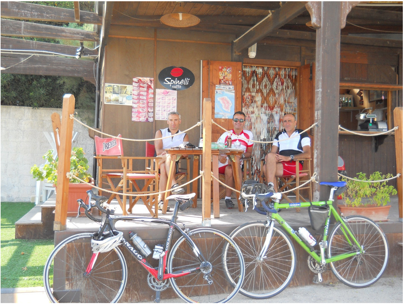
Mercoledì 5 ottobre .... i nostro eroi in un bar a santa Maria di Leuca