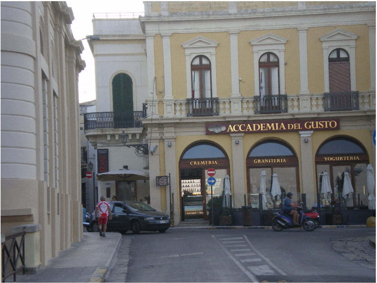
Giovedì 6 ottobre A spasso per le vie di Gallipoli