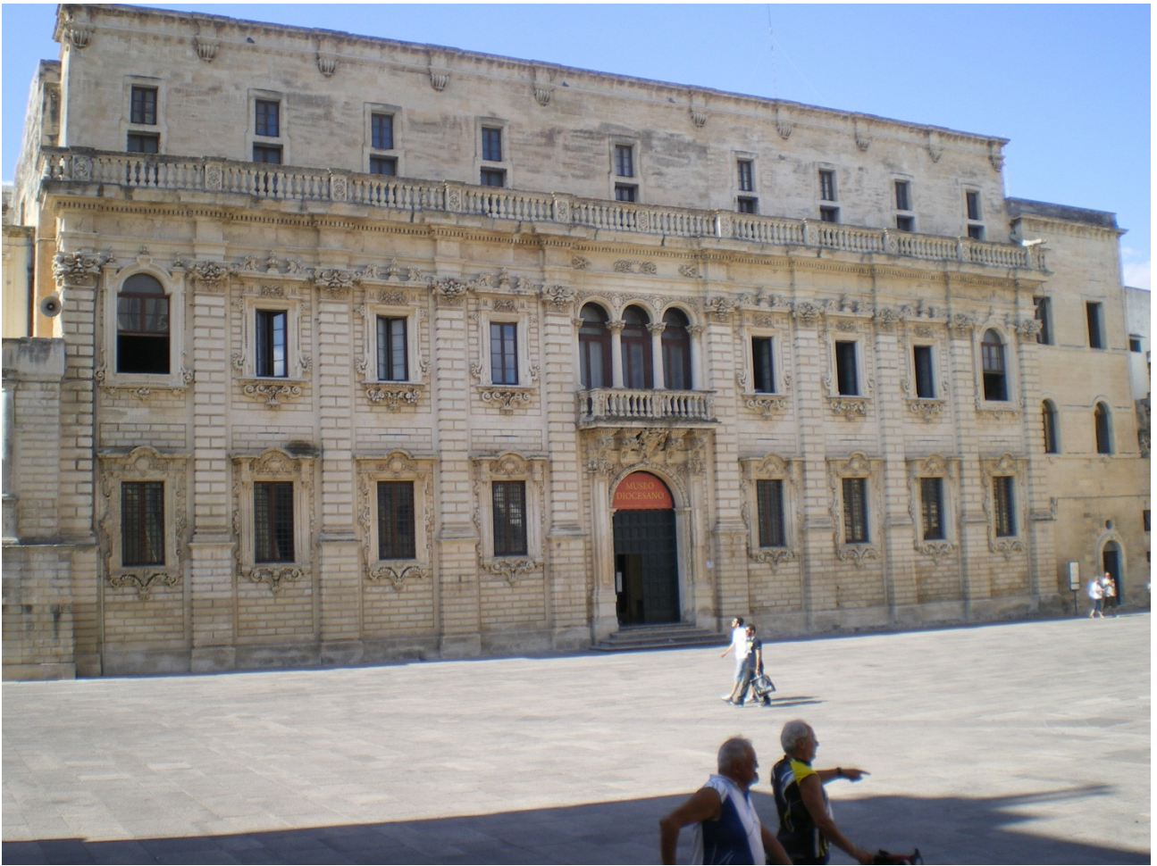
Mercoledì 5 ottobre Lecce