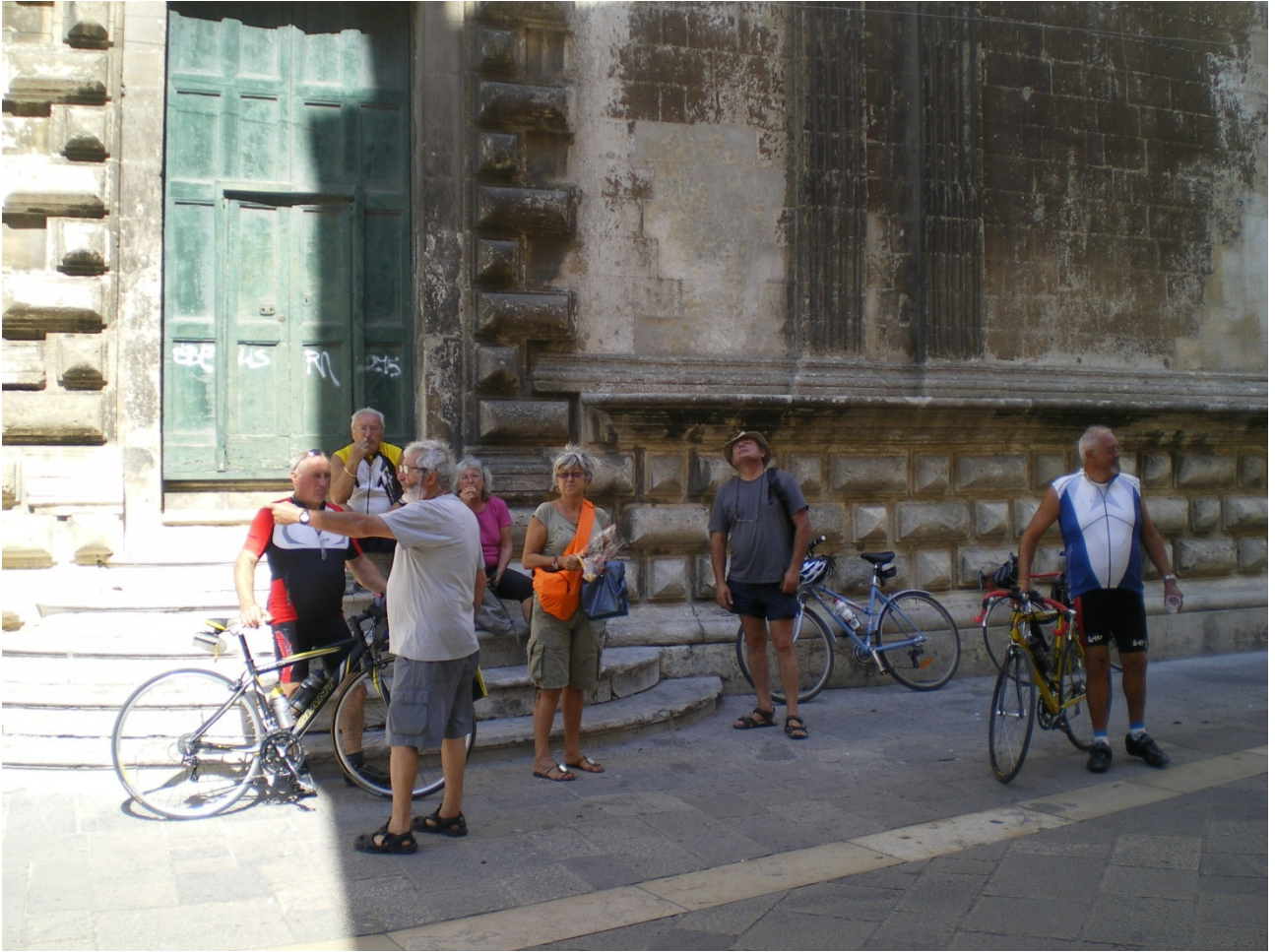
Mercoledì 5 ottobre Lecce