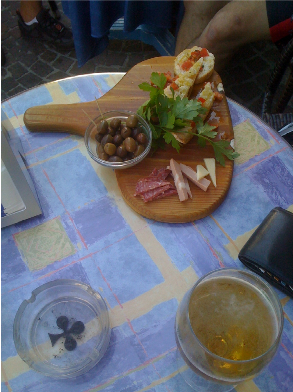
Domenica 2 ottobre di ritorno a Peschici stanchi ed accaldati ordiniamo una birra gelata ..... ecco come ce l'hanno servita