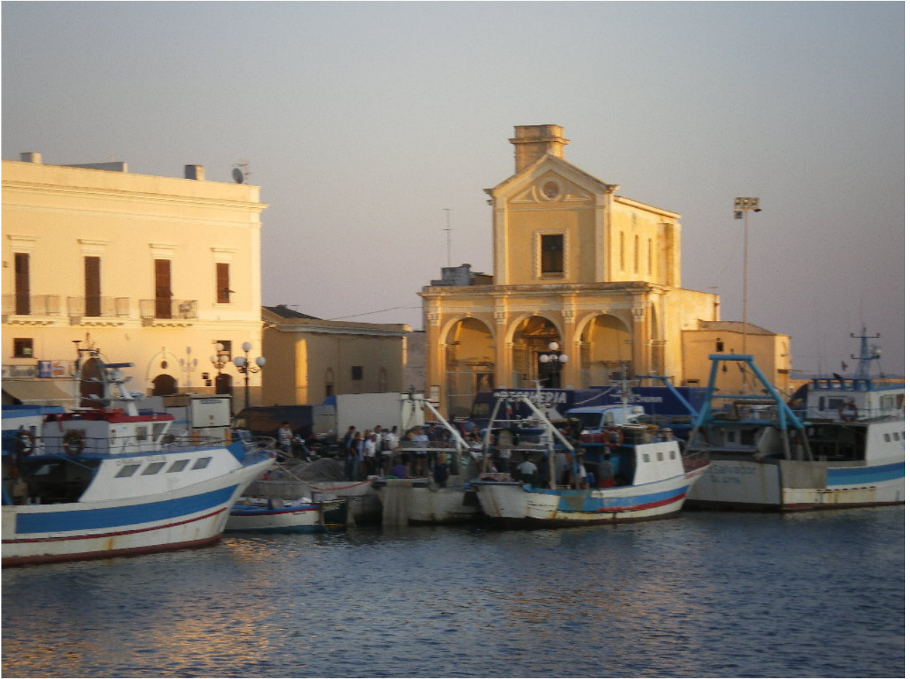
Giovedì 6 ottobre Gallipoli