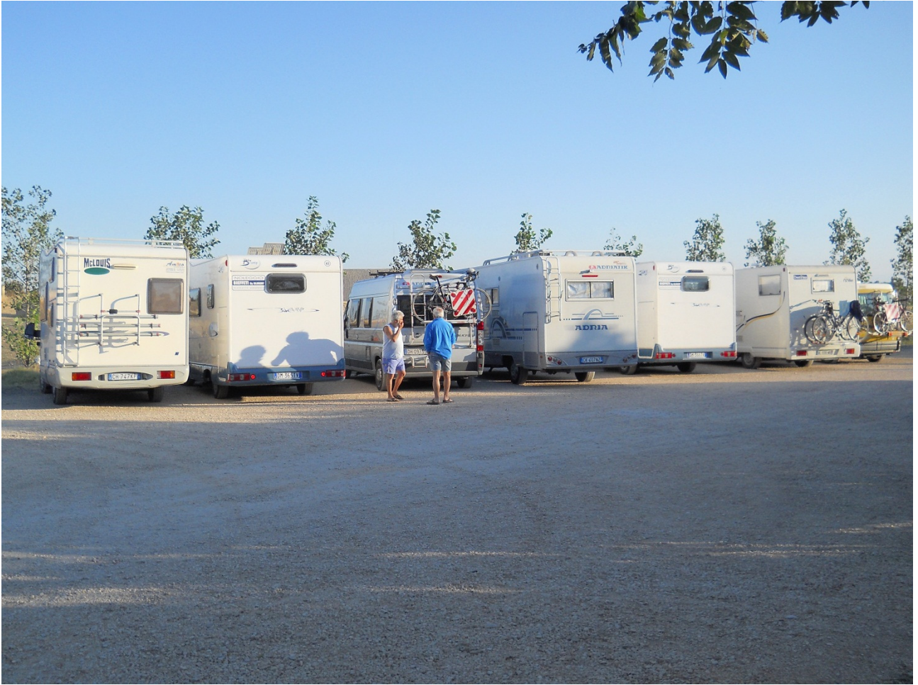
Lunedì 3 ottobre Camper parcheggiati nel cortile di un agriturismo a Troia dove abbiamo cenato la sera/notte prima