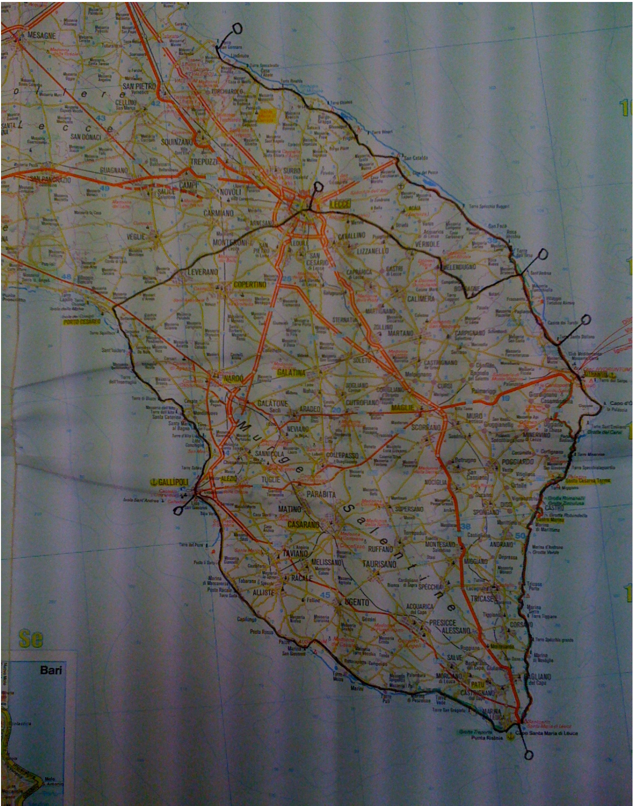
Figura 3 Sulle strade del Salento (in nero quelle percorse in bicicletta)

Martedì 4 ottobre Torre San Gennaro – Otranto km 63 facili per tutti