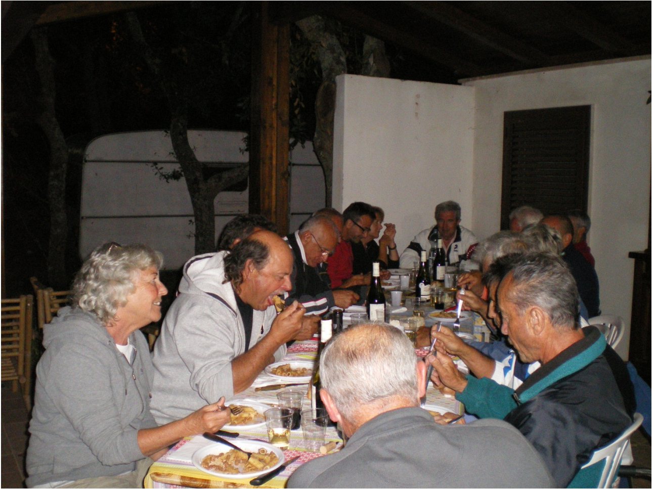
Lunedì 3 ottobre Cena conviviale nel campeggio di Alberobello