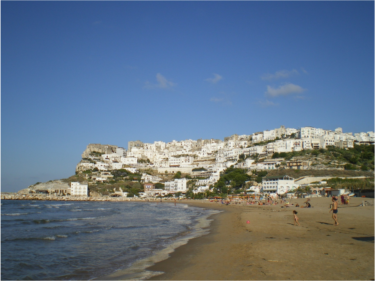
Sabato 1 ottobre eccoci sulla spiaggia di Peschici