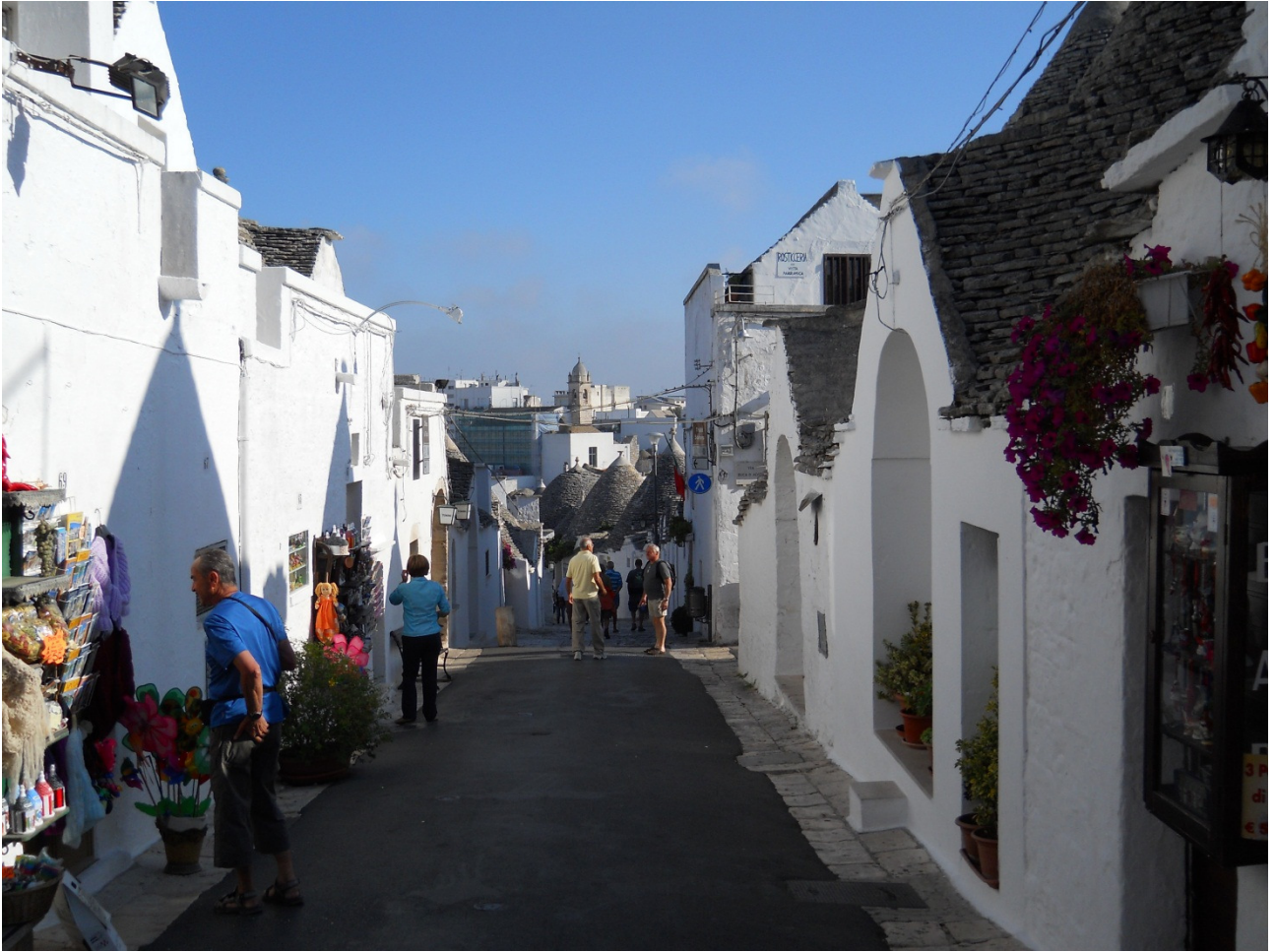
Martedì 4 ottobre A zozzo per le strade di Alberobello