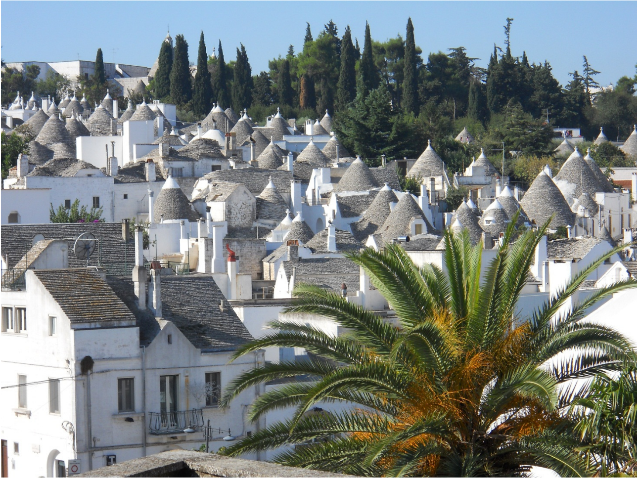
Martedì 4 ottobre ..... veduta panoramica di Alberobello