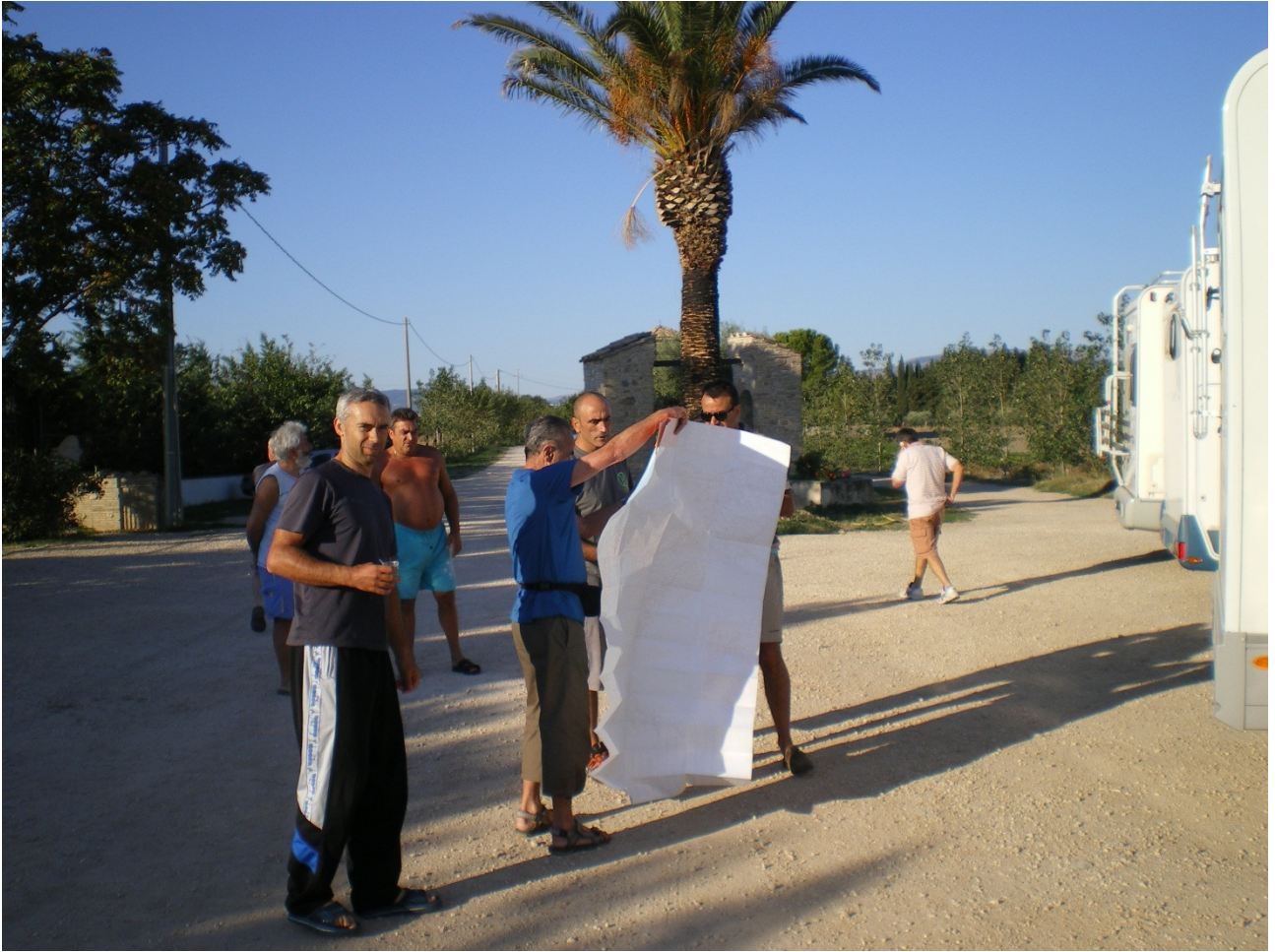
Lunedì 3 ottobre Nel parcheggio dell'agriturismo si consultano le carte per decidere il percorso della giornata