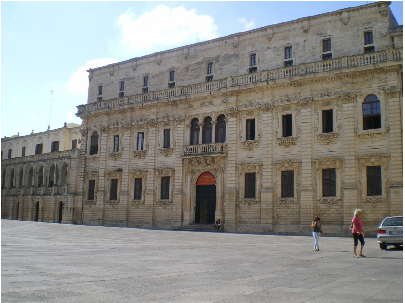
Mercoledì 5 ottobre Lecce