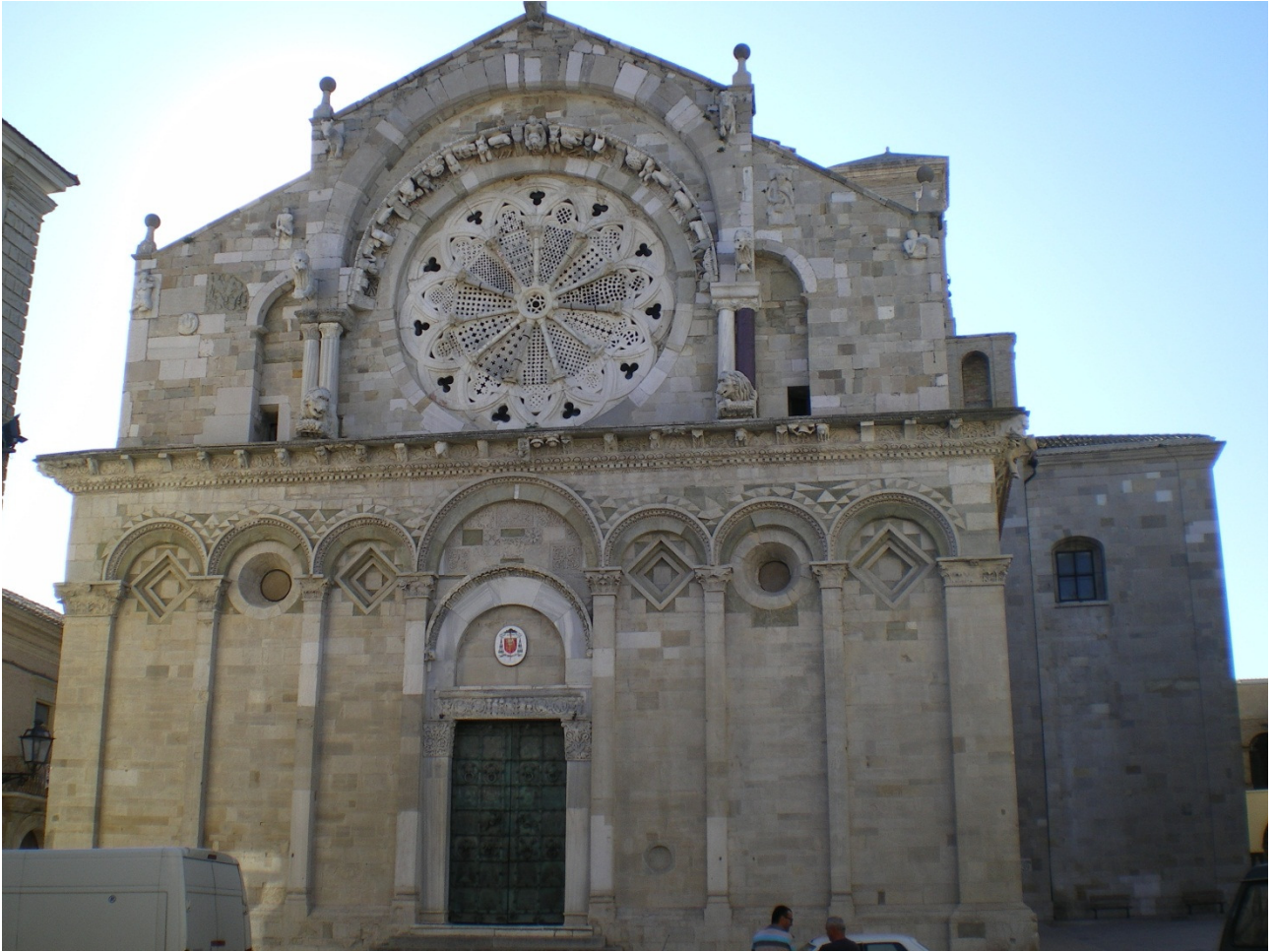
Lunedì 3 ottobre La splendida cattedrale di Troia