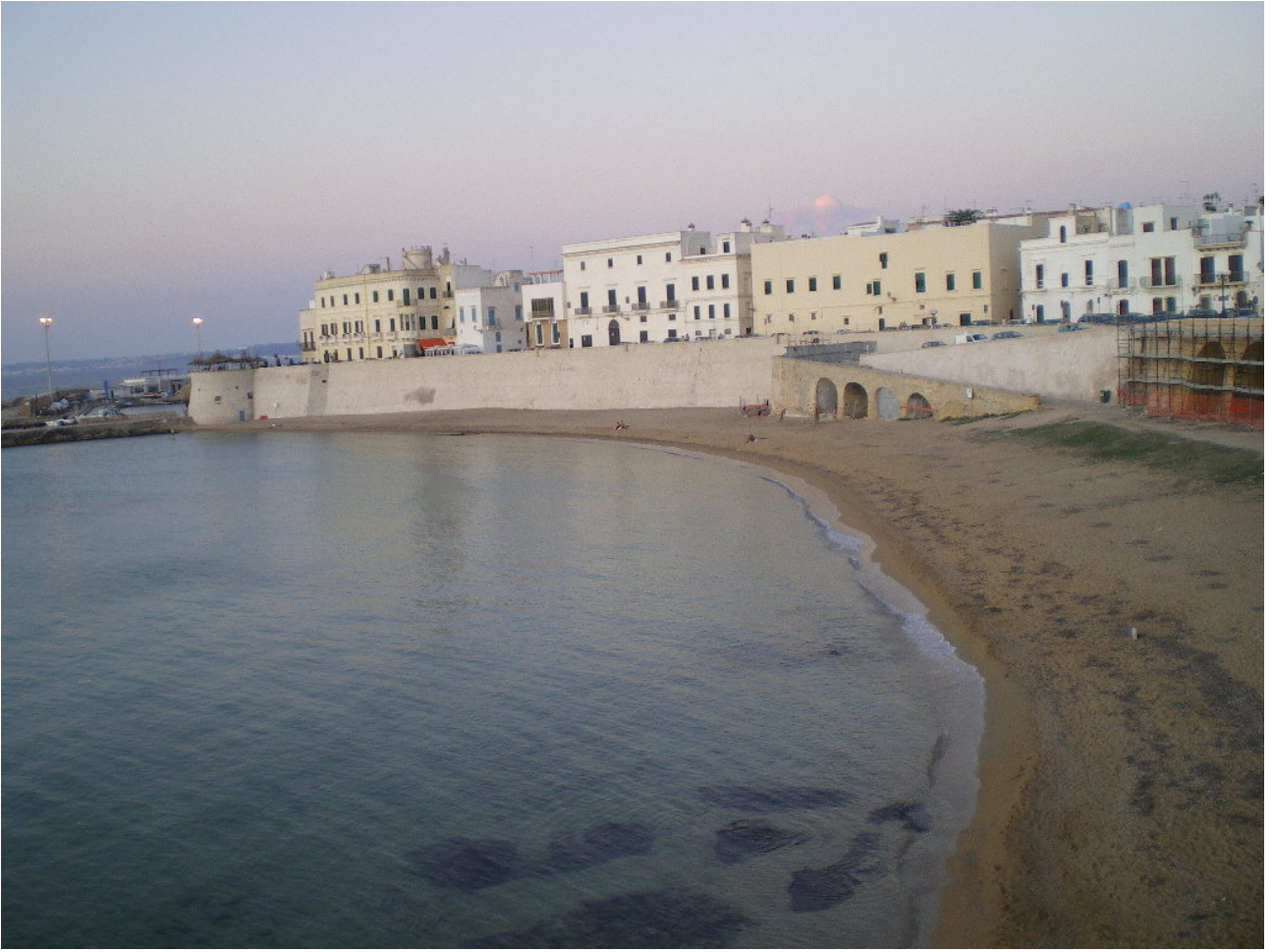
9Giovedì 6 ottobre Gallipoli