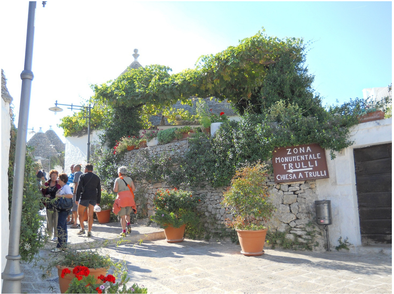
Martedì 4 ottobre ..... a spasso per le vie di Alberobello