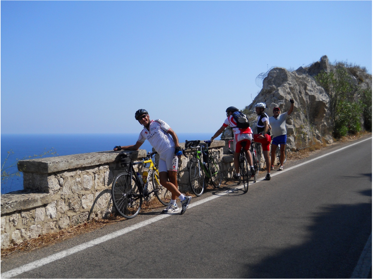
8Mercoledì 5 ottobre .... i nostri eroi sulla splendida strada Otranto - Santa Maria di Leuca