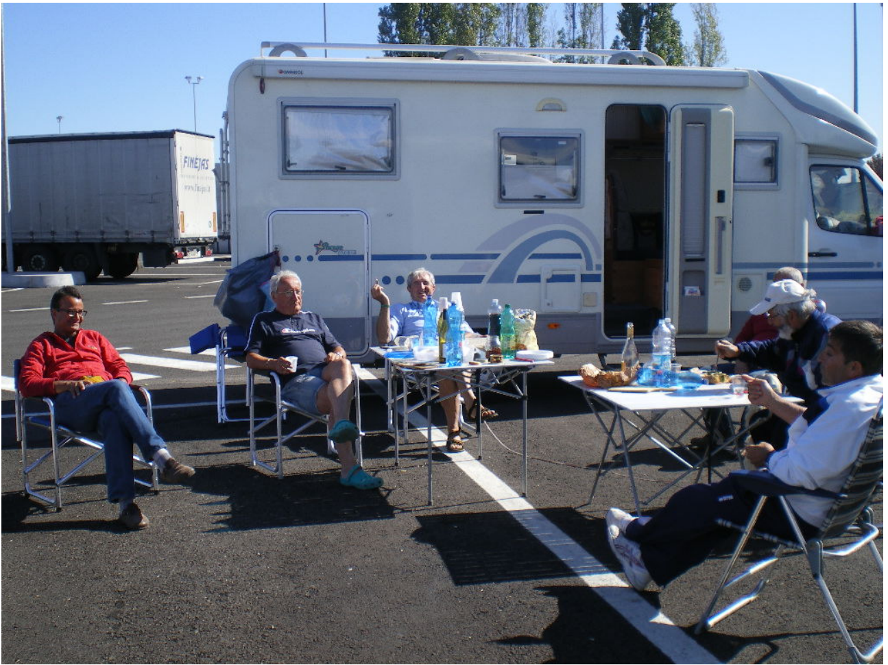
Sabato 8 ottobre Ultimo pranzo conviviale in un autogrill qualunque della A14