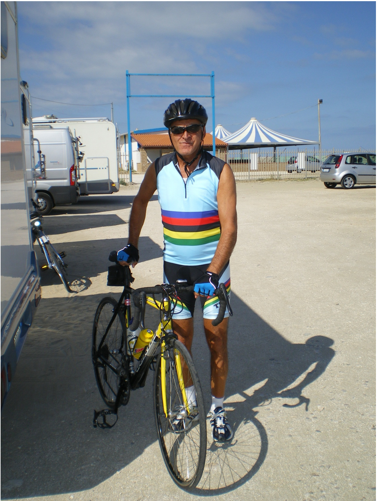
Sabato 1 ottobre ..... ovviamente c'è sempre qualche ritardatario