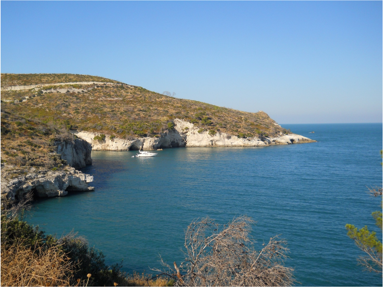
Domenica 2 ottobre Uno scorcio sulla strada da Mattinata a Vieste