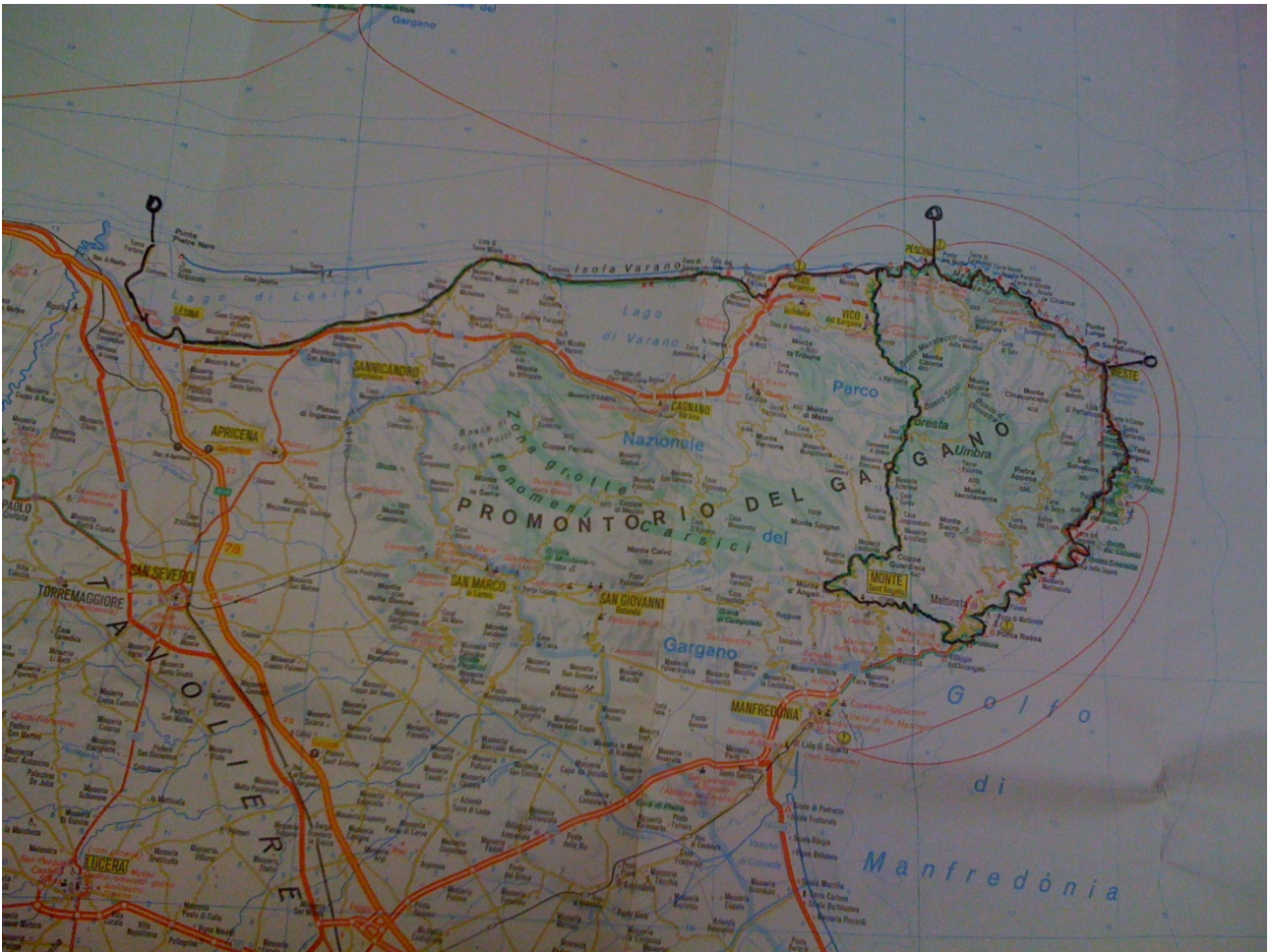
Figura 1 Sulle strade del Gargano (in nero quelle percorse in bicicletta)

Sabato 1 ottobre Lago di Lesina – Peschici 80 km circa