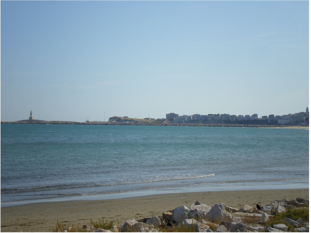
Domenica 2 ottobre Vieste davanti alle nostre bici