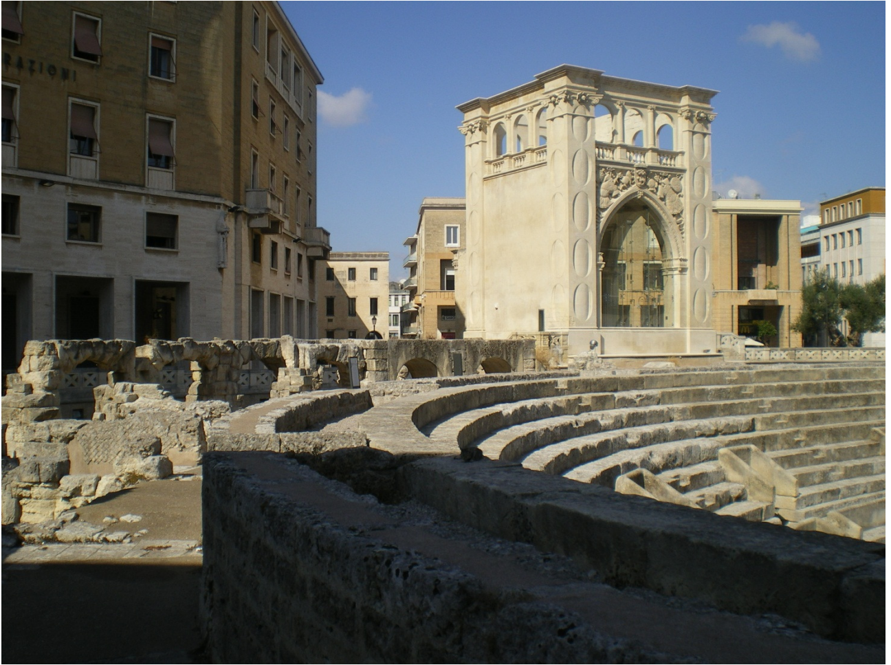
Mercoledì 5 ottobre Lecce piazza Anfiteatro