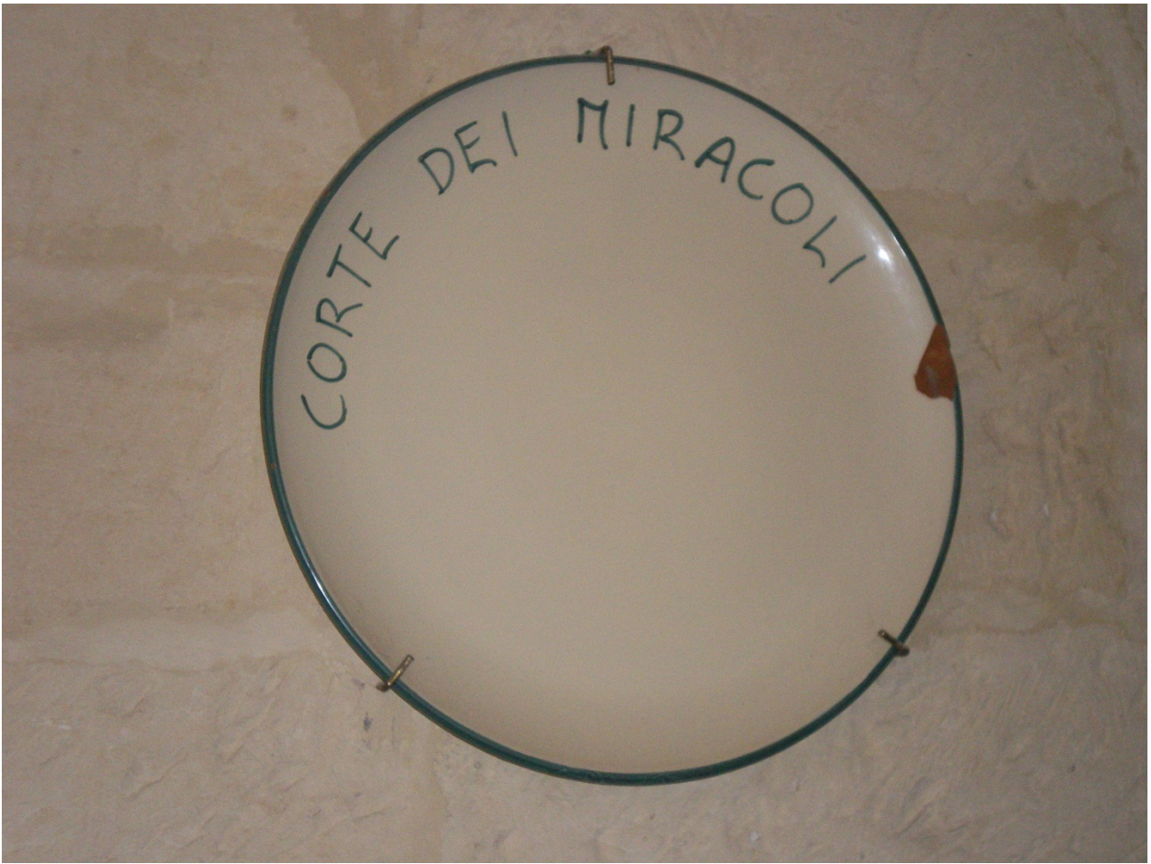
Mercoledì 5 ottobre Lecce insegna del ristorante