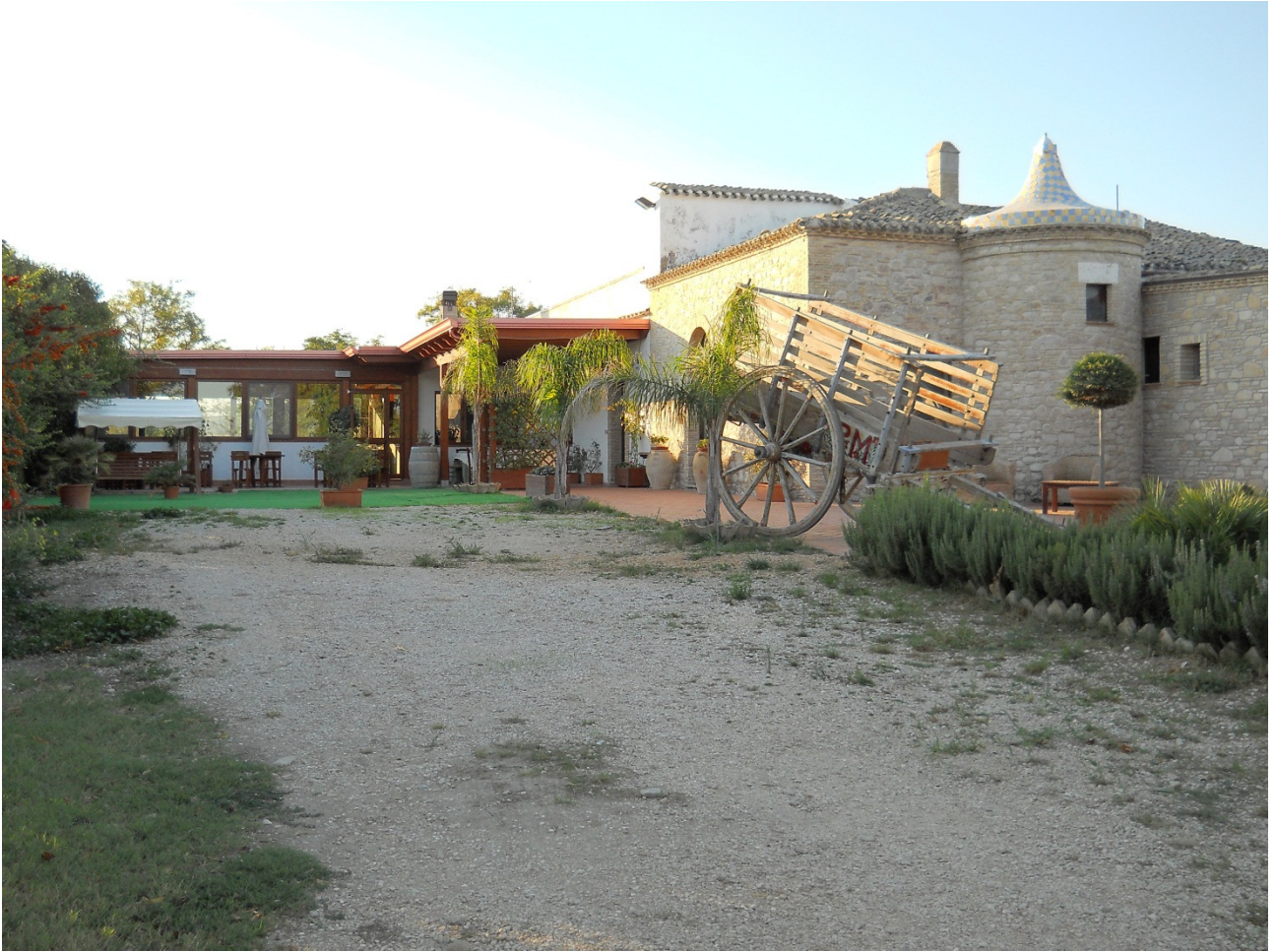
Lunedì 3 ottobre ..... e questo è l'agriturismo