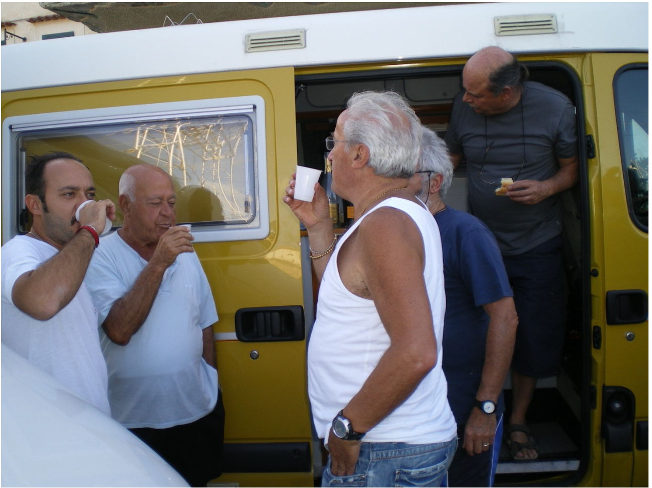
Sabato 1 ottobre ci siamo infognati in un vicolo cieco a Rodi Garganico, ma troviamo il tempo di familiarizzare con dei residenti simpatici sotto al loro balcone