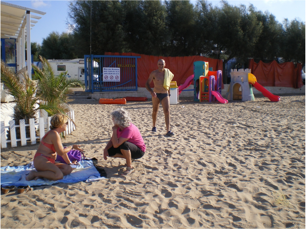
4Sabato 1 ottobre Sulla spiagge di Peschici