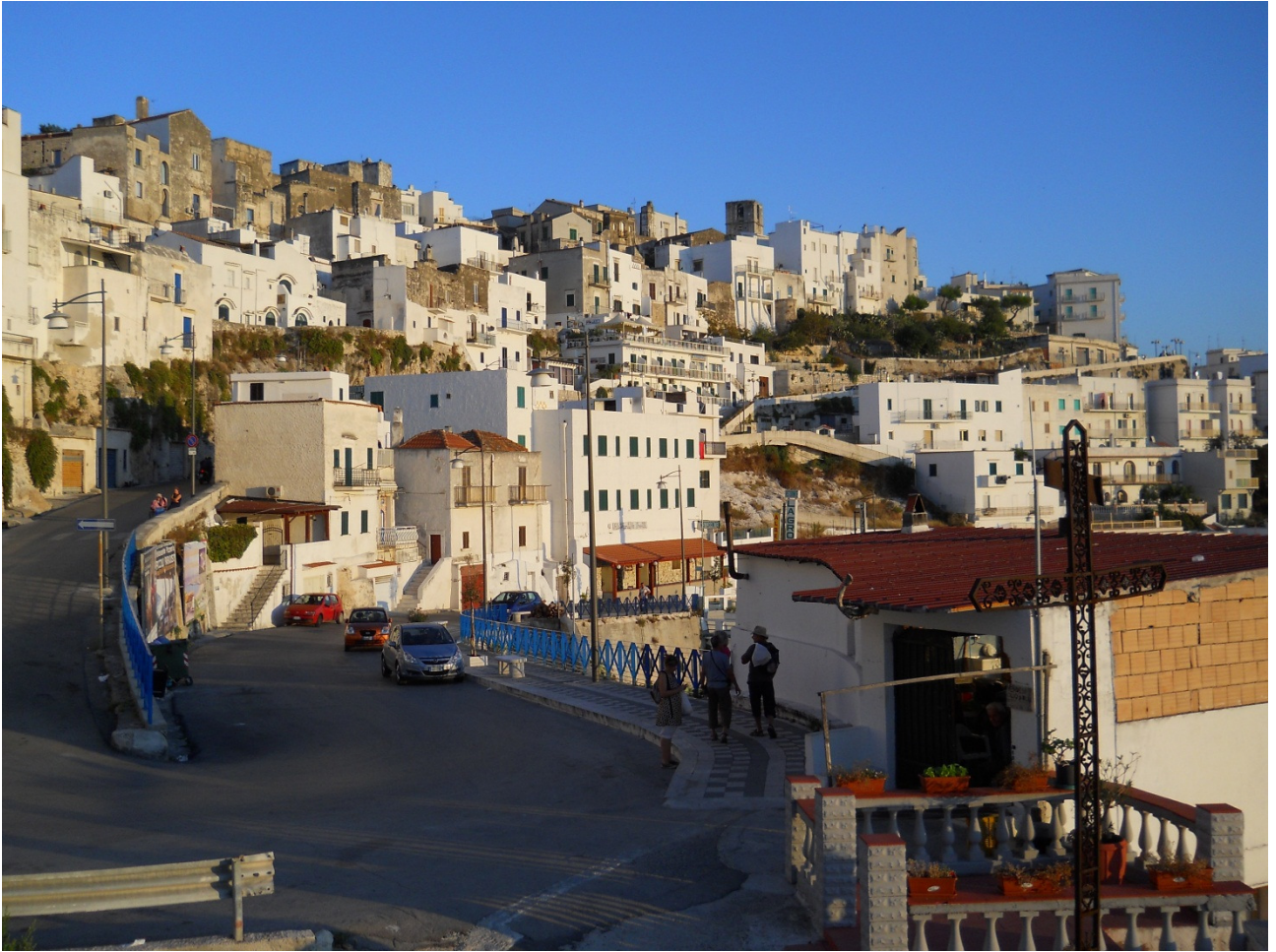
Domenica 2 ottobre .... per le strade di Peschici