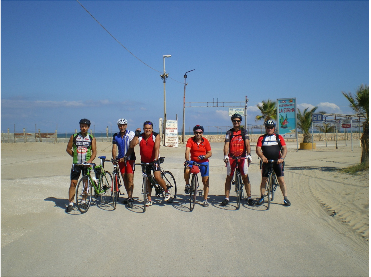
Sabato 1 ottobre Ci siamo appena ricongiunti nei pressi di Lesina e alcuni assatanati ciclisti sono già pronti per partire