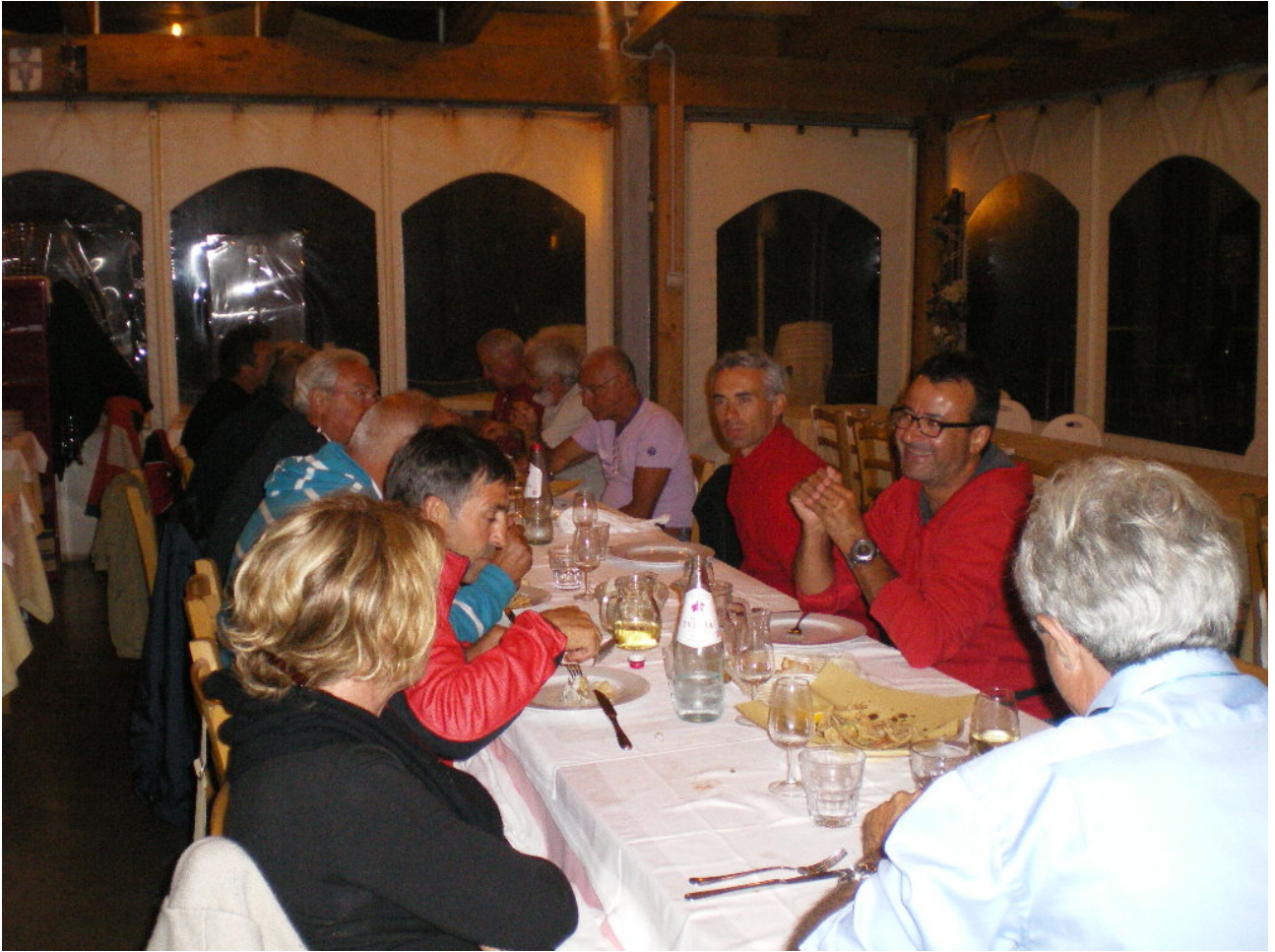
Venerdì 7 ottobre Porto S. Elpidio cena al ristorante (pesce)