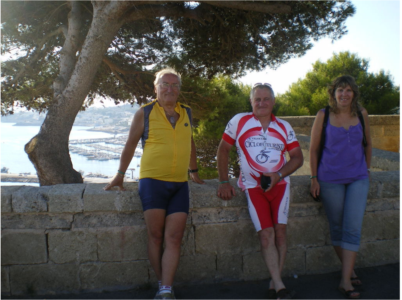
Giovedì 6 ottobre foto ricordo dal piazzale del faro di Santa Maria di Leuca