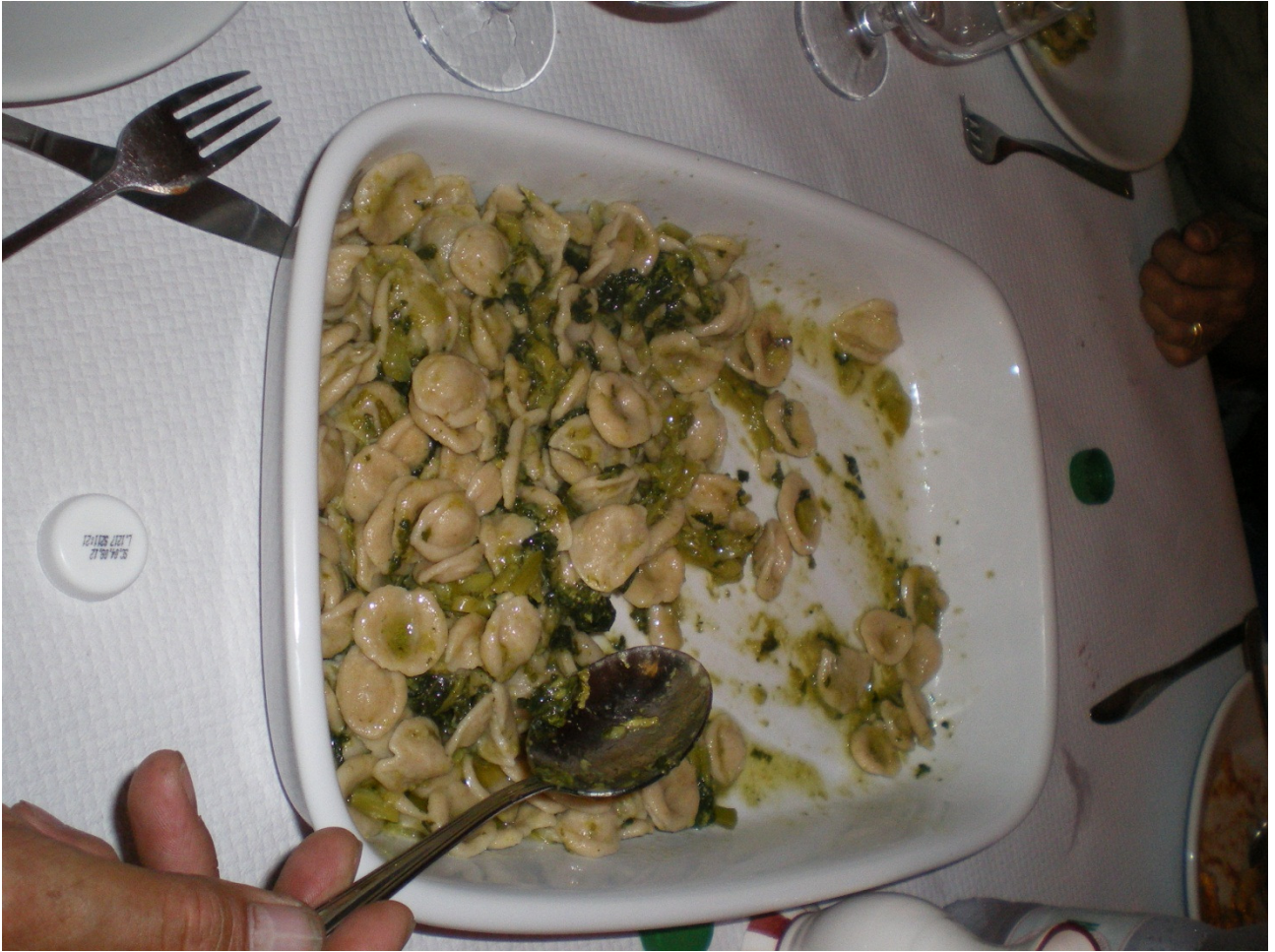
Mercoledì 5 ottobre ..... Lecce ..... il secondo primo