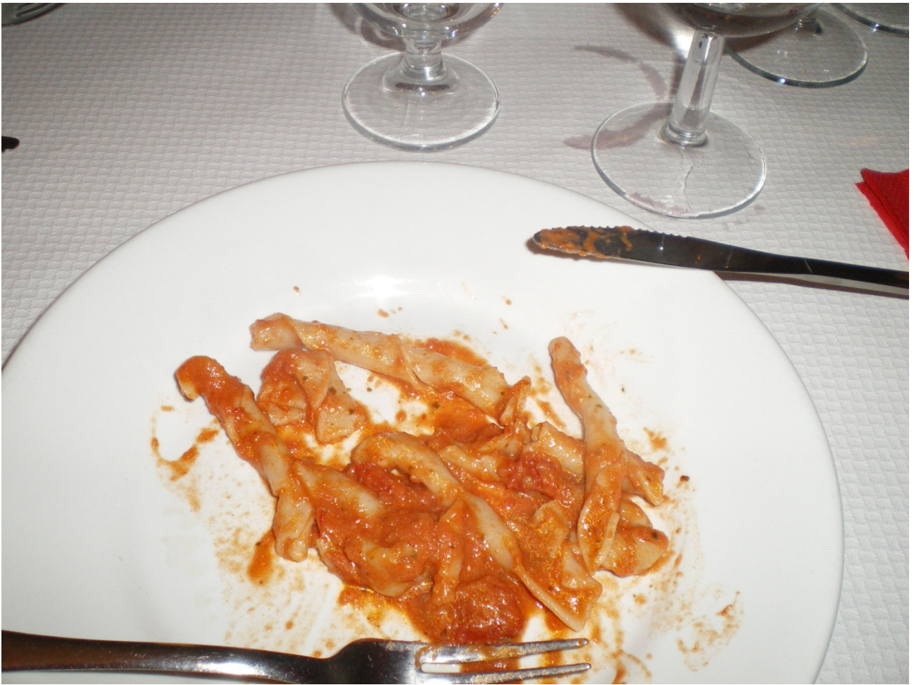
Mercoledì 5 ottobre Lecce .... il primo primo