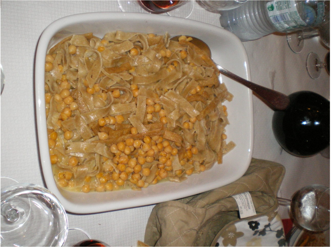
7Mercoledì 5 ottobre Lecce ..... il terzo primo