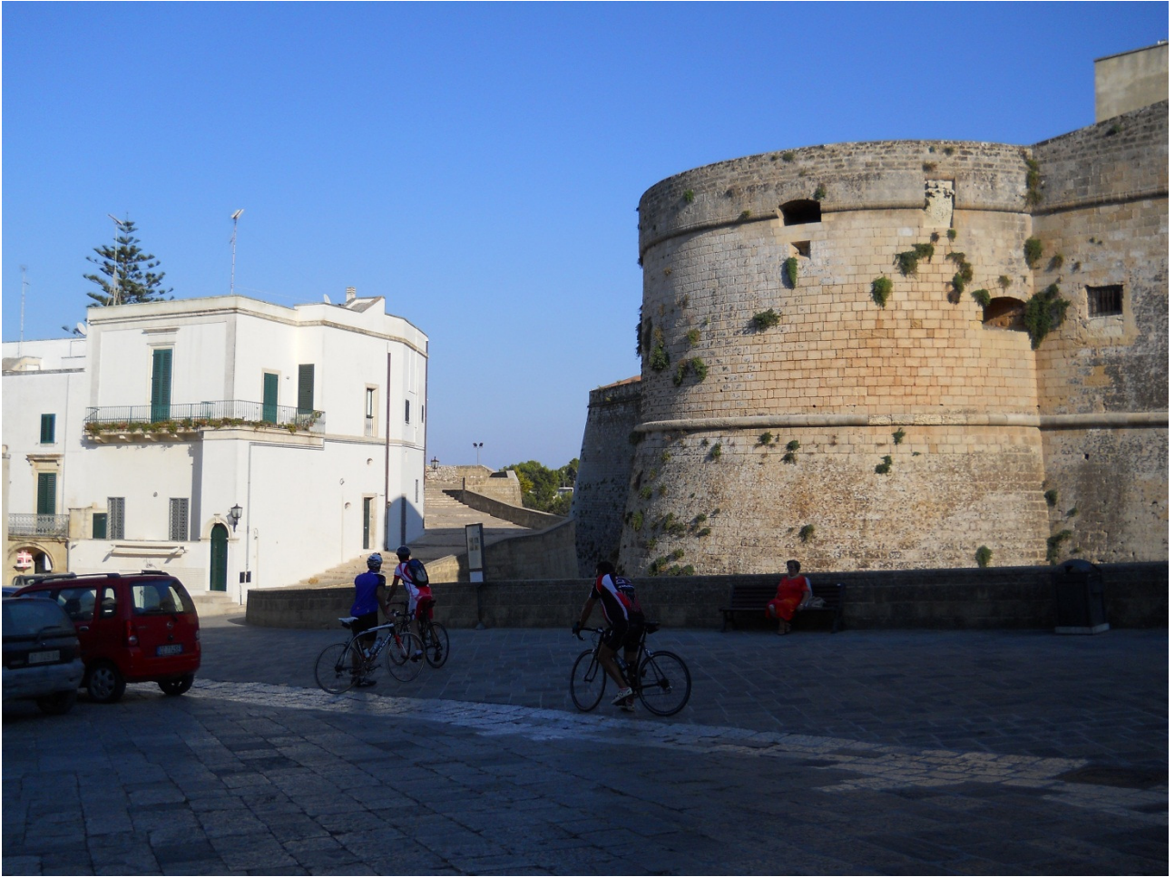
Martedì 4 ottobre ..... i nostri eroi sono già ad Otranto