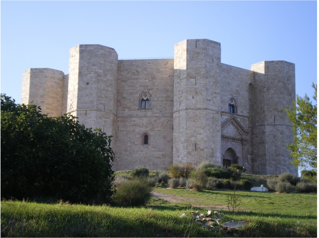
Lunedì 3 ottobre Castel del Monte in tutto il suo splendore