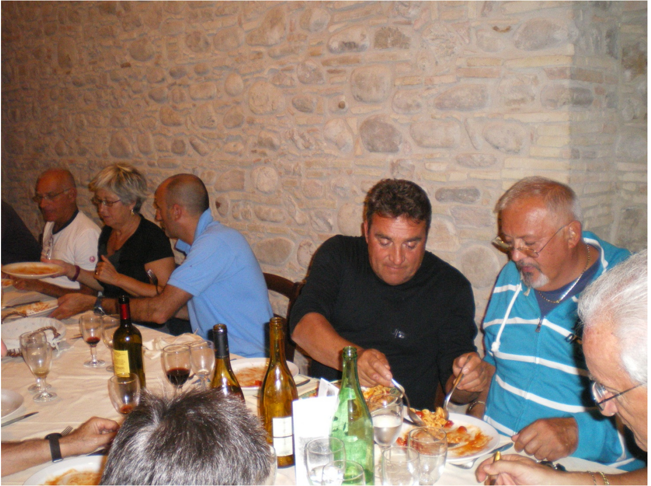
Domenica 2 ottobre Cena all'agriturismo di Troia