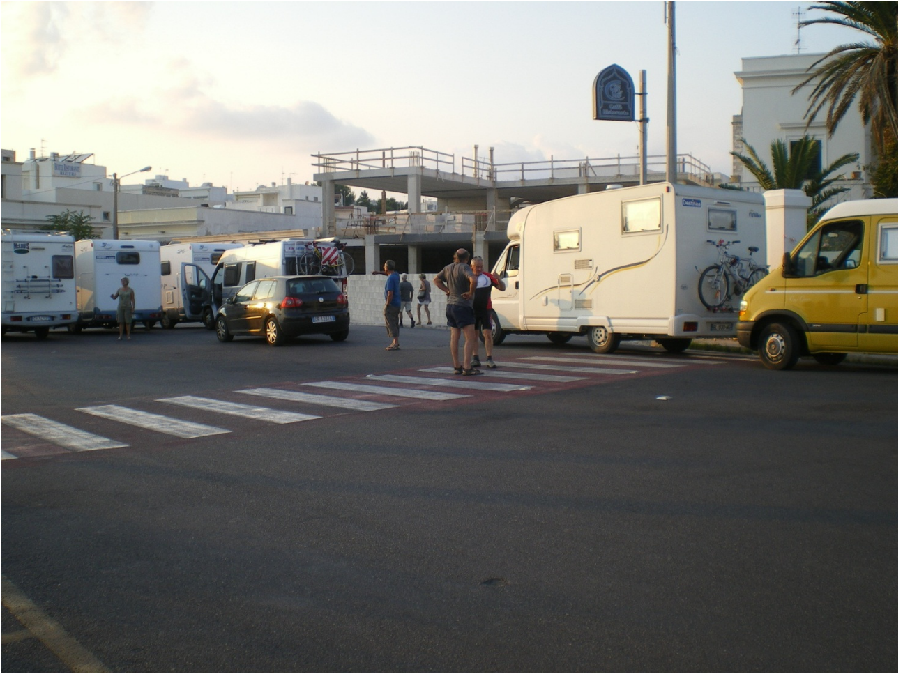
Mercoledì 5 ottobre .... ricongiungimento generale con blocco del traffico a Santa Maria di Leuca