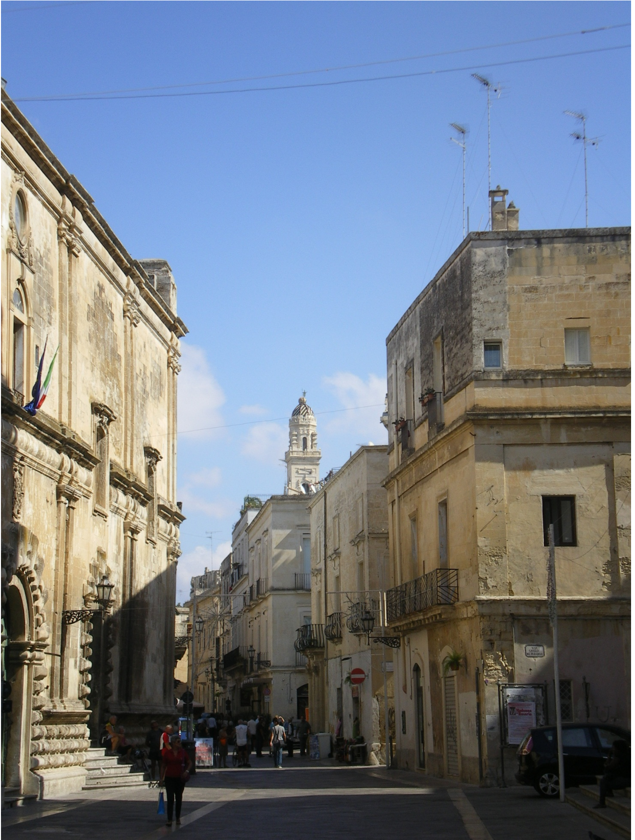
Mercoledì 5 ottobre Lecce