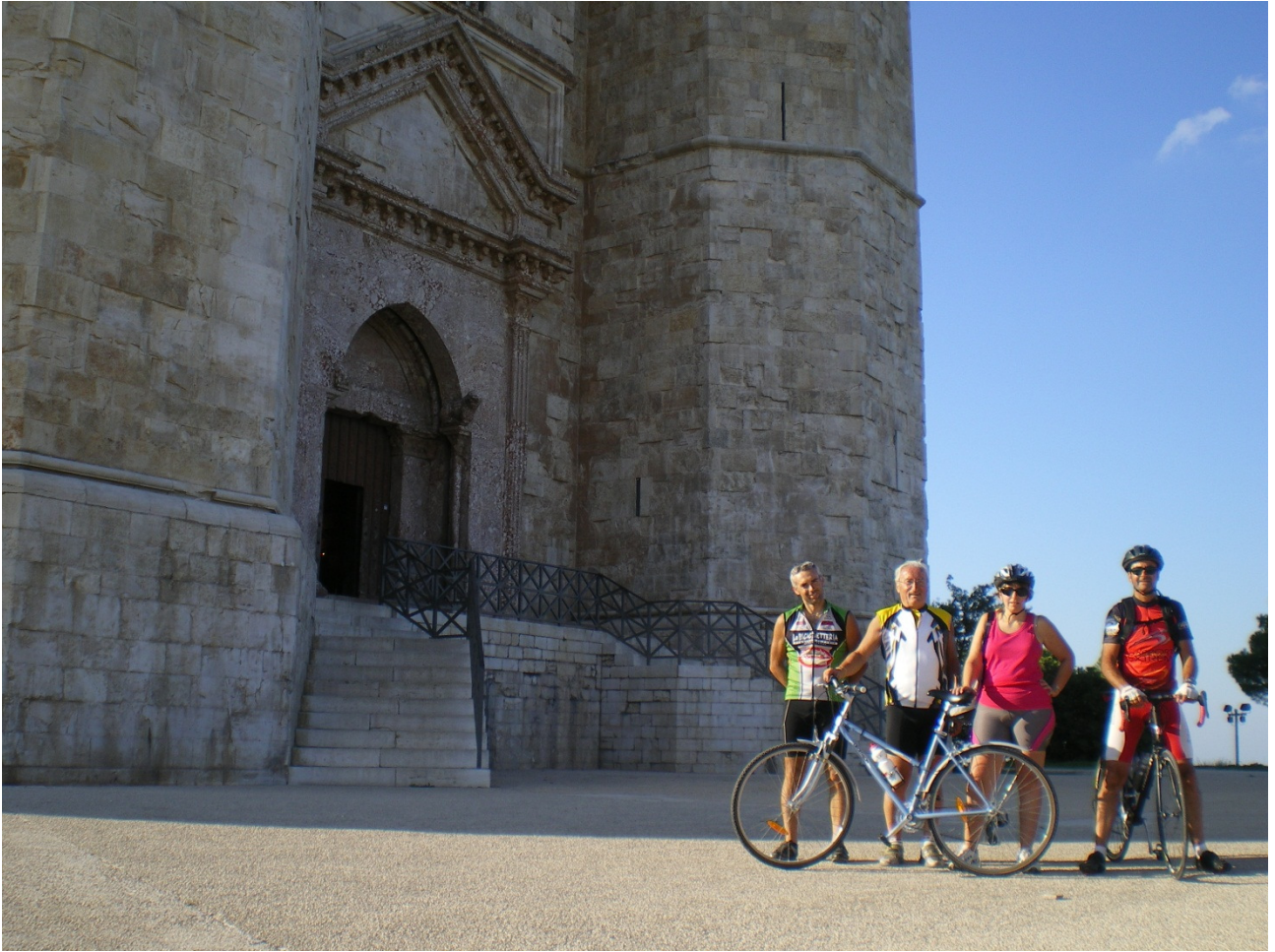
Lunedì 3 ottobre ..... finalmente a Castel del Monte