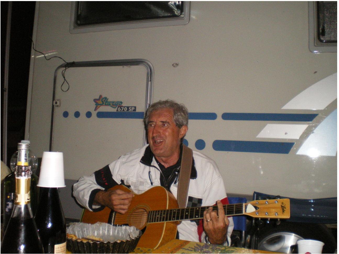
Martedì 4 ottobre Spaiglia Alimini ..... il nostro menestrello