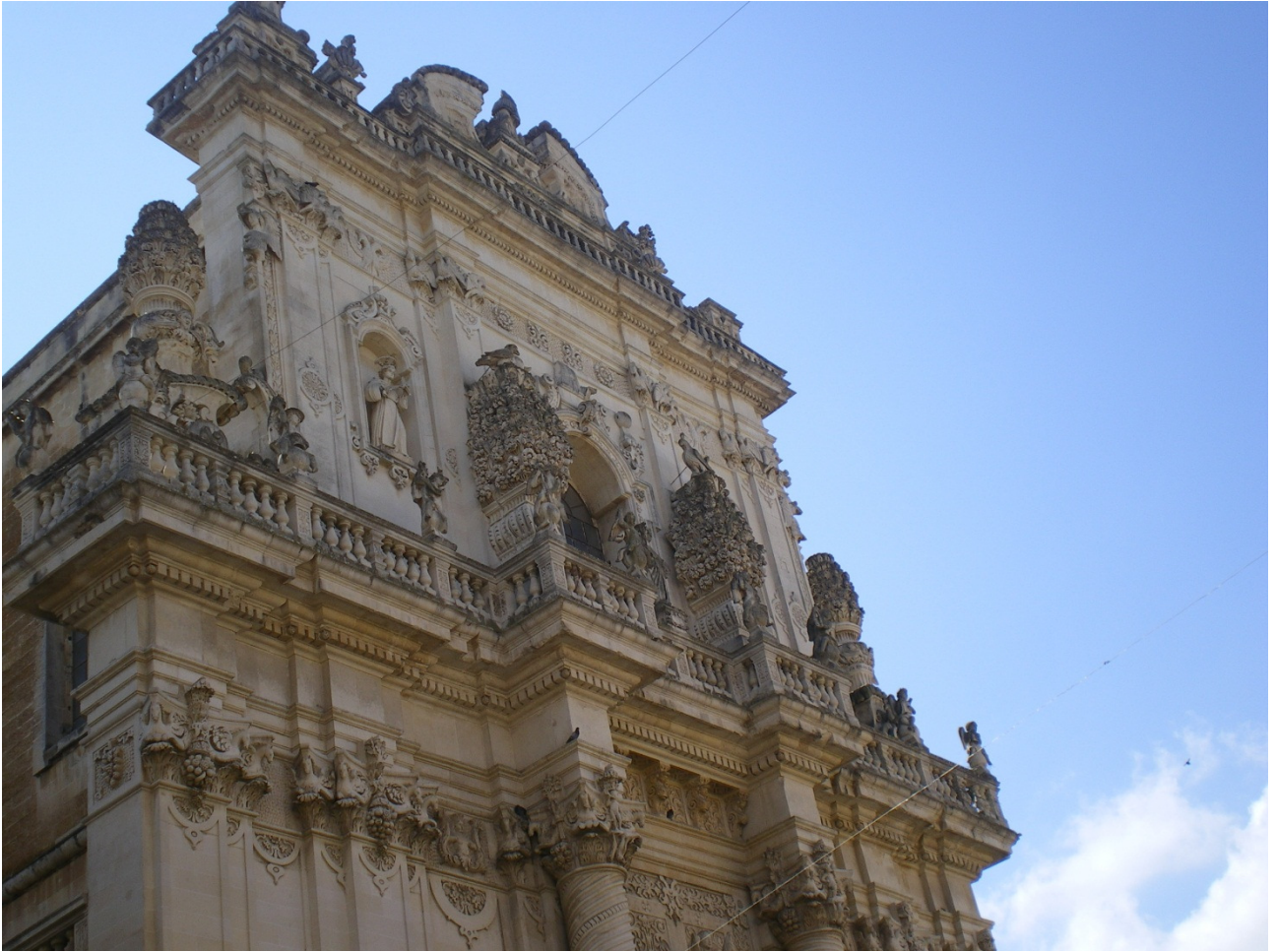
Mercoledì 5 ottobre Lecce