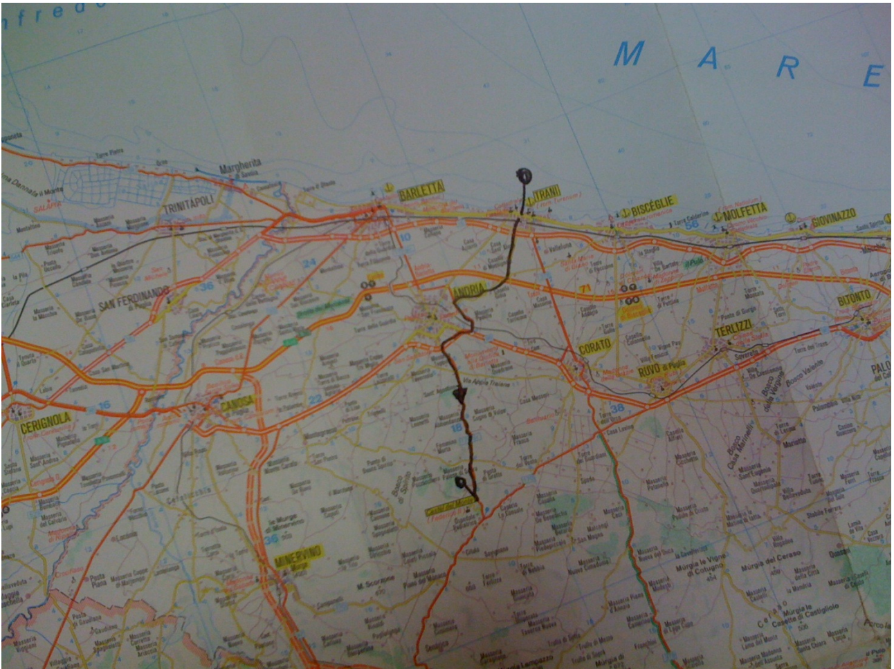
Figura 2 Da Trani a Castel Del Monte (in nero quelle percorse in bicicletta)

Lunedì 3 ottobre Trani – Castel Del Monte (per tutti) km 40 circa (da 0 a 700 s.l.m. di leggera continua salita).