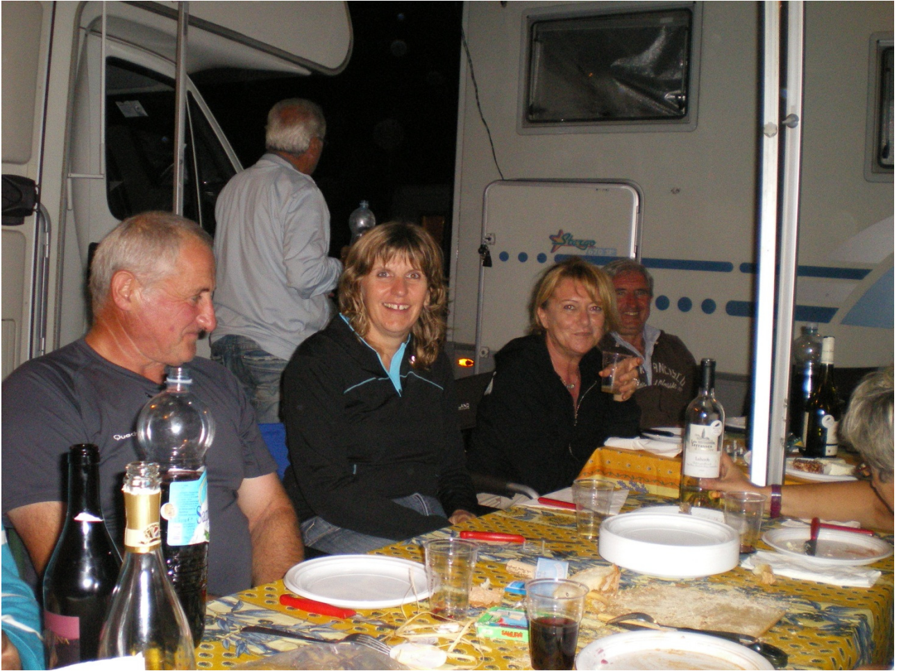
Sabato 1 ottobre Prima cena conviviale a Peschici