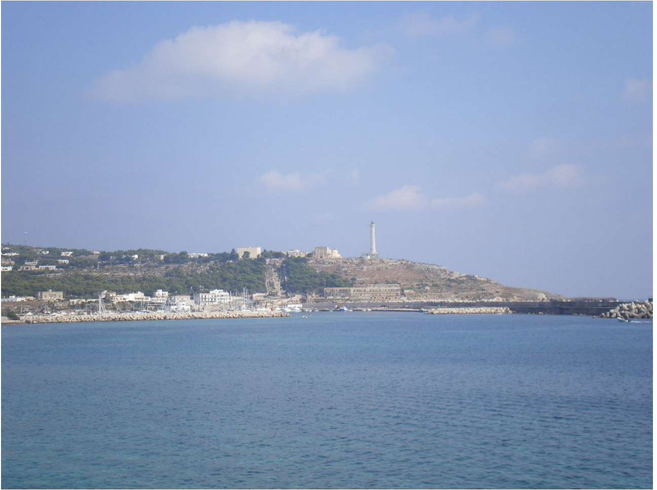
Giovedì 6 ottobre Santa Maria di Leuca .... il faro