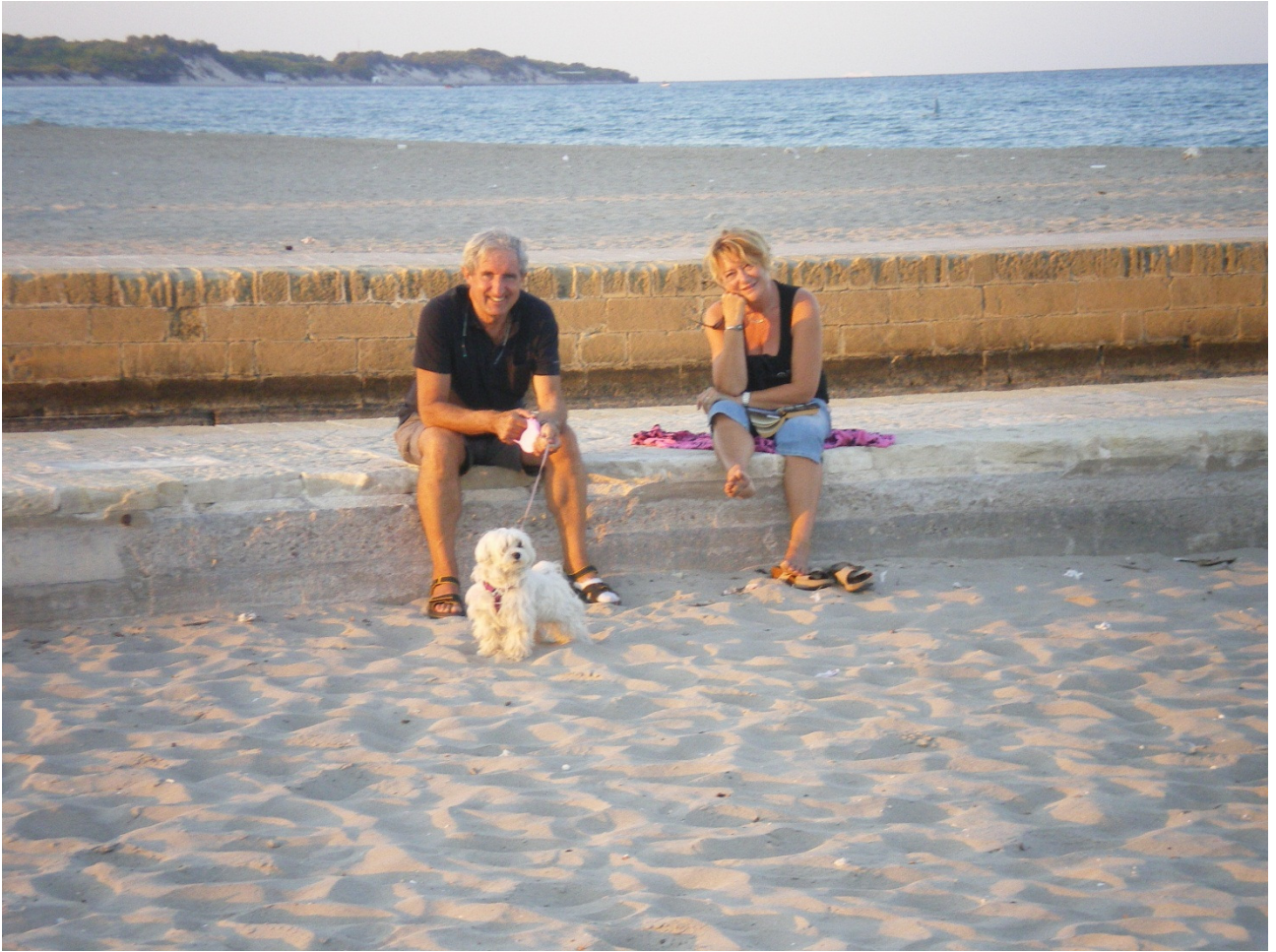
Martedì 4 ottobre Spiaggia degli Alimini