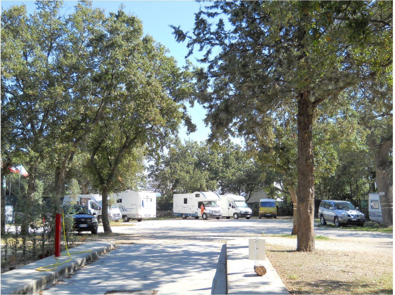
Martedì 4 ottobre il piccolo camping che ci ha ospitato ad Alberobello