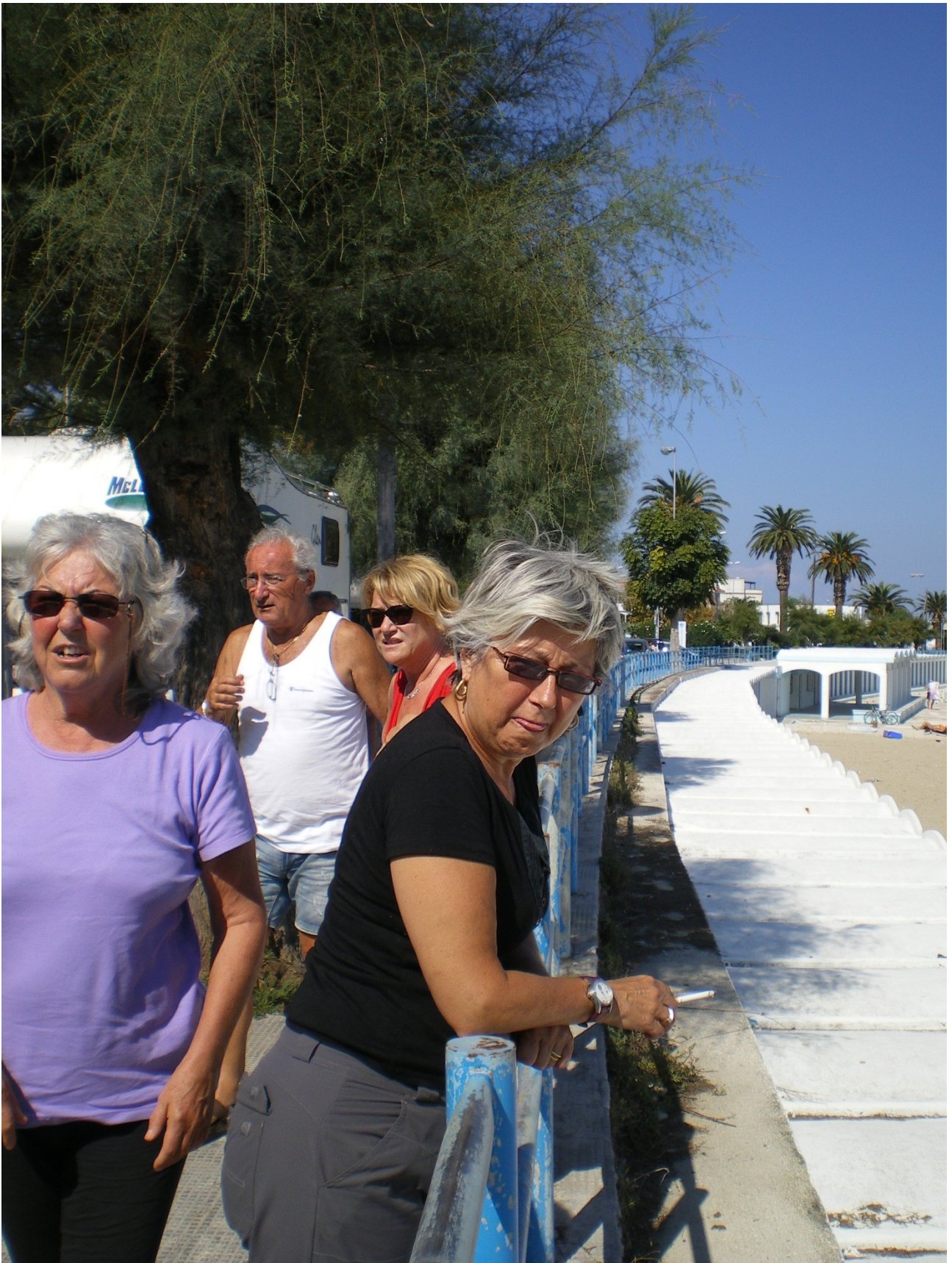
Lunedì 3 ottobre ..... sul lungomare di Trani