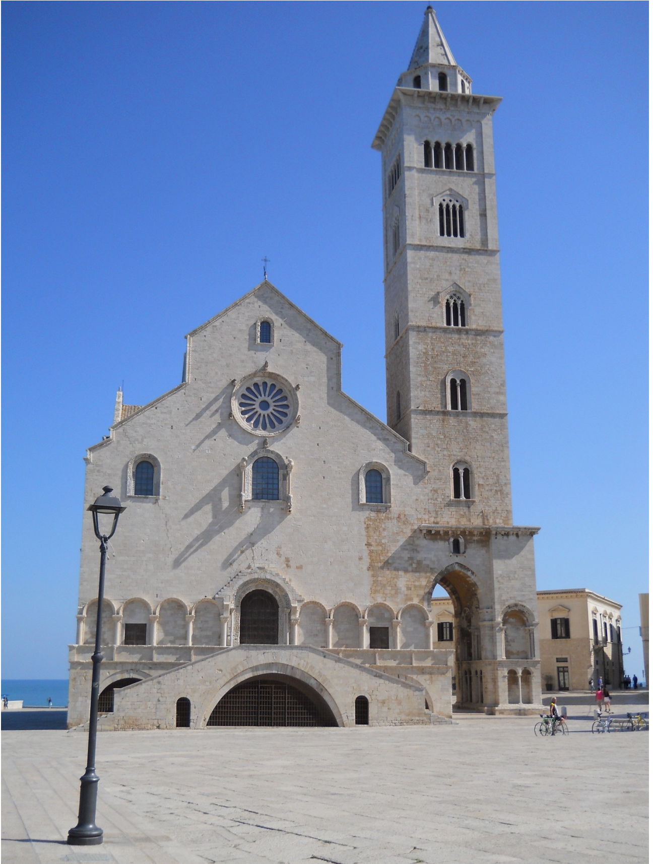
Lunedì 3 ottobre la cattedrale di Trani