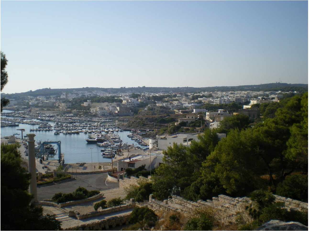
Mercoledì 5 ottobre ... veduta panoramica di Santa Maria di Leuca