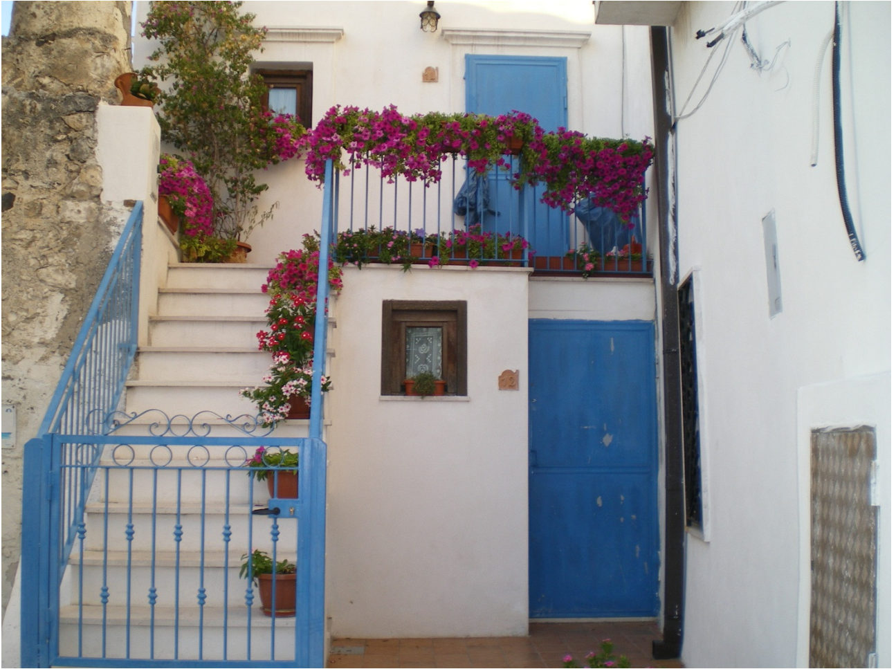
Sabato 1 ottobre Per le vie di Peschici