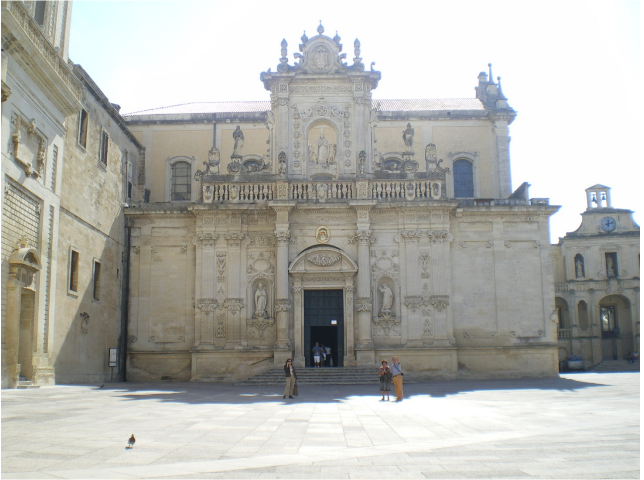
Mercoledì 5 ottobre Lecce