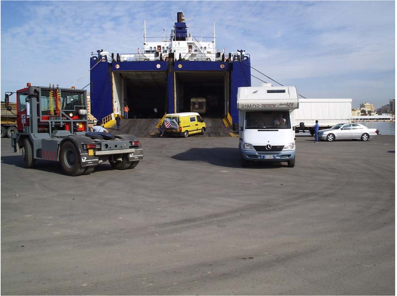
Lunedì 17/10/05 Le operazioni di sbarco nel porto di Trapani.