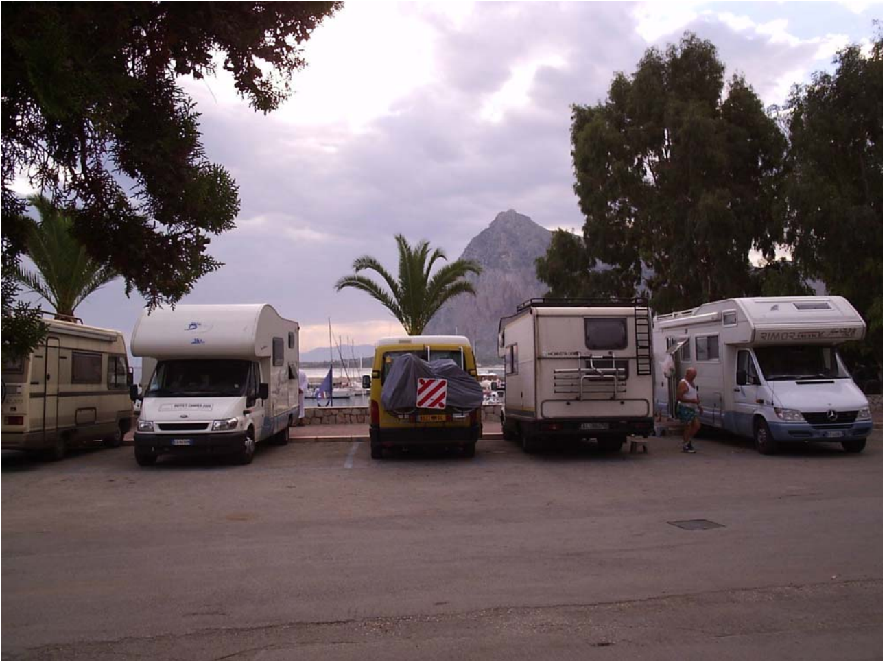
Venerdi 21/10/05 Dettaglio del parcheggio a San Vito Lo Capo.