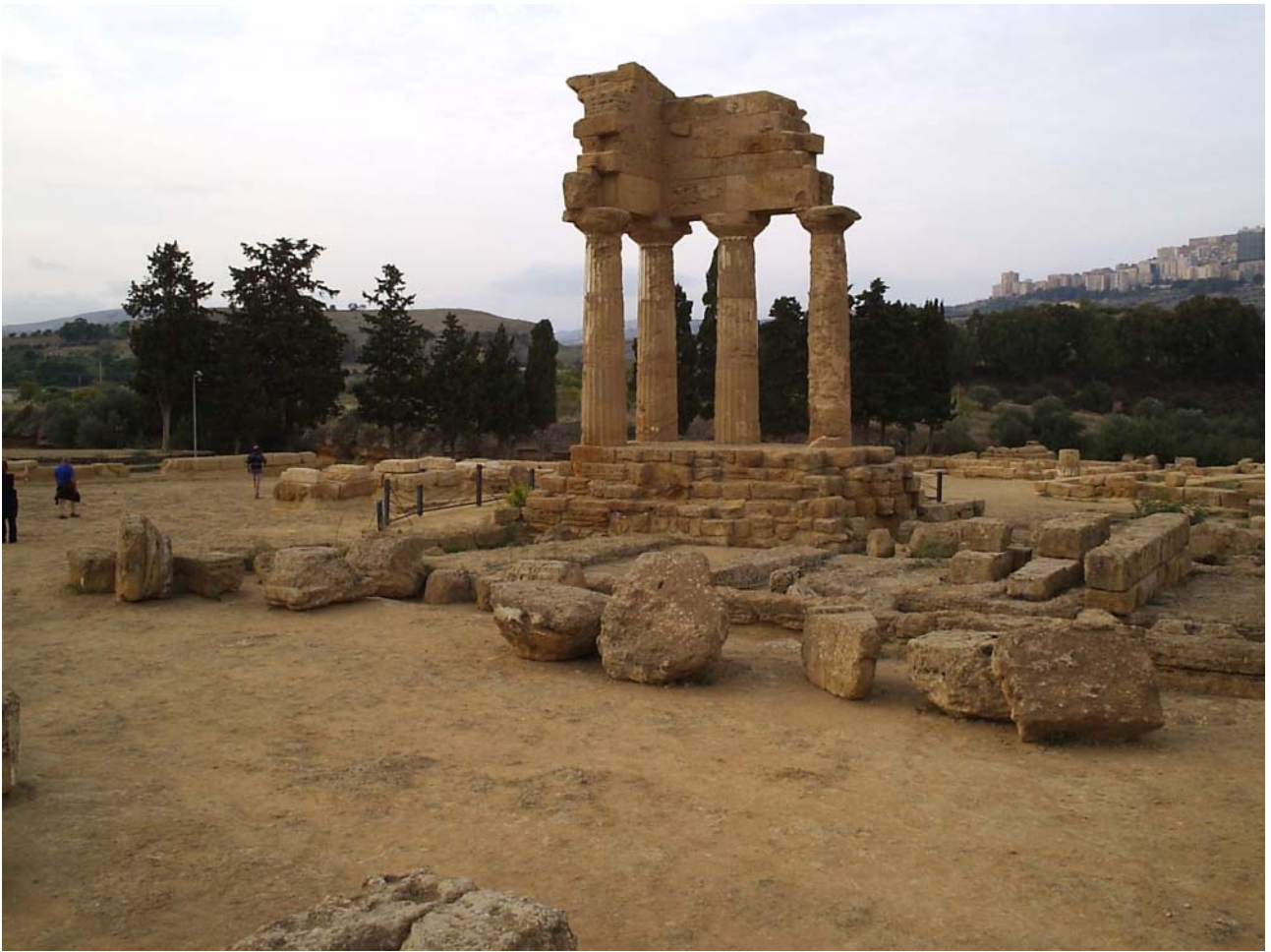
Mercoledì 19/10/05 Altre vestigia del tempo che fu (Valle dei Templi)