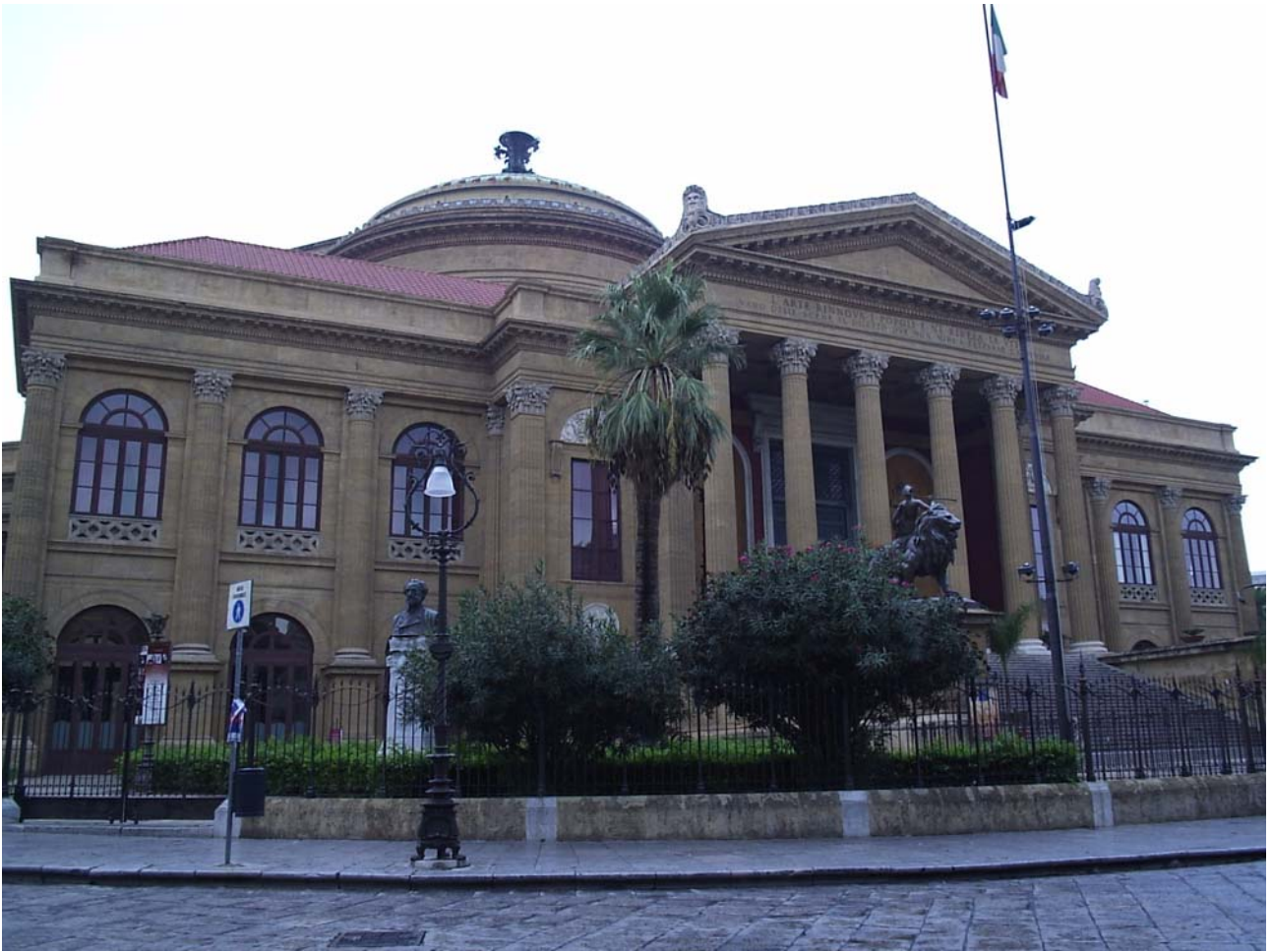
Sabato 22/10/05 Palermo il teatro Massimo (terzo in Europa per dimensioni)