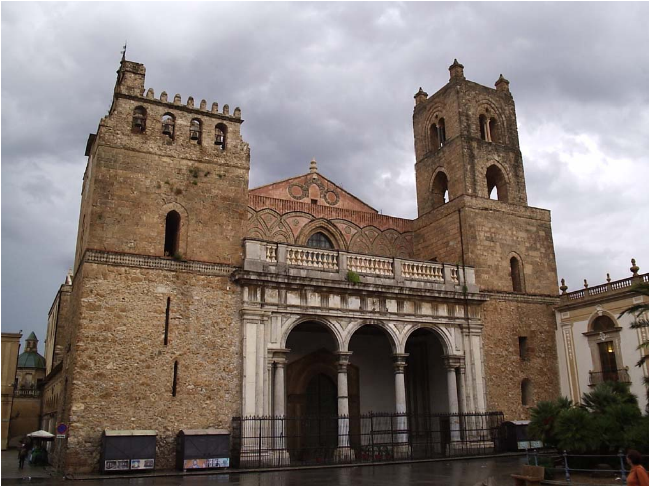
Sabato 22/10/05 Monreale: La cattedrale