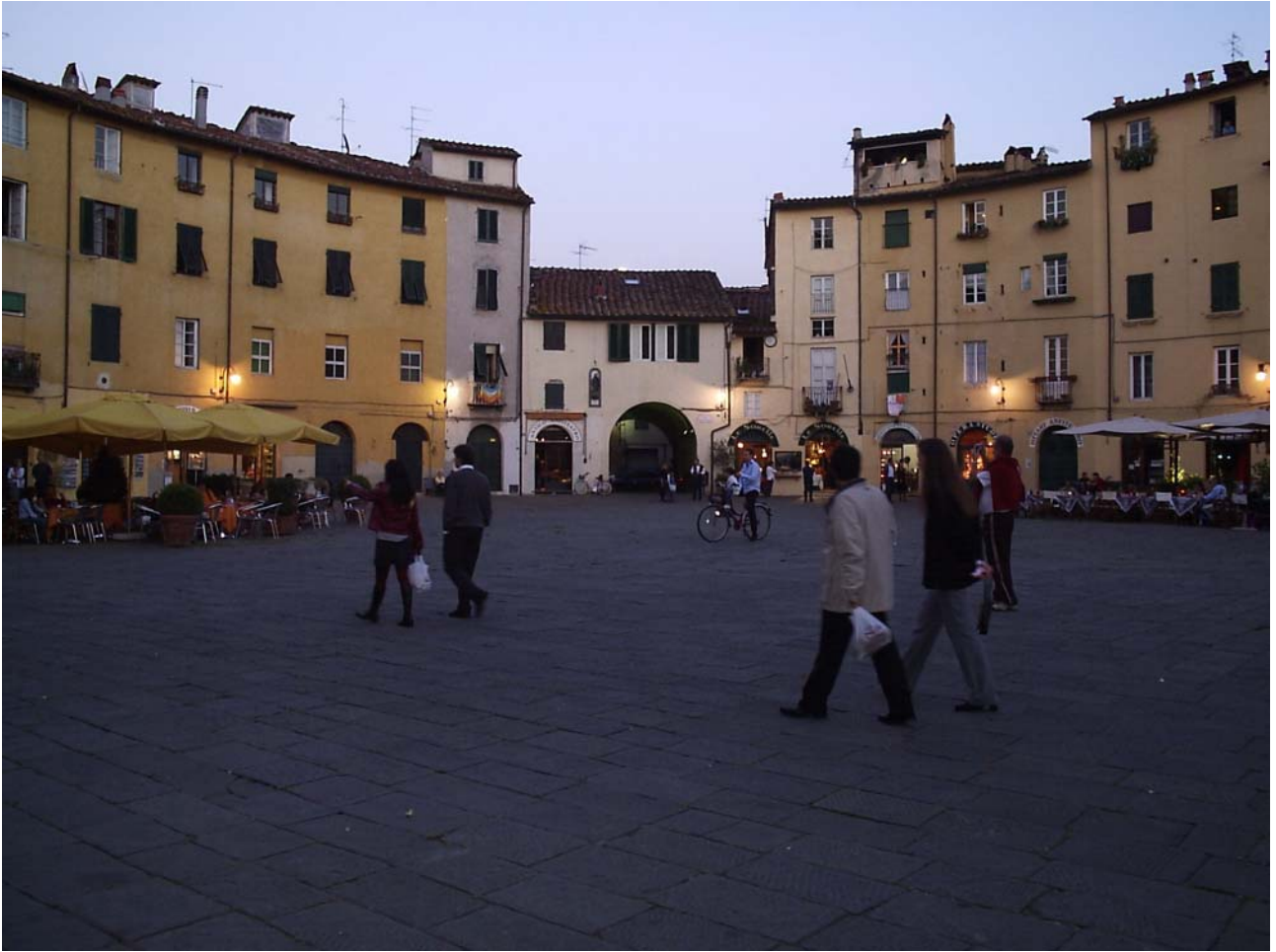
Sabato 15/10/05 Lucca La splendida piazza Ducale