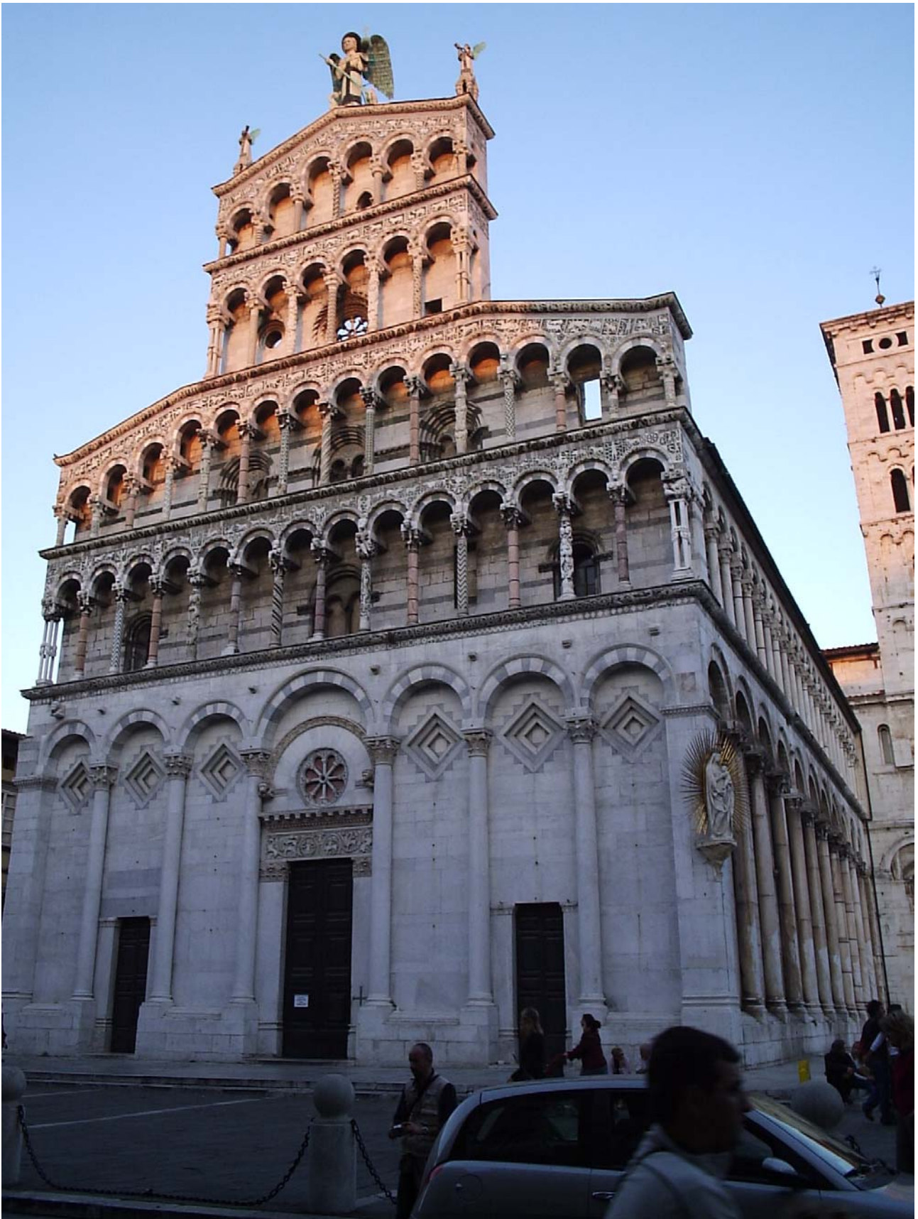
15/10/05 Lucca Il duomo